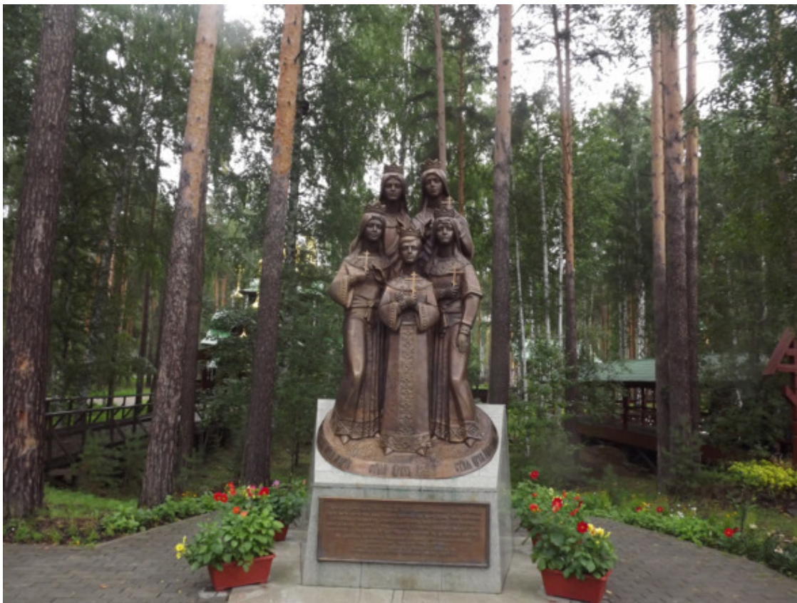
г. Екатеринбург. Ганина Яма. Страстотерпцы. 2014 год.

Под присмотром воспитателей мы купались и бегали в тёплой солёной морской воде. Это было так здорово. Можно было идти пешком в море на сотни метров, а тебе всё по колено или по пояс. Я тогда ещё пытался научиться плавать на море, ведь нас возили на море несколько раз, и это было каждый год. В морской воде учиться плавать легче, чем в пресной воде. Ведь она из-за соли плотнее, а поэтому тело легче держится на воде, выталкивая его. И всё же, уже в школе я научился плавать самостоятельно в 7 – 8 летнем возрасте. Плавал я не плохо, даже в подростковом возрасте имел 3 спортивный разряд.