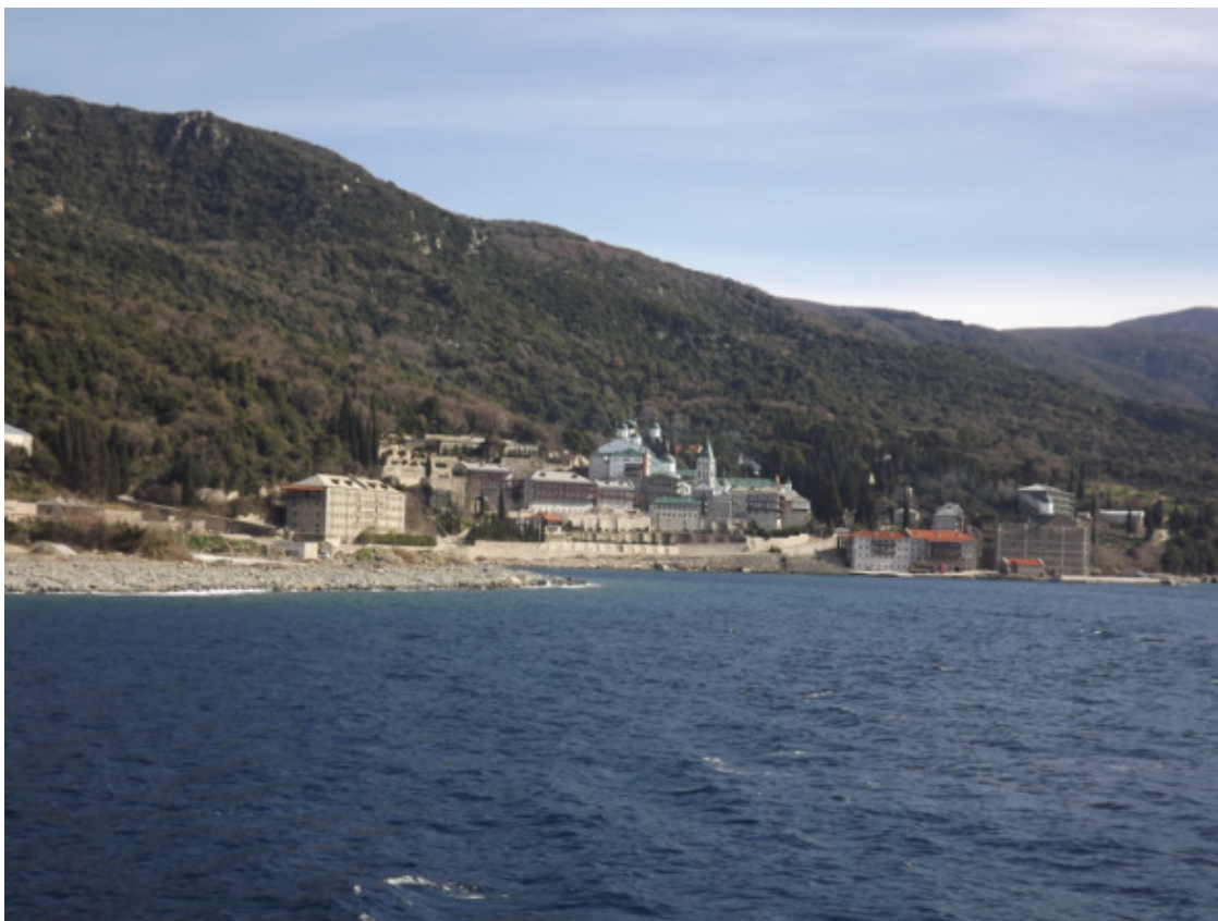
Греция. Святой Афон. Мужской монастырь св. Пантелеймона. 2013 год.

Добавлю. Это была политика. Страх перед Западной Цивилизацией. Там всё развивается и уровень жизни людей очень высок по сравнению с нашими. Страна имела огромный недостаток рабочей силы для подъёма промышленной индустрии и денежных средств. Нужен был надёжный щит от сытых «загнивающих» капиталистов. Перед Руководством страны встал вопрос. Где взять людские ресурсы и деньги. Вот и приняли решение. Село обложить налогом и население само придёт в город и на крупные комсомольско – молодёжные стройки страны. Всё таки процесс проходил без репрессий и арестов, на дворе время было не то. Не 1937 год.