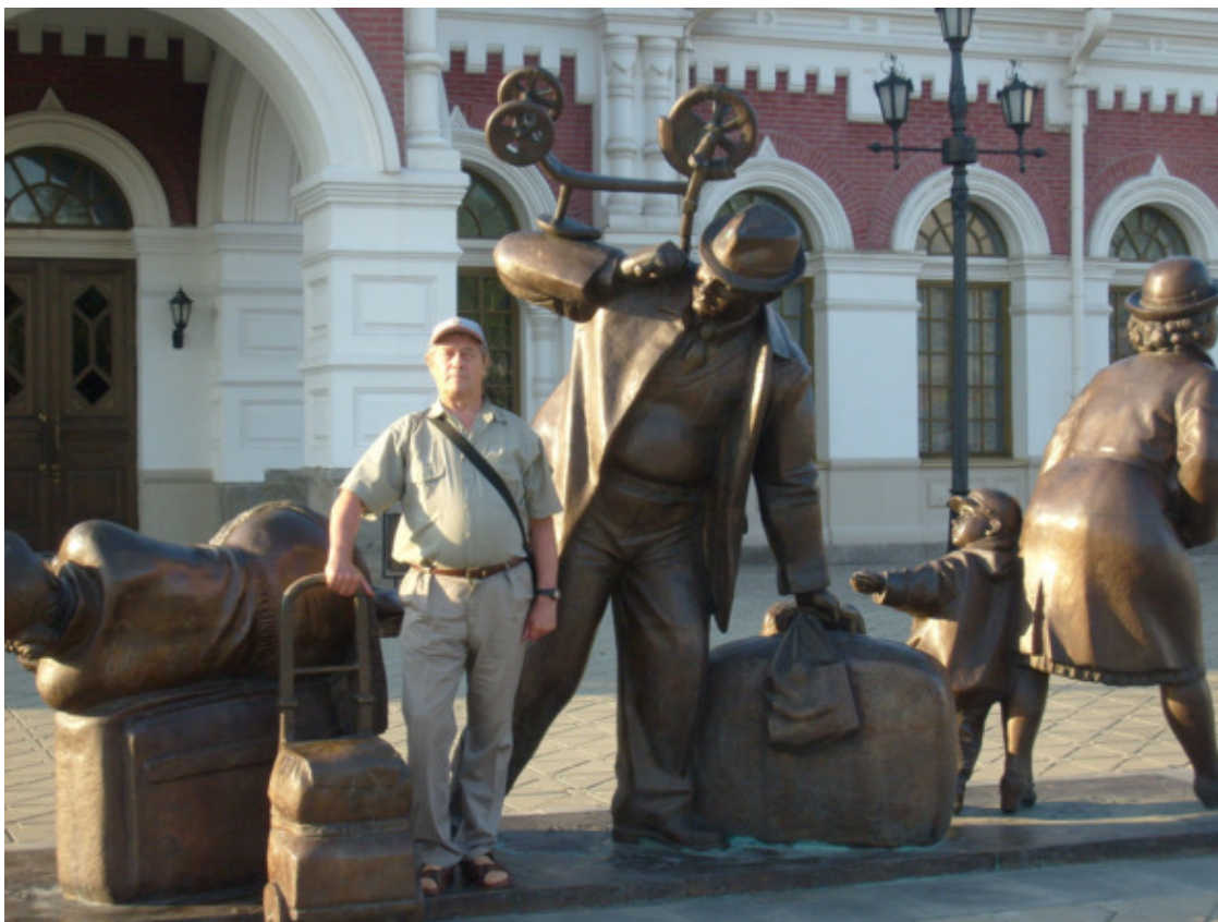
На вокзале г. Екатеринбурга. 2014 год.

А колёса вагон ритмично отстукивали ход времени, удаляясь, всё дальше и дальше на Запад. Перед глазами мелькали леса, которые уходили в бесконечную даль, луга, покрытые зелёным ковром, озёра, реки – вся эта картина осталась неизгладимо в памяти.