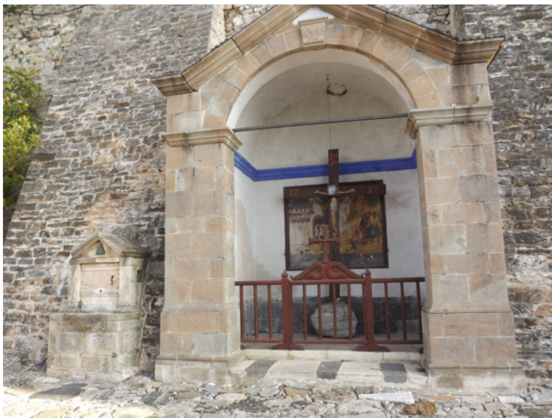
Греция. Святой Афон. 2013 год.

Трудно сейчас вспоминать, когда я в первый раз сел на лошадь. Но в первое же лето я научился ездить верхом, полюбил лошадей, практически пропадал всё свободное время у конюхов в лугах. Нас подобралась компания 3 — 4 человека и мы вместе почти всегда пропадали у лошадей. Это было каждое лето, пока я жил в деревне.