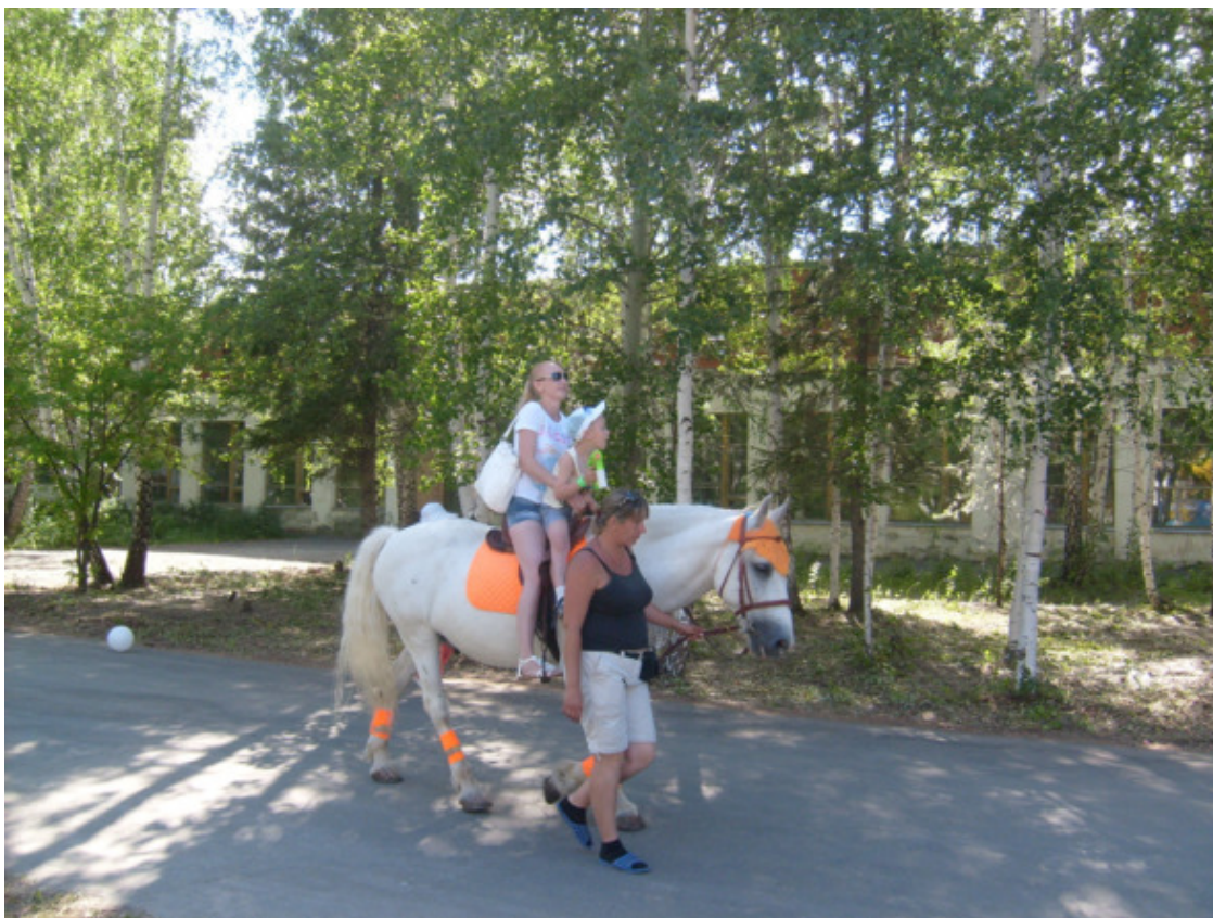
г. Асбест. Дети на лошади. 2015 год.

Сидя на ней и крепко держась за поводья уздечки и гриву, я почувствовал опасную ситуацию и принял молниеносное решение спрыгивать с лошади. Слетая с лошади, изо всех сил я оттолкнулся руками от гривы и приземлился ногами на землю, при этом сделав кувырок назад через голову, как в спортзале на матах.