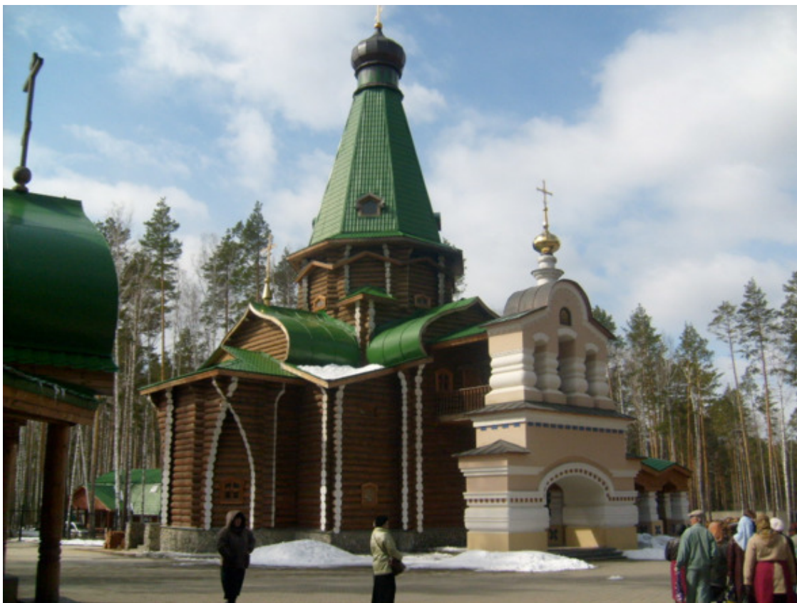
Ганина Яма. г. Екатеринбург. 2014 год.