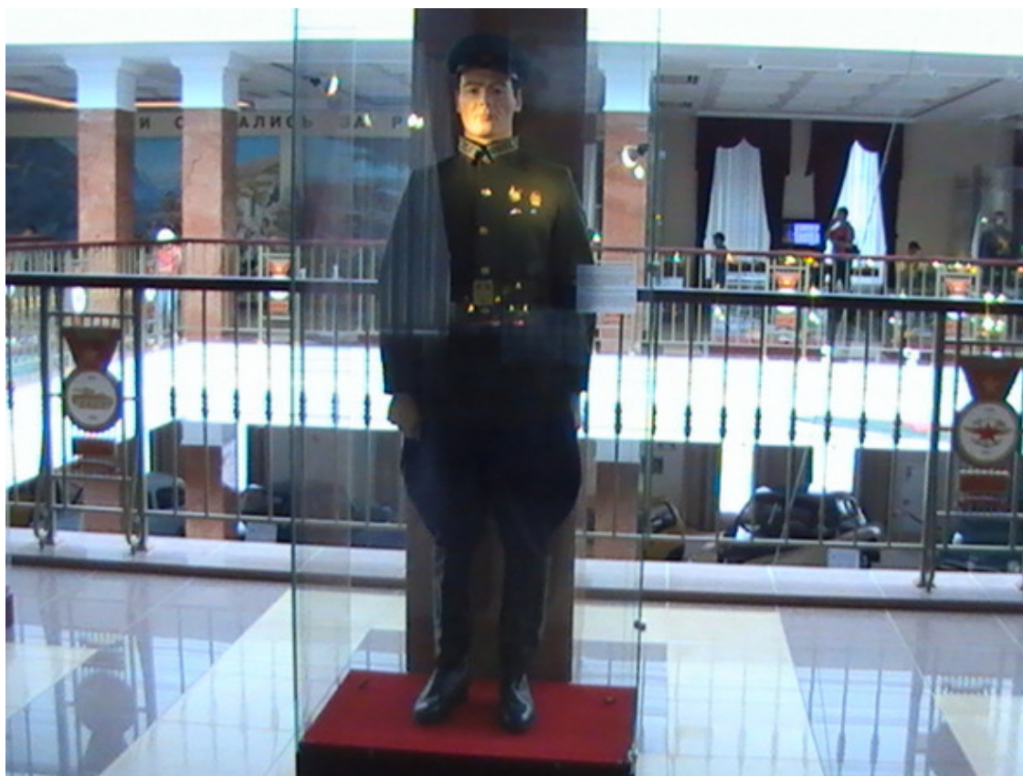
г. В – Пышма. Защитник Родины. Военный Музей. 2015 год.