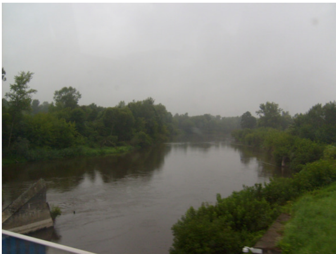
г. Асбест. Мальшевский мост. 2008 год.

Я был свидетелем при кастрировании молодых жеребцов. Операция эта болезненная, когда её проводят, то жеребцы громко кричат и их далеко слышно. Проводили операцию в станке, привязывая лошадь, у пруда, не далеко от кузницы, недалеко и от школы и клуба. Зрители по неволе всегда находились.