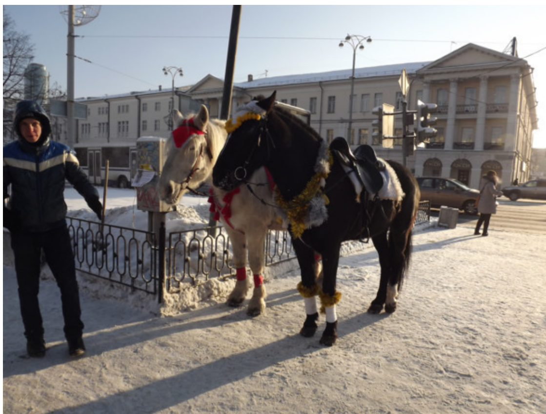
г. Екатеринбург. 2017 год.

Ездили мы на лошадях без седел, а их у конюхов днём и не было. На худую лошадь под свою задницу подкладывали старую фуфайку или садились на голую её спину. Я думаю, что нас это спасало не раз, падая с лошади, летишь кубарем на землю, не зацепляясь за стремя т. д. Отдельваешься легкими ушибами и всё. Вскакиваешь с земли и снова садишься на лошадь. Я с лошадью с дюжину раз падал, удачно, ничего не сломал и не повредил себе. Бог хранил меня. Научился ездить и в седле, очень удобно. При езде рысью на лошади нужно под шаг привставать в стремях седла, и езда ведётся плавно. Галопом скакать в седле на лошади одно удовольствие. Сидеть в седле нужно расслабленным без напряжения.