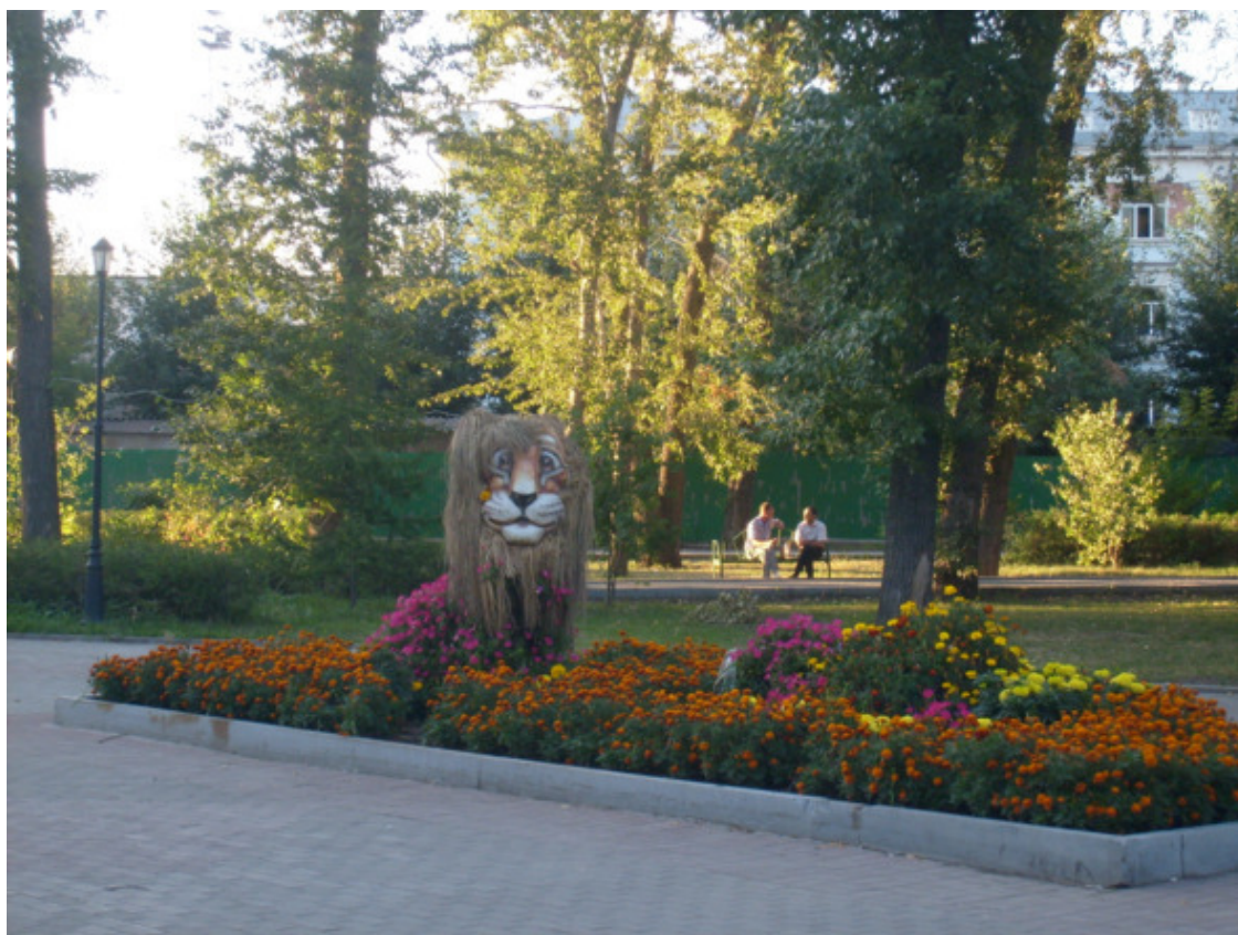
г. Екатеринбург. 2015 год.

ная церковь. Поскольку мы приехали зимой, то село было покрыто снегом, деревья садов выглядели раздетыми и серыми. И всё же, в селе была видна жизнь. Из трубы каждого дома валил дым, печи топили в основном углём «антрацит», очень калорийный уголь, топили и каменным углём, у которого калорийность ниже, зато был дешевле. Русскую печь топили только дровами, в ней часто готовили на открытом огне вкусную пищу. Например, русские щи с мясом из свинины или из говядины в чугунном котелке. Вкус и запах не забываемый. Если на улице темно, то в окнах горел тусклый свет. Электрического света еще в селе не было, поэтому жители села пользовались керосиновыми лампами. Из дворов слышалось мычание коров, блеяния овец, крики петухов и другой птицы. Словом, село жило своей жизнью в зимнюю пору.