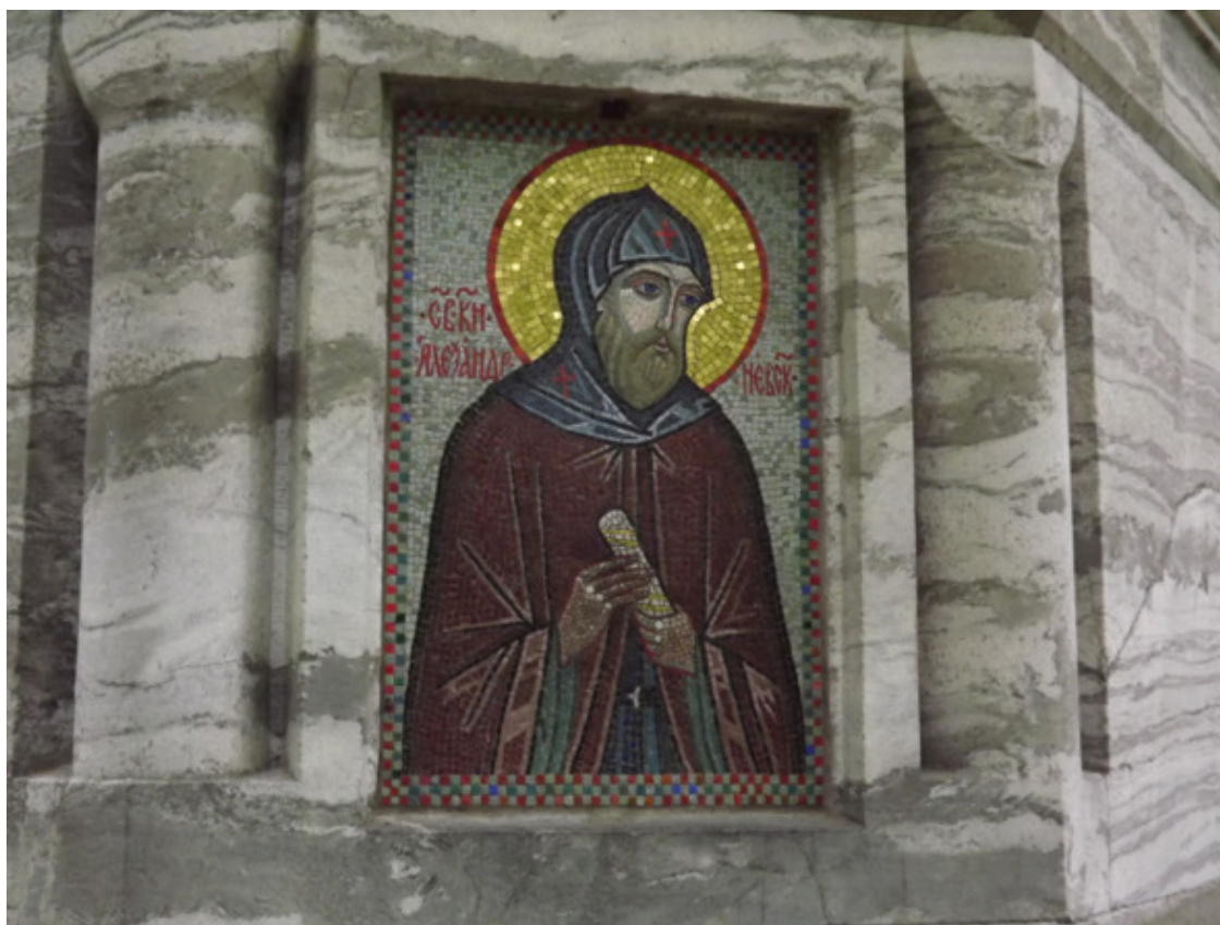
Остров Валаам. Св. Преподобный Александр Невский. 2014 год.

Тётку со мной на руках толпа сбила с ног и она, спасая меня, укрыла своим телом.