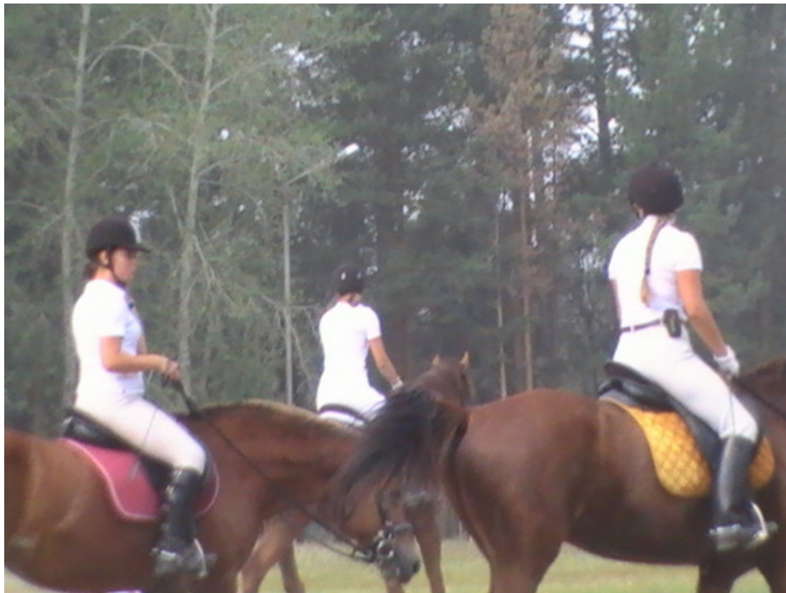
г. Асбест. Выступления наездниц. 2015 год.

Табун лошадей этого колхоза пасся рядом с нашими лугами, где граница была озеро и речка. Несколько лошадей пересекли речку и оказались на наших лугах, всегда чужое вкуснее. Это произошло днём. Наши пастухи загнали их в табун наших лошадей. Надо сказать, табун чужих лошадей не принимает и старается их вытеснить, при этом кусают и лягают их.