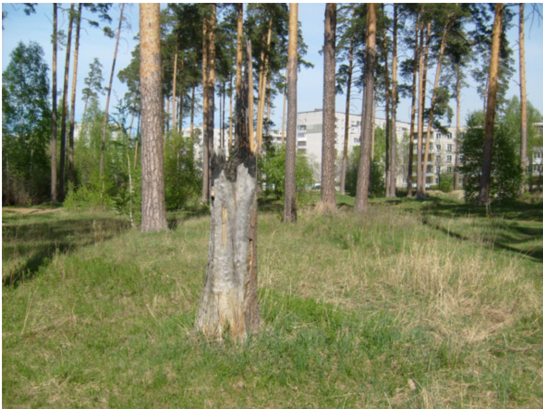
г. Екатеринбург. 2016 год.

А кругом пролегали дремучие леса, величавые ели, стройные сосны, пихта. Природа благоухало и пахло хвойным лесом. Лесные птички насвистывали свои лесные трели, и звук их распространялся на весь лес. Наступал летний день, светило ласково солнце и было так хорошо.