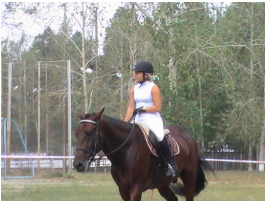
г. Асбест. Наездница. 2015 год.

Невзрачный вид был и изнутри. Ремонт никто не занимался. Одним словом, колхоз.