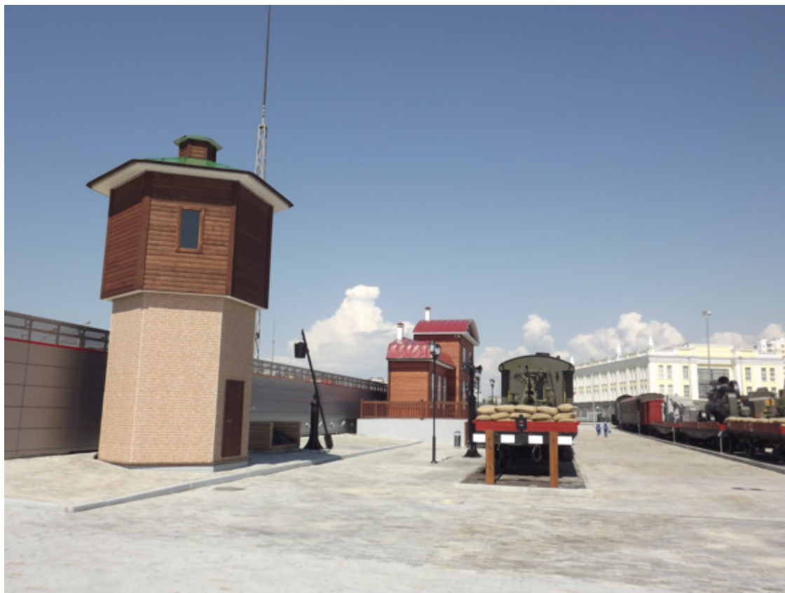
г. В – Пышма. Военный Музей. 2015 год.

Поезд шёл в южном направлении через г. Рязань – это от г. Москвы 220 километров. От г. Рязани до станции Исаково 45 километров, где мы должны были сойти. Итого, от г. Москвы всего 265 километров. Около пяти часов езды на поезде.