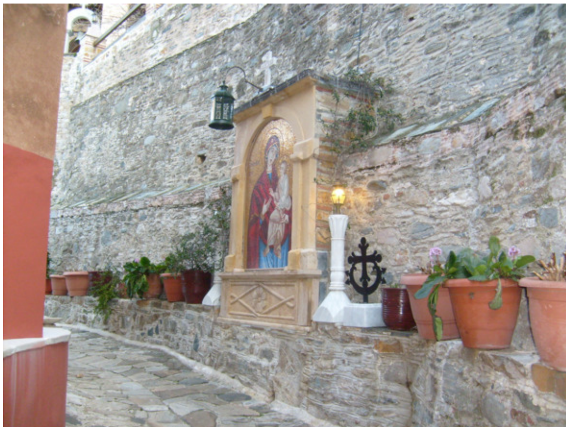
Греция. Святой Афон. Мужской монастырь «Дахияр». 2013 год.