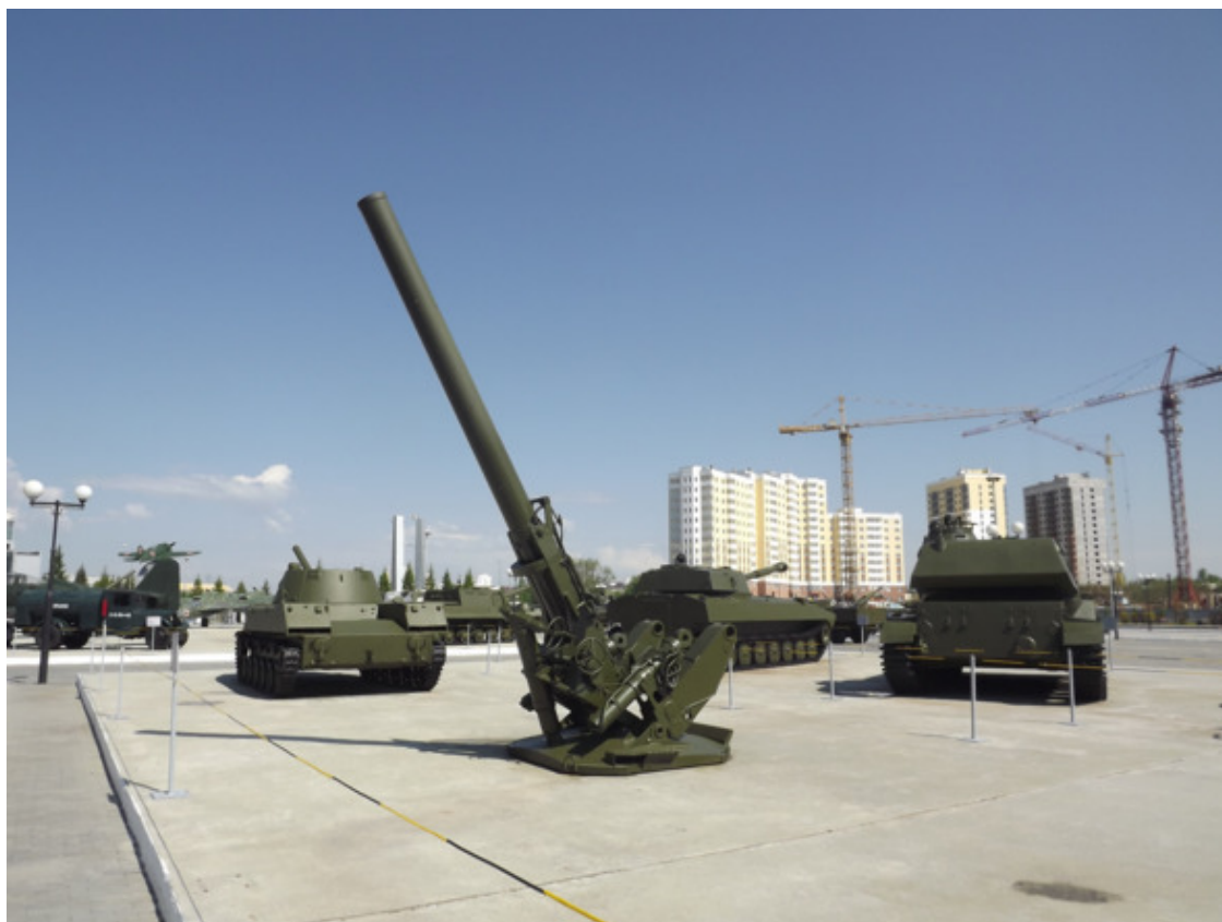
г. В – Пешма. Военный Музей. 2015 год.

Это были следы крови. А главное, пуля – дура прошла мимо, не задев никого из нас. Однако, пролетев около 10 —15 метров, пробила стекло в окне дома. Мы от испуга все разбежались в разные стороны. На наше счастье всё обошлось благополучно. Это был для нас уроком на всю жизнь. Не лезь туда, чего не знаешь. Но разборки всё же были. Досталось моему товарищу от отца, милиционеру. И даже у него были неприятности на службе за плохое хранение боеприпасов и оружие. Не исключено, что и не законно. Вот так.