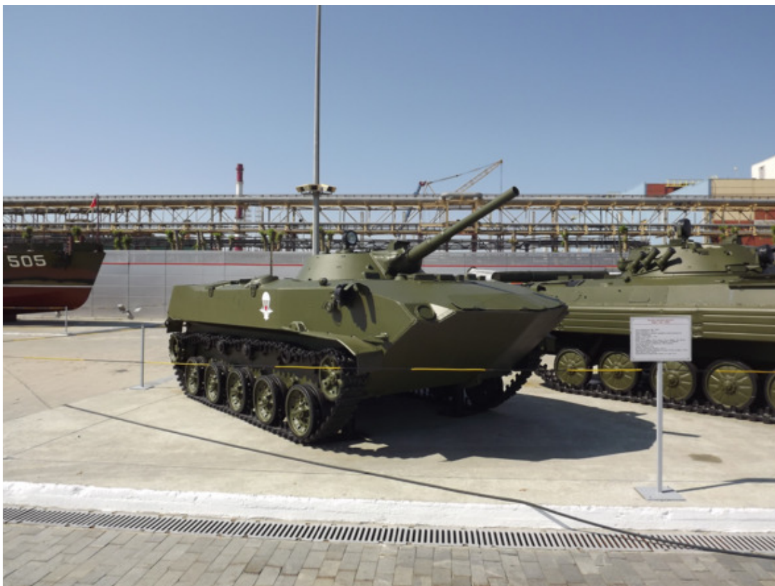
г. В – Пышма. Военный Музей. 2015 год.

Во дворе у нас была своя компания до десятка, пятнадцати человек и мы играли в войну, лапту, футбол или в прятки, одна из любимых игр дворовых ребят. Но были у нас и войны местного значения между дворами, которые переходили и в рукопашное сражение. Всякое было, и нос разбивали и синяки наставляли. Один раз встретились с ребятами через улицу из соседнего двора и стали перекидываться кирпичами, что лежат у дороги. Ребята с соседнего двора не выдержали и побежали, ведь камни были настоящие. Вдогонку мы ещё активнее стали бросать камни.