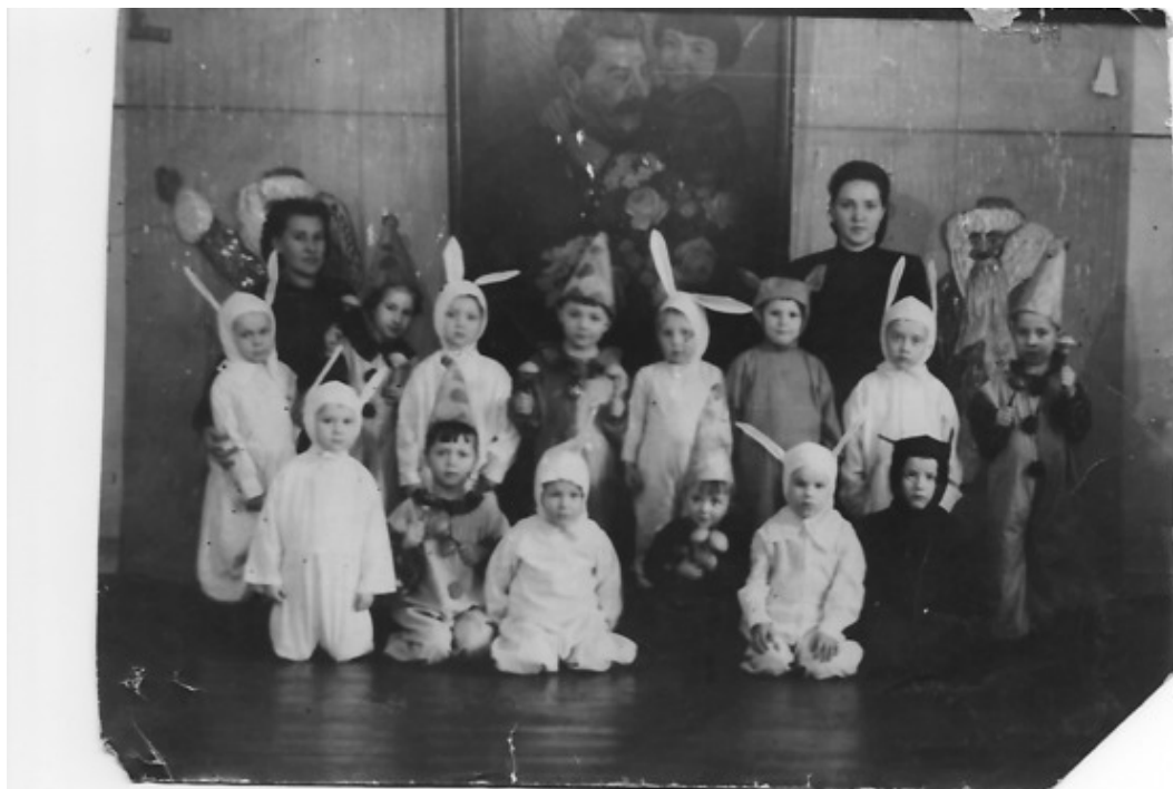
Детский сад. г. Молотовск. 1950 год.

на северо-запад. В вагоне находилось несколько семей, стояла буржуйка, возле которой всегда сидели взрослые и дети. Здесь же готовили еду.