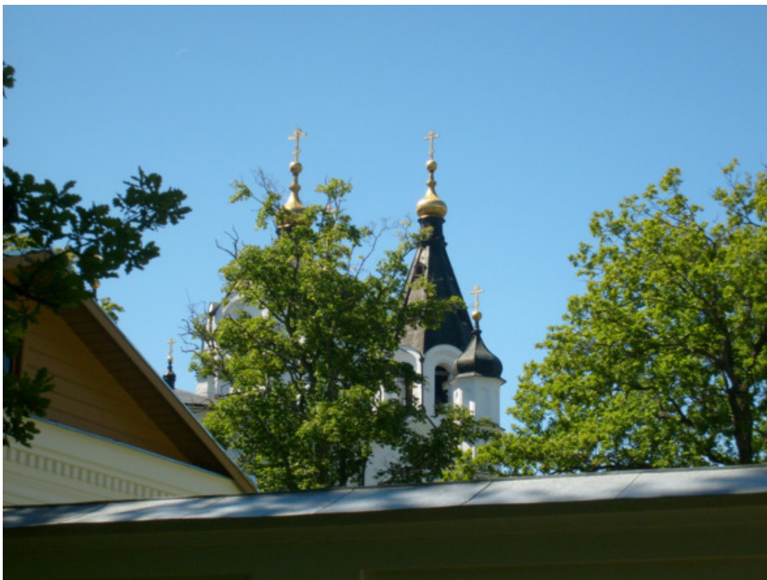
Остров Валаам. 2015 год.