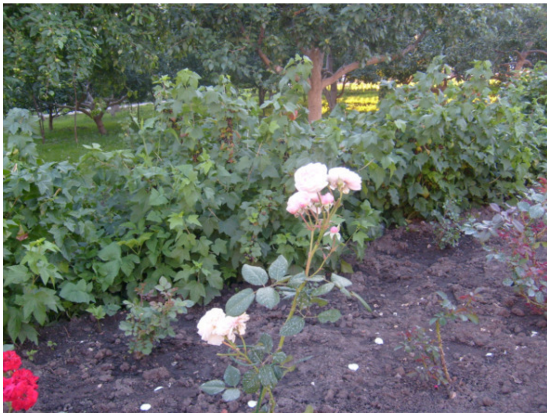
г. Дивеево. Цветок счастья. 2012 год.

Нужно отметить, что лето для деревенских ребят является и испытанием на трудовую повинность в домашнем хозяйстве. На них возлагается достаточно высокая физическая нагрузка по работе дома. Через это и я прошёл. Это копка огорода в ручную лопатой. На это уходит от одной до двух недель. Практически с раннего утра до вечера. Обычно днем из – за жары работы прекращаются и взрослые отдыхают, а мы собираемся, где ни будь, и идём купаться на речку. Ближе к вечеру нас ждёт трудовая повинность и так всё лето. После копки идёт посадка парниковых огурцов и семян на грядки, которых сажают до 12 и более соток.