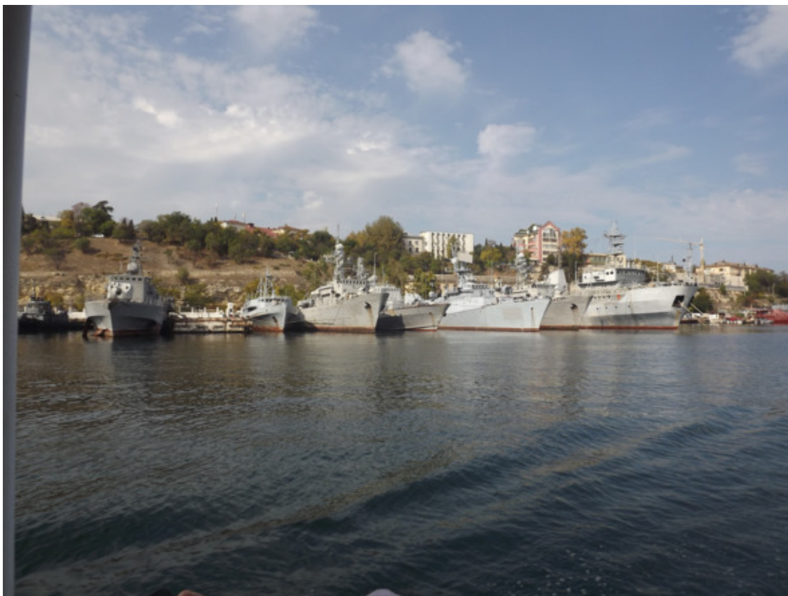
Крым. Севастополь. 2015 год.

Помню, поехали мы ещё на мотоцикле «Москвич» на Ягры, так называли пляж на море, где мы отдыхали с детским садиком. Мне было тогда лет семь. Я уже сидел на заднем сиденье. Мы проезжали через железнодорожный переезд, и мотоцикл сильно трянуло, я не удержался и мотоцикл уехал из-под меня. Я шлёпнулся прямо на мостовую задним местом, конечно, были ушибы, но не сильные. Я закричал, и отец подъехал ко мне и стал успокаивать. Затем я сел на мотоцикл, и мы поехали дальше на море. В дальнейшем я старался всегда крепче держаться на мотоцикле. До моря доехали нормально, позагорали, купались и прекрасно отдохнули.