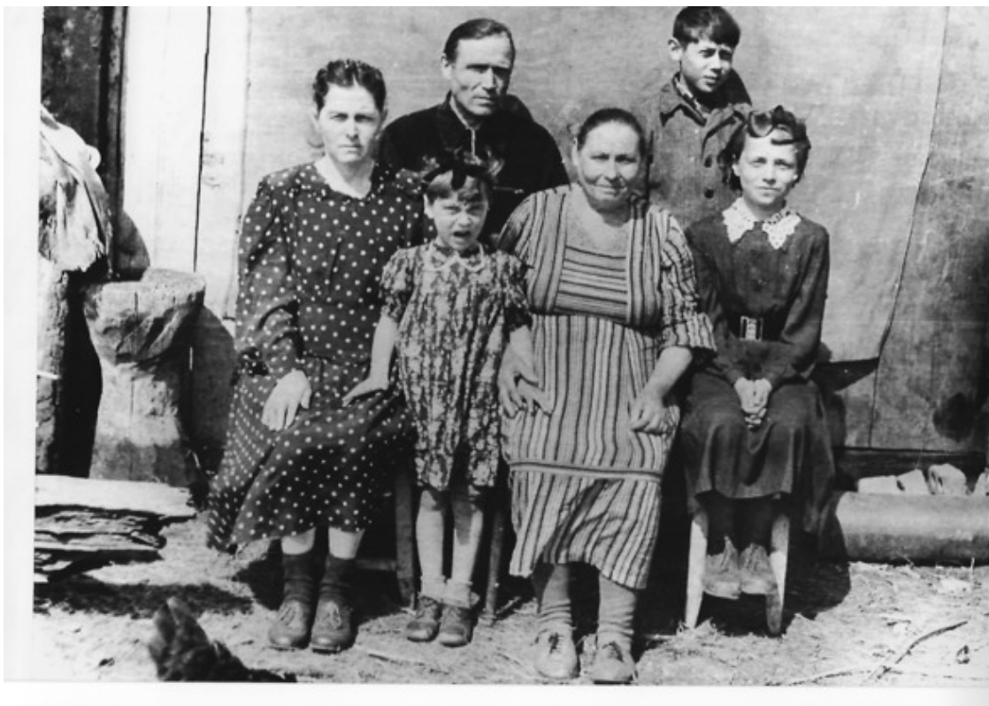
Моя семья. Село Красильниково. 1956 год.