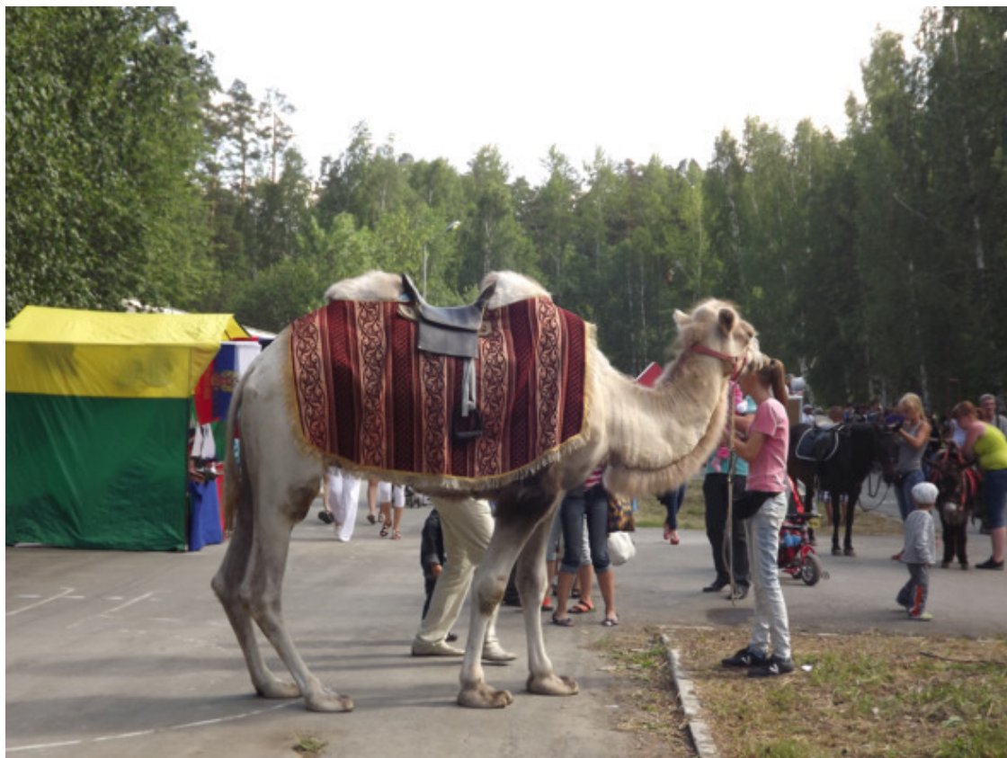
г. Асбест. день Строителя. 2016 год.

Нам было от 10 до 14 лет, и мы уже хорошо научились кататься на лошадях, крепко на них сидеть и управлять ими. Мы уже знали всех лошадей по кличке, их характер и повадки. А они такие все разные, что к каждой нужен свой подход.