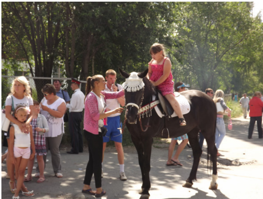
г. Асбест. День Строителей. 2013 год.