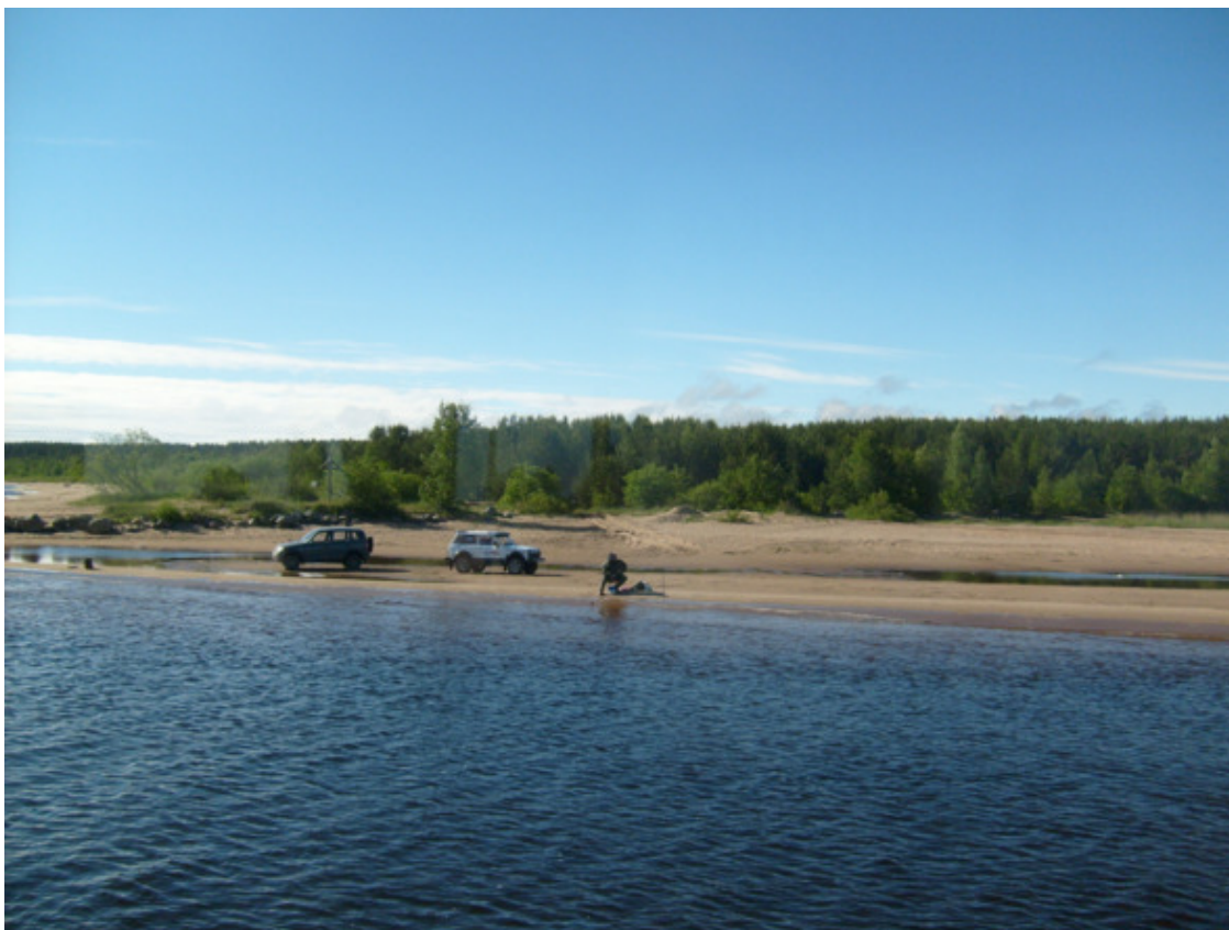
Ладожское озеро. 2015 год.

Для совместной жизни несовместимо. Тем не менее, троих детей вырастили. Отец нас не трогал и в пьяном состоянии. Но был строгим, мы его боялись.