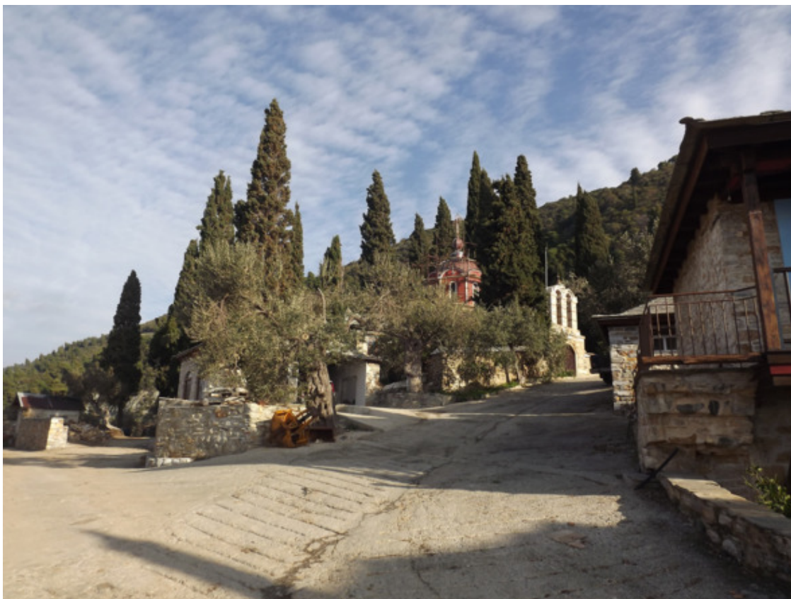
Греция. Святой Афон. 2013 год.

После половодья на лугах рос дикий лук, его называли скородой. Мы уходили в луга, брали с собой хлеб, соль и ели его с диким луком. Это было так вкусно.