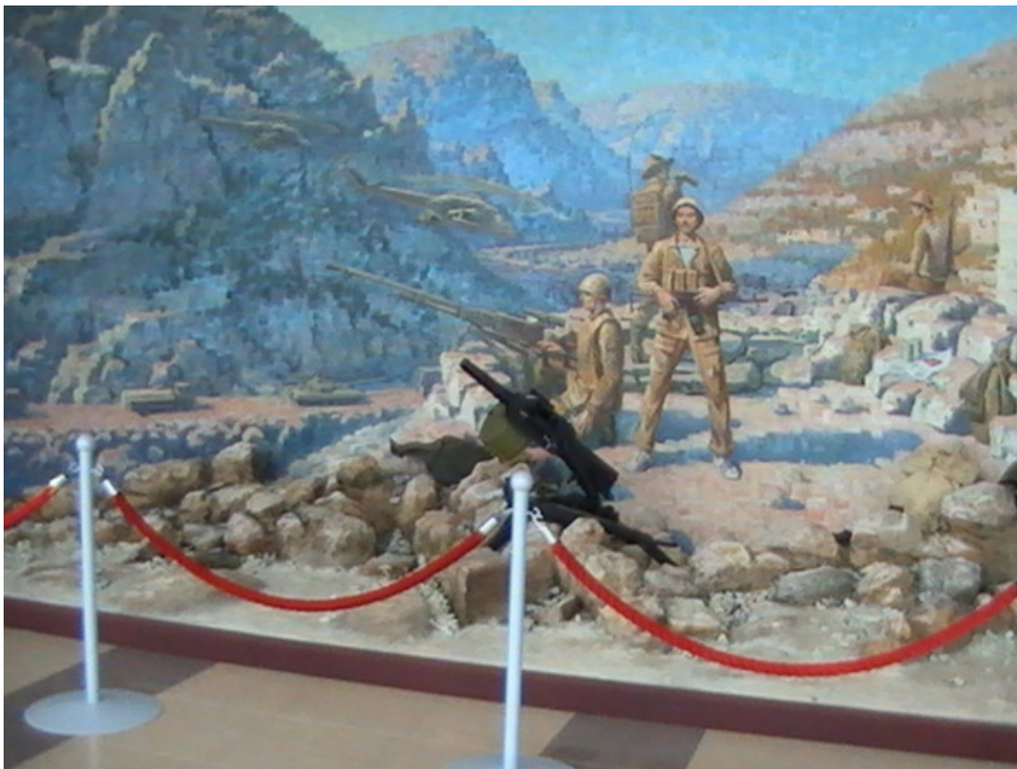
г. В – Пышма. Военный Музей. Панорама обороны Севастополя. 2015 год.

Запомнился мне Уралмаш, людьми в военной форме без погон, выцветшие гимнастёрки и галифе. Много на улице встречалось инвалидов без ноги или руки, а то и без ног или рук, которые в основном попрошайничали.