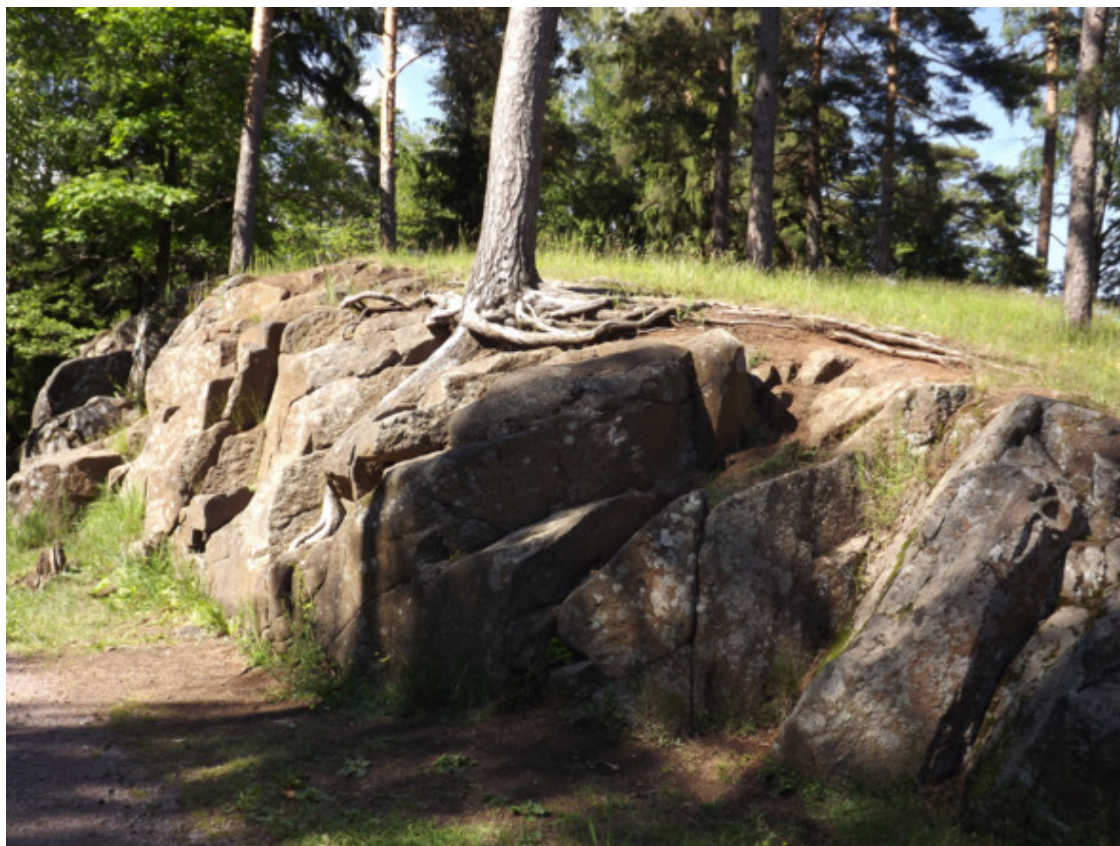
Остров Валаам. 2014 год.

Климат здесь не такой уж суровый. Относительно мягкая зима, а лето очень короткое, но я хорошо помню, что мы всё лето купались. Вероятно, сказывалось тёплое течение из Атлантического Океана, которое заходило к Кольскому полуострову (течение Гольфстрим). В середине лета день практически не заканчивался, ночью было, как днём. Зимой наступала длинная ночь. Днём было светло 3 – 4 часа, не больше.