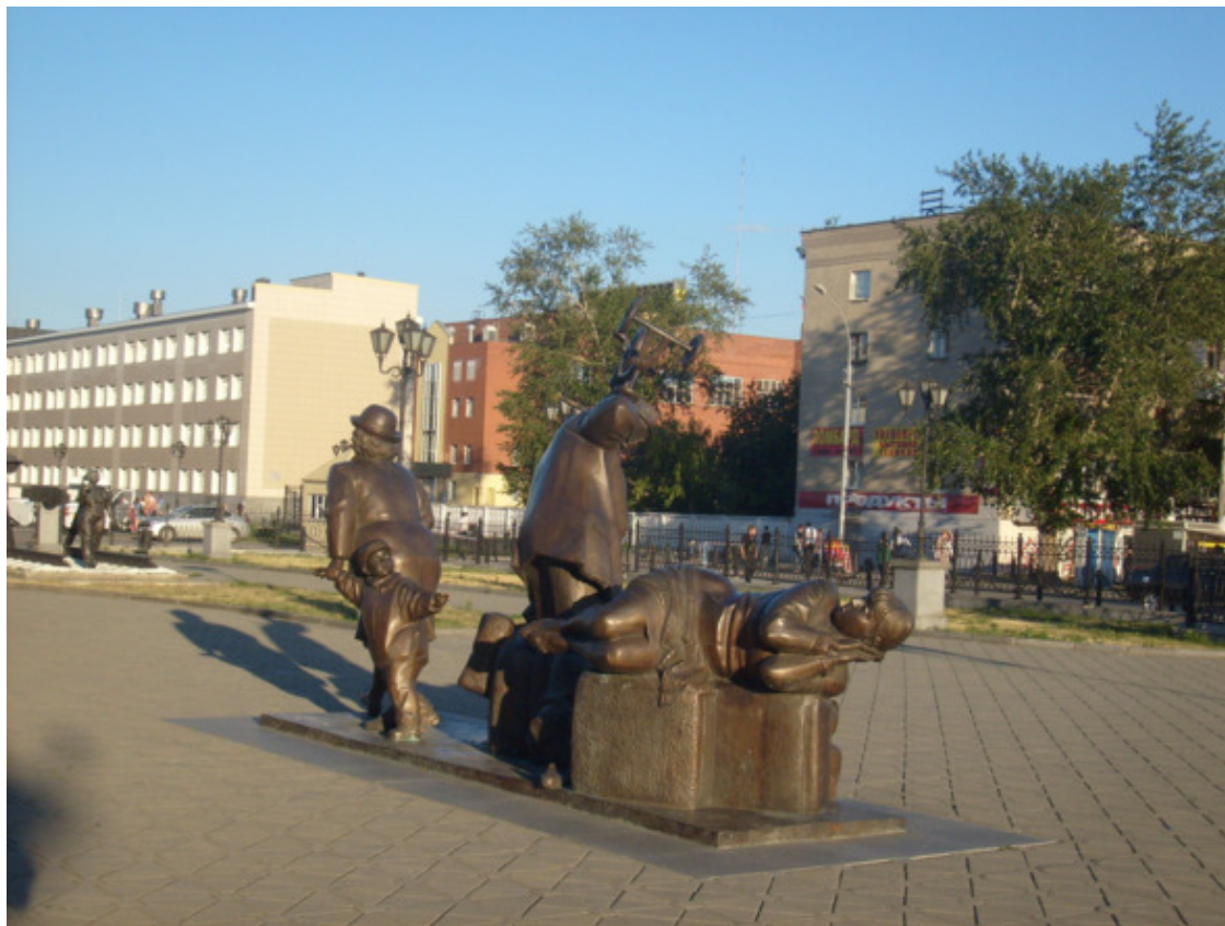
г. Екатеринбург. Привокзальная площадь. 2014 год.

Пока мы были маленькими, играли на улице с деревенскими ребятами, далеко не уходя от дома. Когда стали по старше, сестра Вера играла с девочками, а я с ребятами. Чем старше, тем игры становились серьёзнее и опаснее. Обычно играли также в войну, футбол и русскую лапту. Занимались борьбой, ходили купаться на речку и лазали в чужой сад за яблоками и грушами, хотя у каждого дома росло от десяти до двадцати сортов яблок. Вот так то.