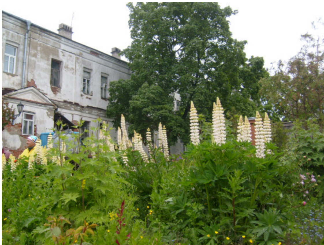
Остров Валаам. 2014 год.