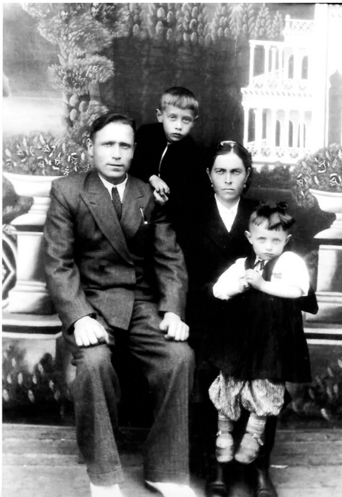
Моя семья. г. Молотовск. 1951 год.

Родился я в г. Свердловске 3 апреля 1945 году. Получается, что я ещё и войну захватил и в тоже время Год Рождения был победоносным в войне с Германией.