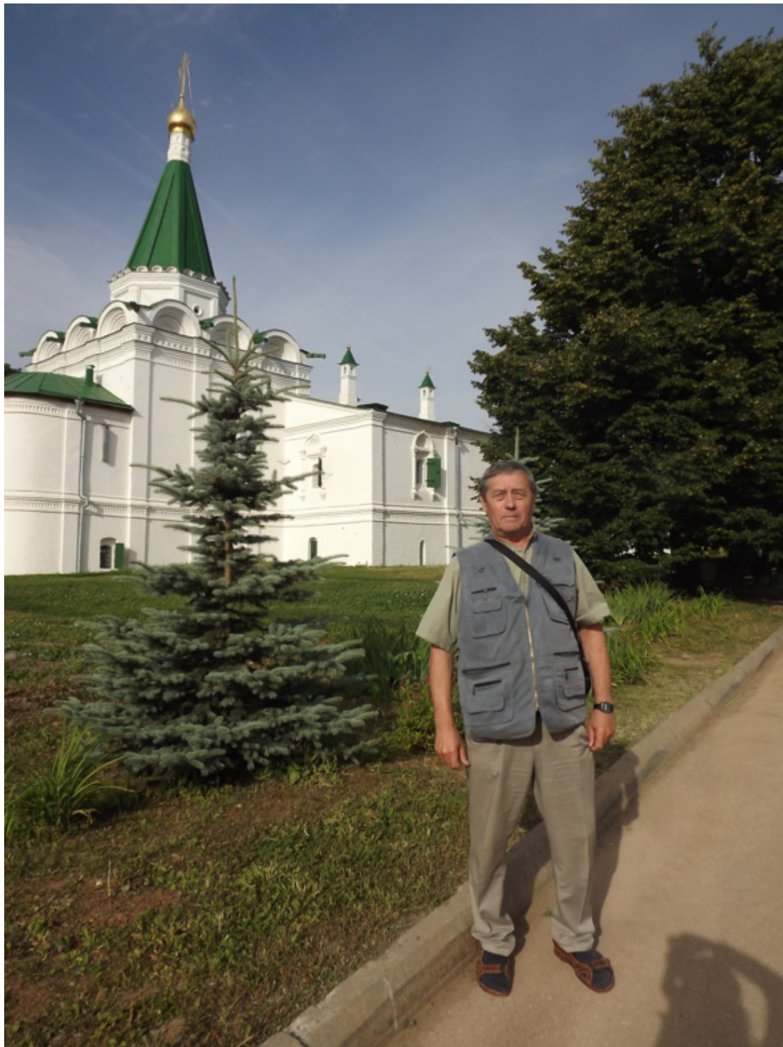
Паломническая поездка по «Золотому Кольцу». 2012 год.

точно. Две коровы, бычок, овец около 15 голов, стая гусей, куры и свиньи, а это о чём – то говорит. Огромный сад и приусадебный участок до 40 соток. Так же один член семьи числился в колхозе, а остальные работали в домашнем хозяйстве, сажали огурцы и возили продавать в г. Москву. Собирали они до 20 мешков огурцов, позже возили продавать яблоки, а это были не малые деньги.