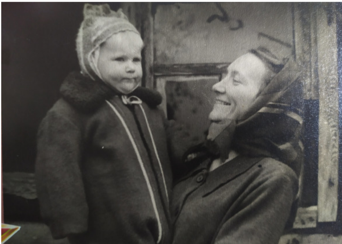
Мы с мамой в Селищах, 1956 год

Мама... так много хочется рассказать о ней, и не только на основе детских воспоминаний, а гораздо больше – как представляется мне мама и ее жизнь сейчас, когда я сама давно уже бабушка. В детстве мы многое не замечаем, а с годами начинаем видеть и понимать больше и глубже.