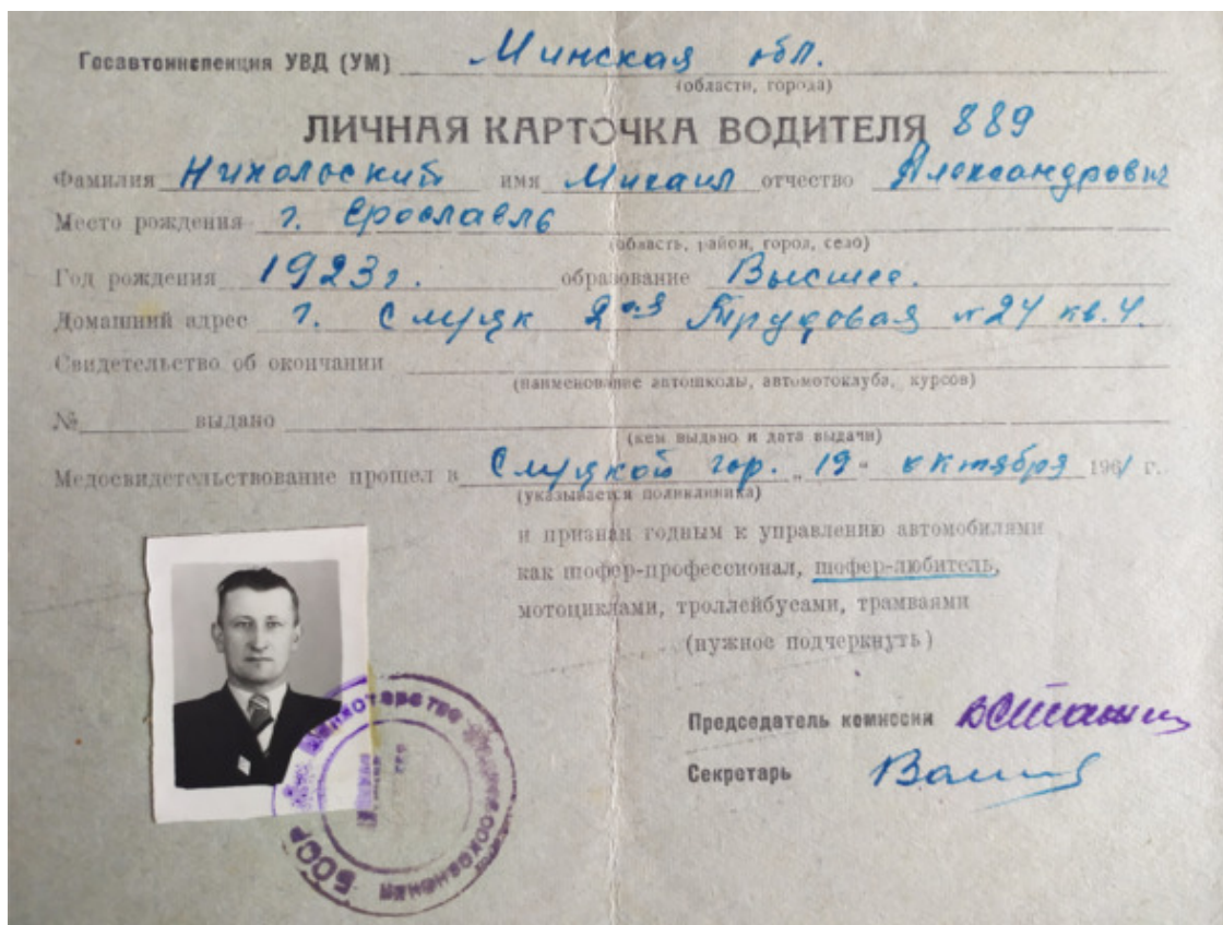
Папино водительское удостоверение

ные сессии ездил (учился заочно), то по району «колесил» как зав. отделом культуры. В моей памяти с тех лет сохранился образ: высокий красавец... подтянутый, легкий, подвижный, веселый... пышные волосы зачесаны назад и точно посреди лба – круглая, выпуклая отметина (не знаю, что это было, потом она исчезла сама). Папа носил брюки-галифе, которые заправлялись в сапоги. Зимой у него были белые бурки с коричневыми полосками и каракулевая черная шапка-ушанка. Ездил папа на «Газике», сам за рулем. Когда собирался опять уезжать, мы обычно просили прокатиться с ним до околицы. Это была такая радость для нас!