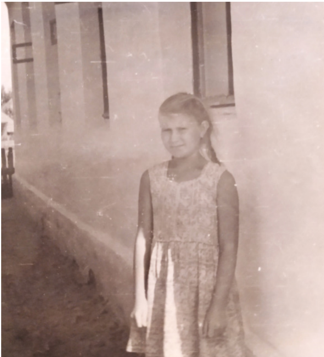
«Мама сшила мне новое ситцевое платьице – простенькое, без рукавчиков».

Про колготки в 50-60-е годы никто еще не знал. Я носила хлопчатобумажные чулки, и чтобы они не сползали, мама шила мне-дошкольнице «лифчики» – типа толика до пояса с застежкой на пуговицы на спине. По низу «лифчика» пришивались 4 широкие резинки: две спереди и две сзади. Снизу резинок прикреплялись специальные зажимы, за которые цепляли чулки. Зажимы постоянно отстегивались, чулки сползали... это было мучение. В школьном возрасте «лифчиков» у меня не было, чулки держались прямо на ноге широкими резинками, сшитыми кольцом.