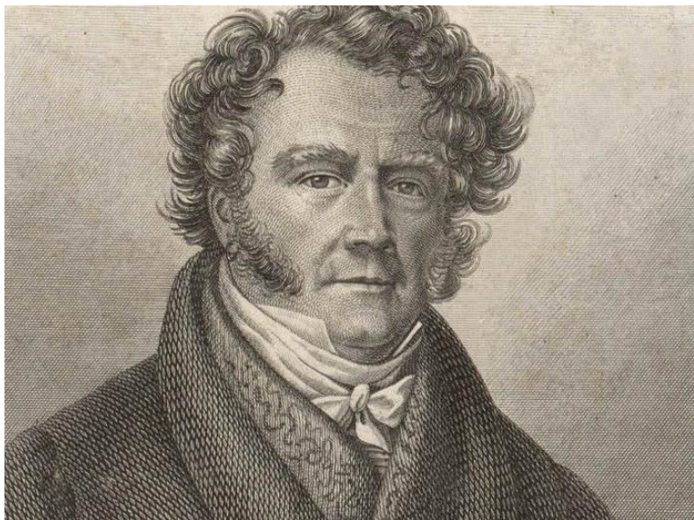
Рис. 4. Эжен-Франсуа Видок. Портрет из издания его мемуаров 1829 года

Однако вскоре преступный мир узнал, что Видок и его агенты служат в полиции. И ему пришлось придумывать другие способы раскрытия преступлений. Уголовные полиции по всему миру пользуются ими до сих пор: