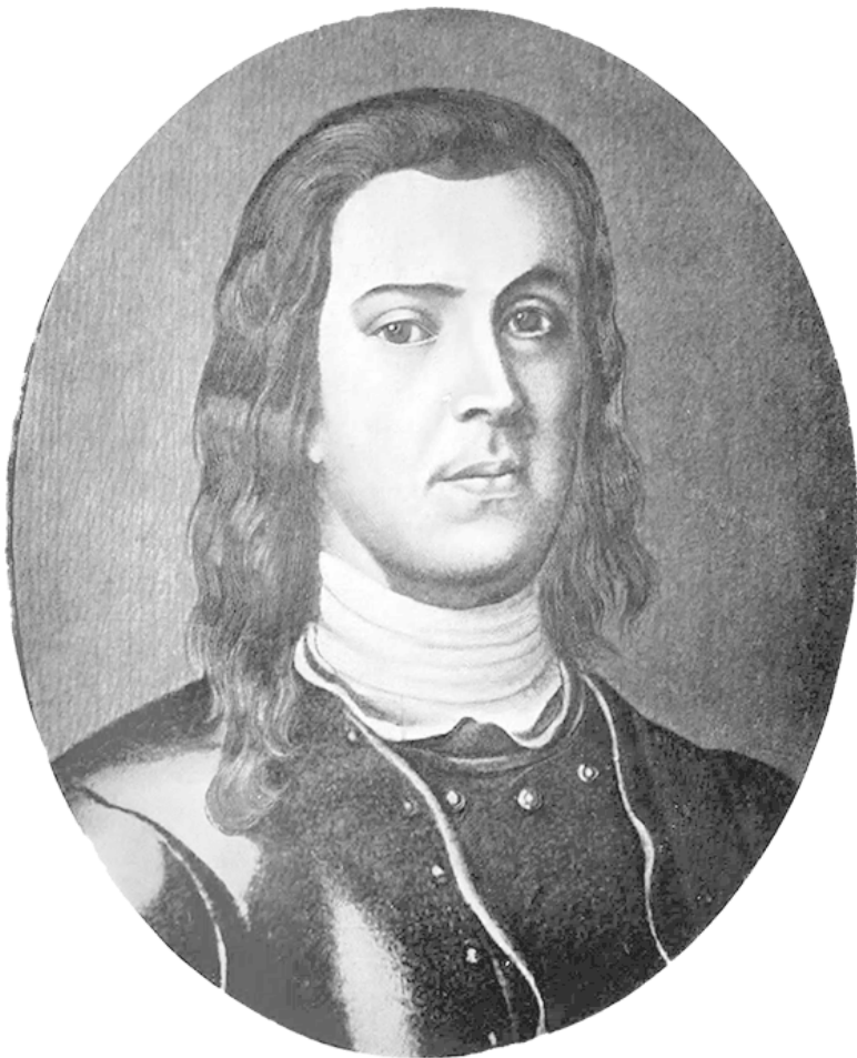
Рис. 1. Первый генерал-полицмейстер Санкт-Петербурга А.М. Дивьер