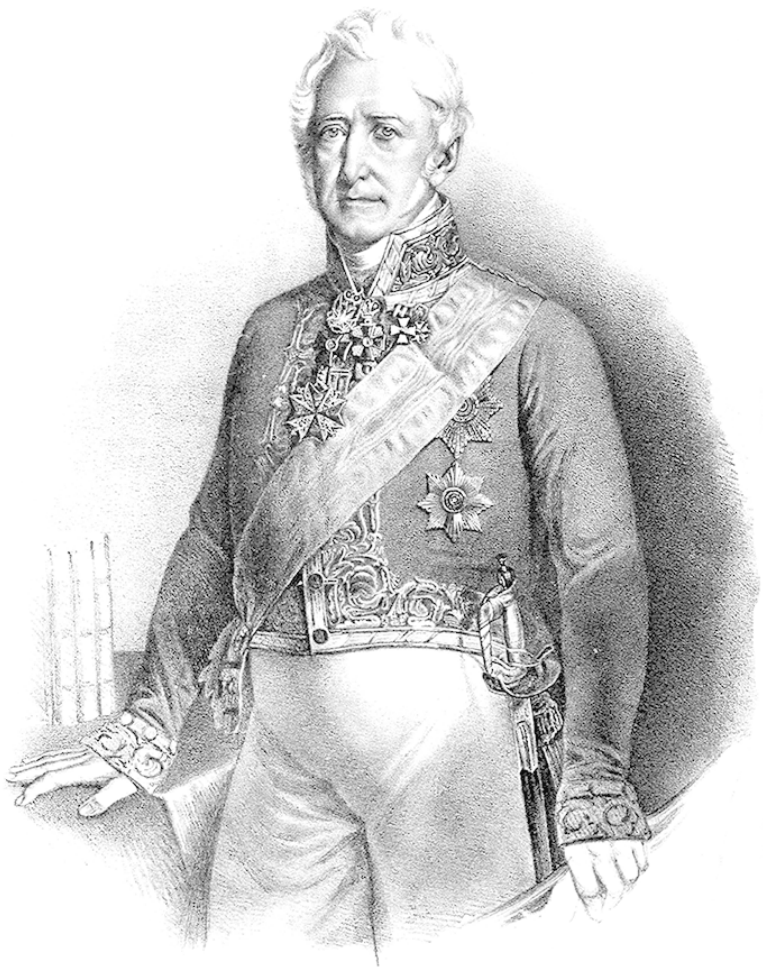
Рис. 6. Обер-полицмейстер Санкт-Петербурга И.С. Горголи