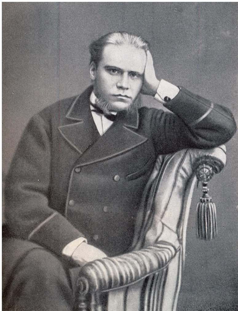
Рис. 12. Анатолий Федорович Кони, фотография 70-