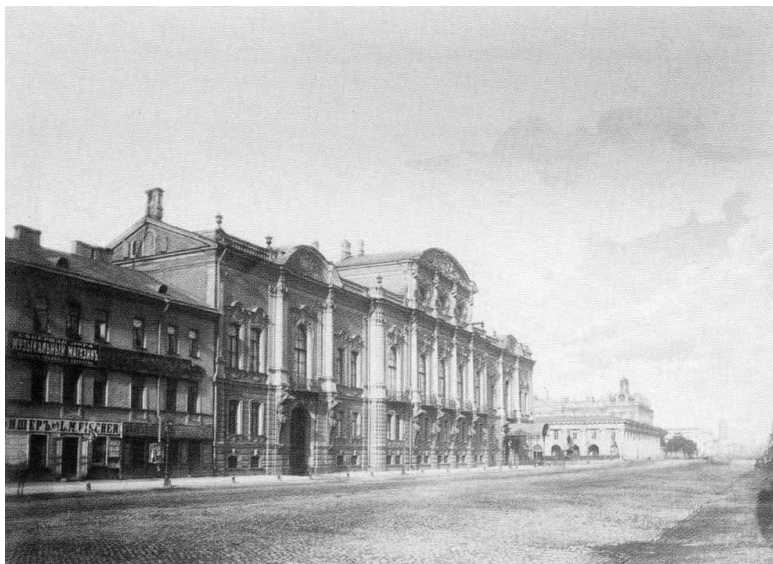
Рис. 11. Дом Дидло (крайний слева), фотография XIX века