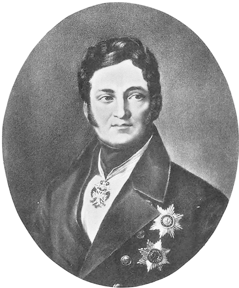
Рис. 8. Лев Алексеевич Перовский

В сентябре 1841 года министром внутренних дел Россий-