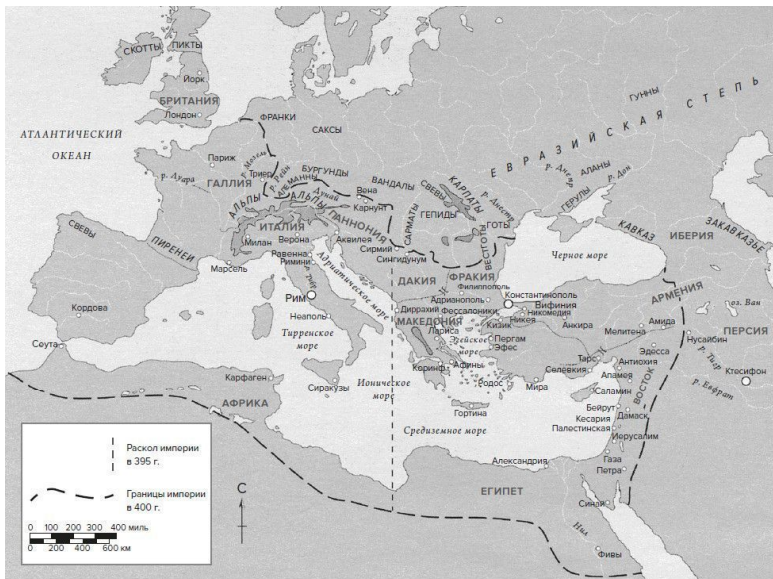
Карта 1. Византийская империя около 400 г.