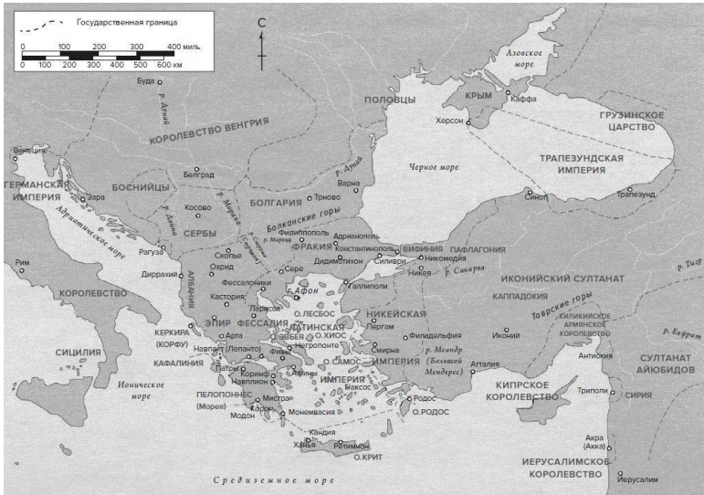
Карта 4. Византийский мир после 1204 г.