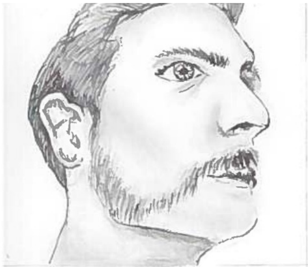
1. Суворовская борода

1. Суворовская борода (фр. A La Souvarov) – начинается от висков и спускается вниз, окаймляя скулы, к уголкам рта, а затем изгибается снова вверх, плавно переходя в усы. Подбородок при этом остается чистым.