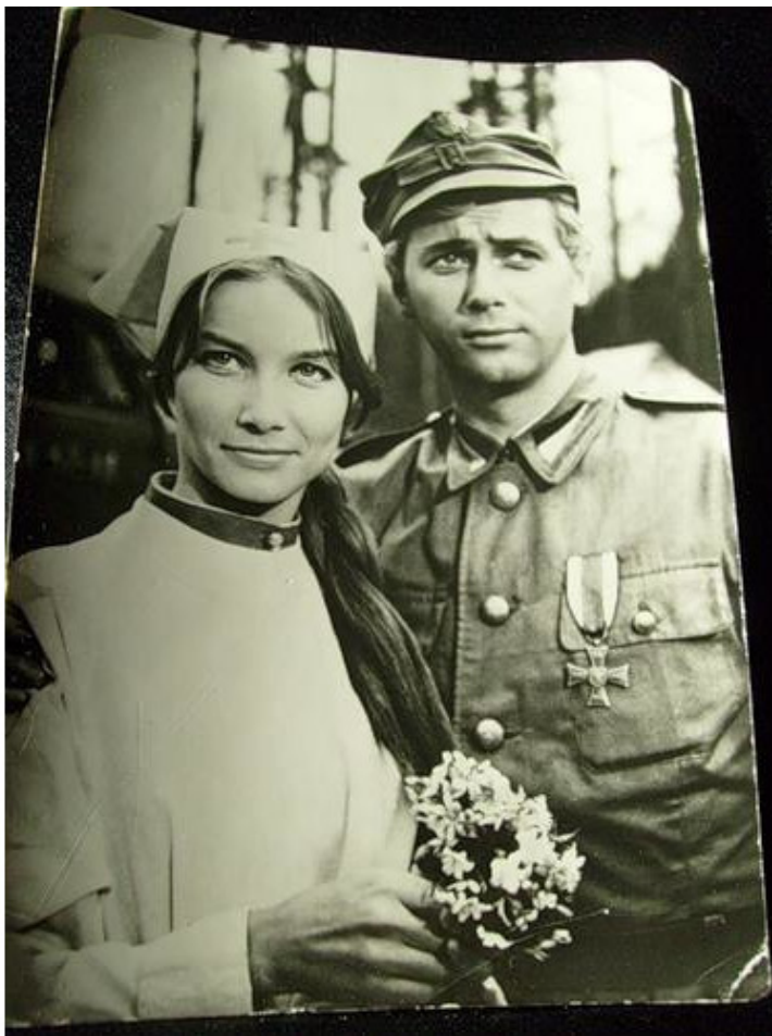
На фото – герои «Четырёх танкистов...» – Янек и Маруся Огонёк.

Изауры». Ага, как же! «Четыре танкиста и собака» – вот это, я понимаю, сериал всех времён и народов... СССР и соцлагеря! Неотразимый Янек, жгучий грузин Георгий, любимый всеми пес Шарик, Маруся Огонёк! Не помню, каким чудом я обрела подругу по переписке из Польши, она прислала мне фотографию Янека и Маруси, и я тут же стала объектом зависти всех моих одноклассниц. Мы все распевали «Вин штерей панцерни, Руды и наш пес!» – кажется, так звучали слова начальной песни.