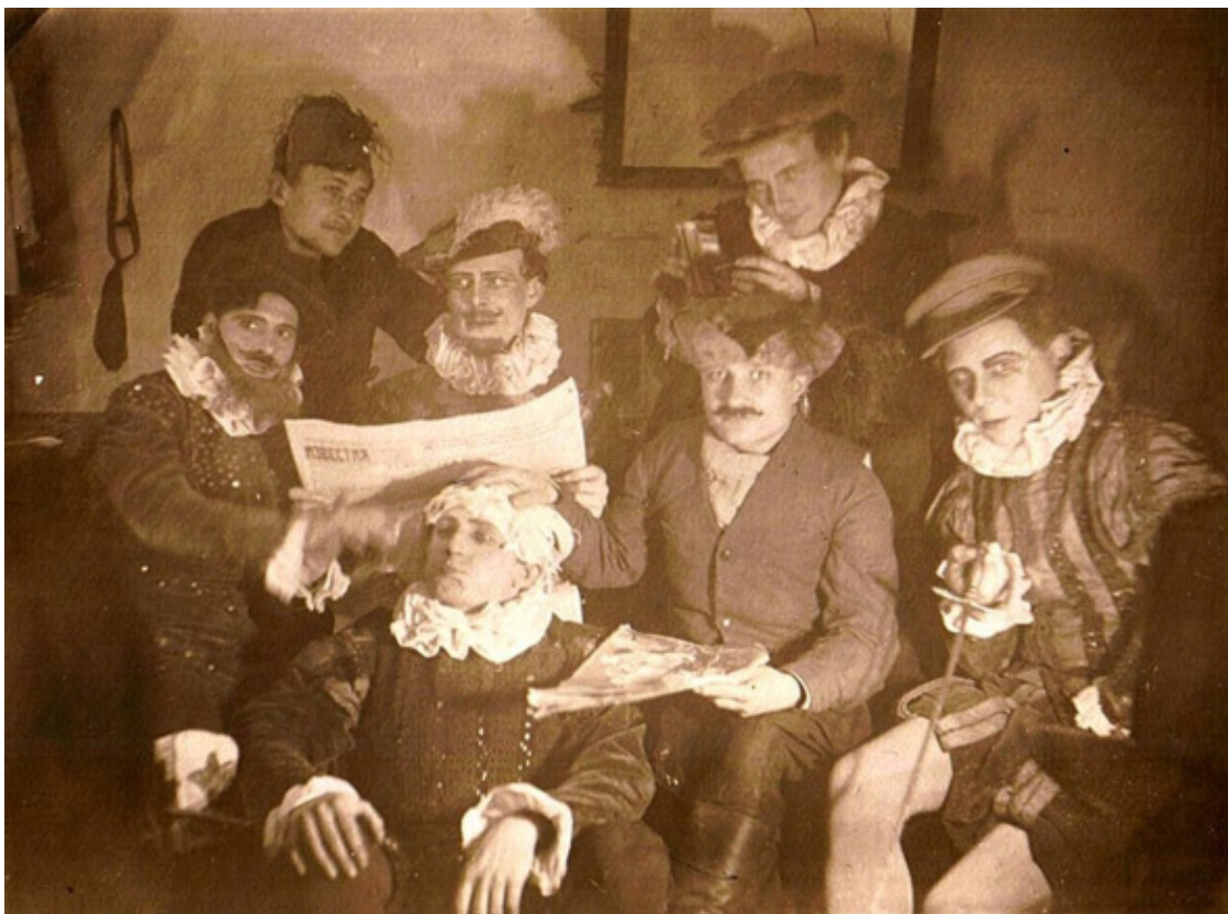
На фотографии папа – крайний справа.