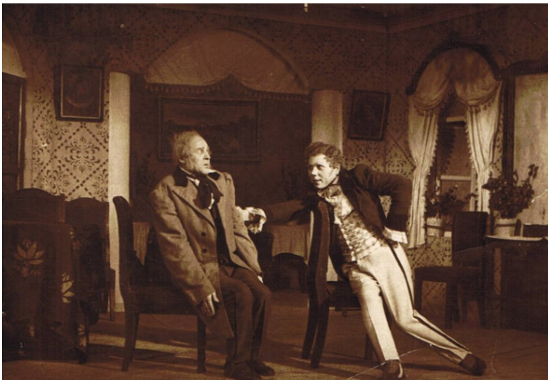
Папа тут – справа. В той самой «фрачной» позе...

Вот его Хлестаков, сидит он изящно, как положено сидеть, когда откинута полы фрака.