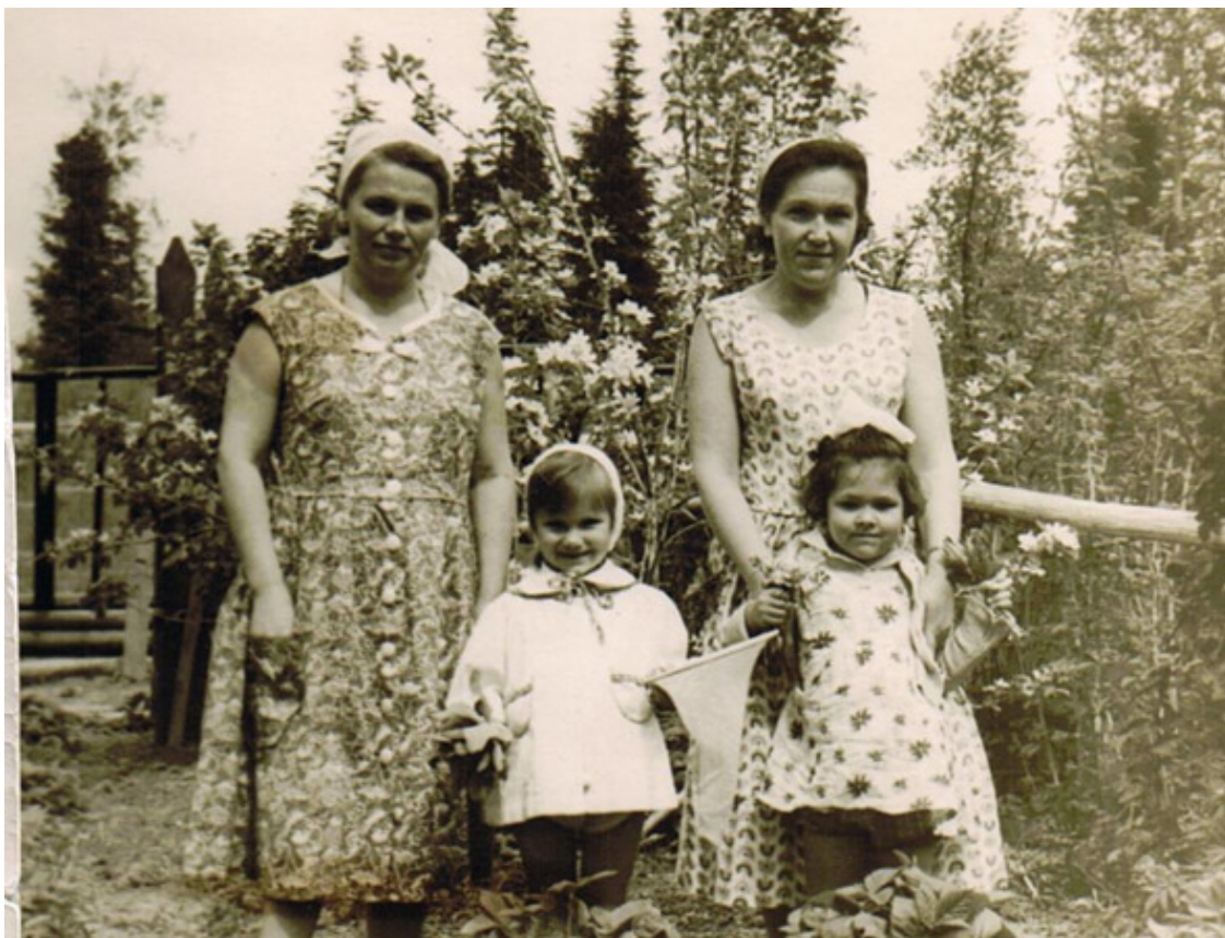
На второй фотографии мы с мамой слева