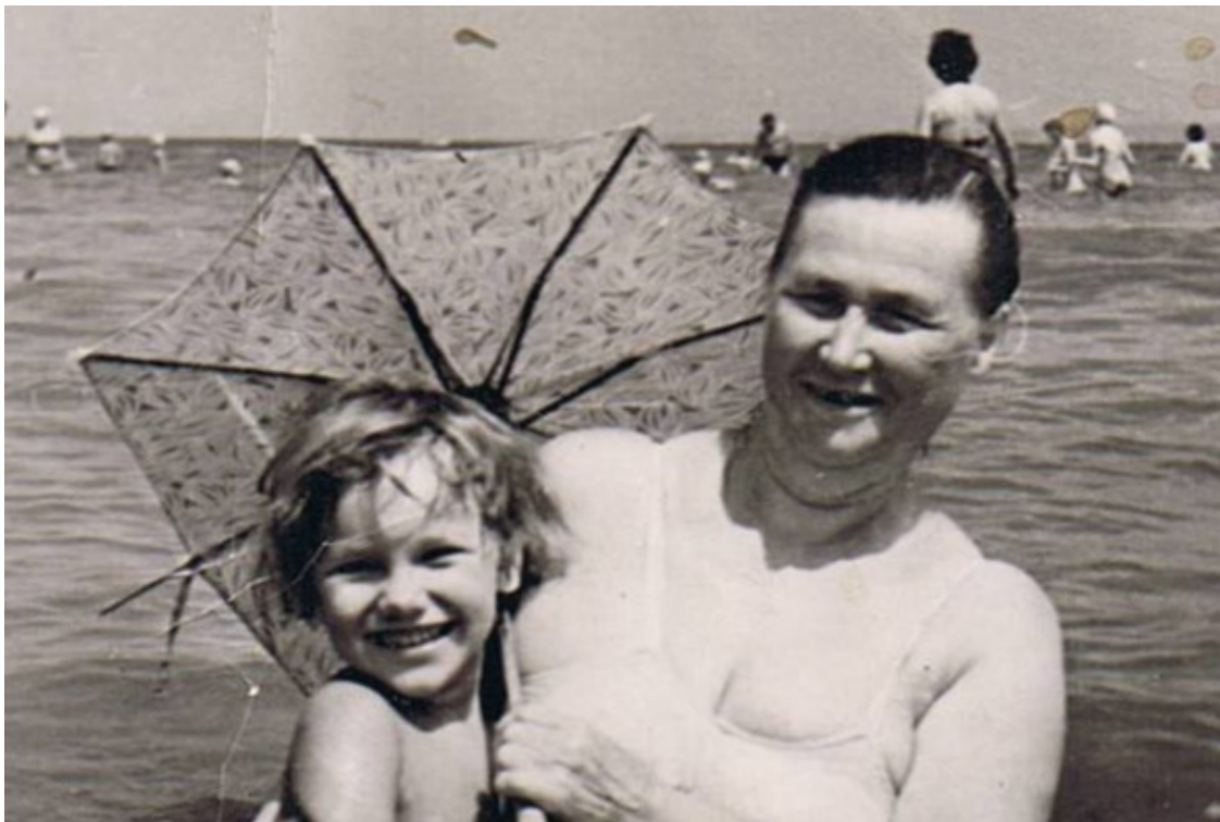
На фотографии – мы с бабушкой в Анапе.