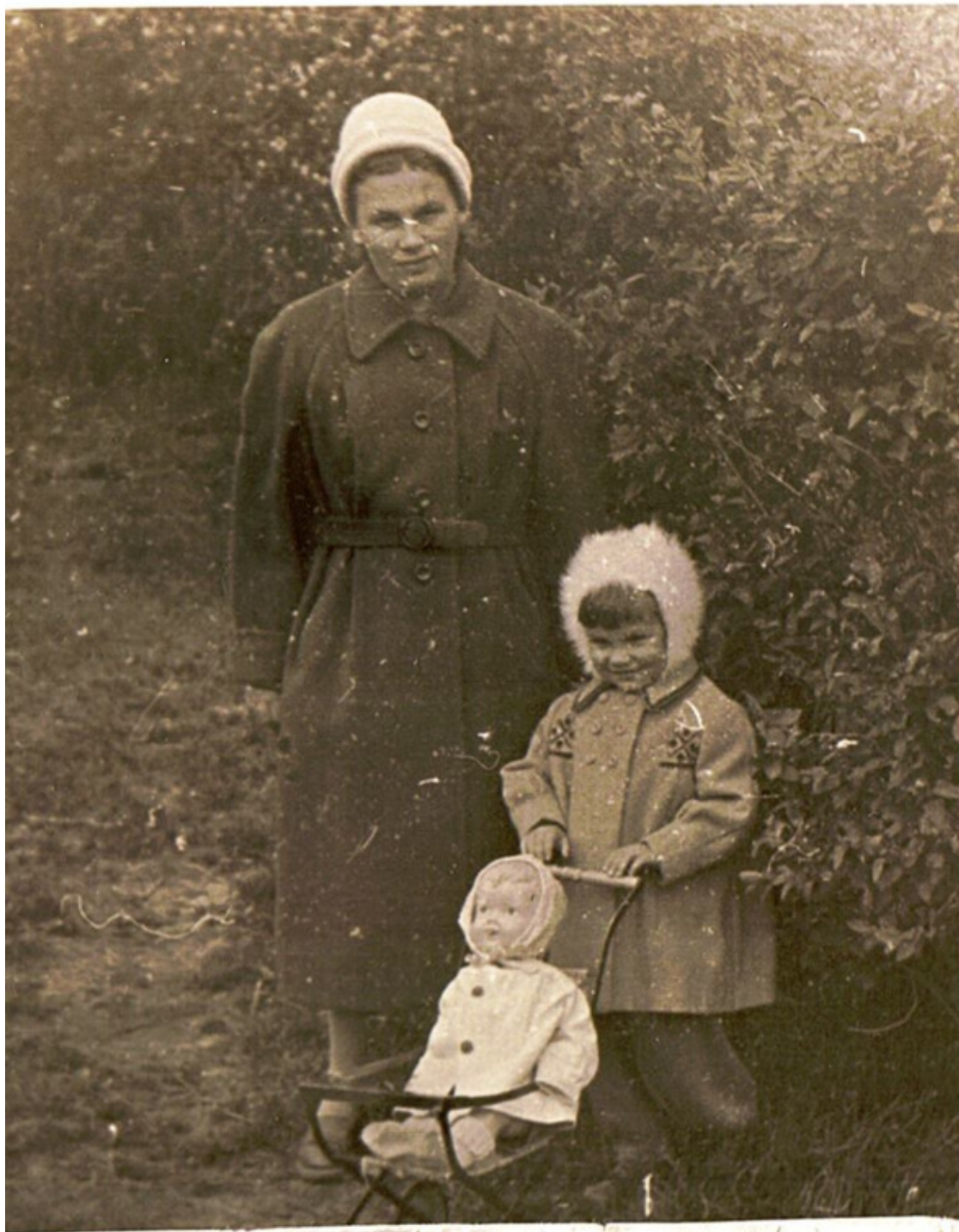
На фотографии – мы с мамой, модные и нарядные, на прогулке.

узнать сроки изготовления вожаденной еды. Я прибежала на кухню с дежурным вопросом: «Баба, скоро?» – и получала классический неизменный ответ: «Я туда не сяду!». Удовлетворённая, я возвращалась, отвечала, что бабушка в пирог ни за что не сядет, родители кивали, но минут через 10 отправляли меня опять. Наконец, раздавался бабушкин крик: «Идите уже!» – и мы неслись в кухню. Вот он – розовато-румяный, блестящий от масла, дышащий невероятным ароматом томленной рыбы, лука, сливочного масла ПИР-Р-РОГ-Г-Г!