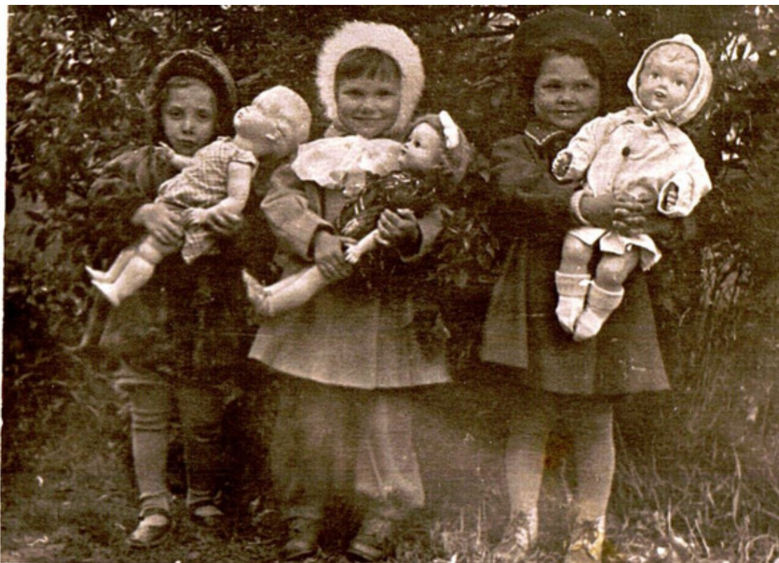
на третьем – я в центре