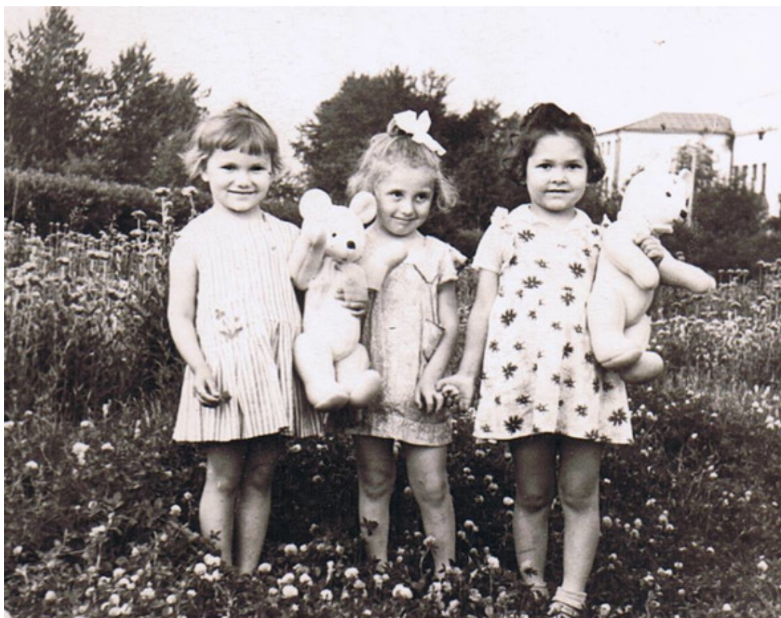
На второй – в этом возрасте ходить по «лысам» – счастье!