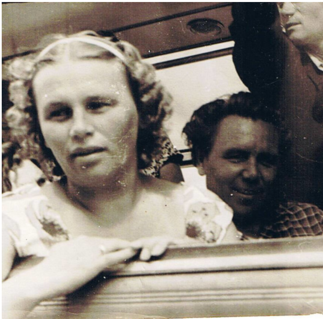
На фотографии – мама и папа, куда-то ехать собрались. Папа весёлый, мама волнуется – похоже, ребёнка оставляют на бабушку.