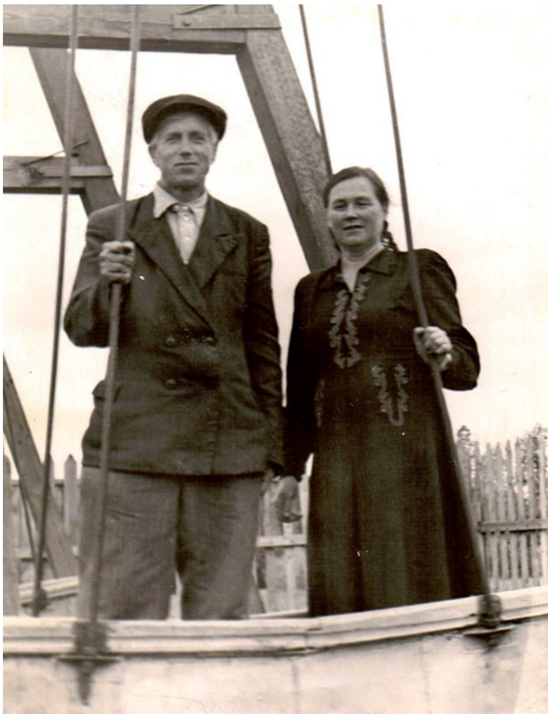
А здесь обращаем внимание на бабушкино платье. А? Вот...