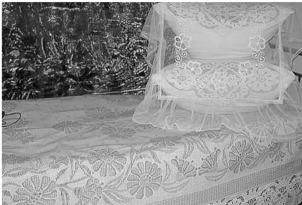
На первой фотографии – примерно так выглядела постель после непосильных трудов.