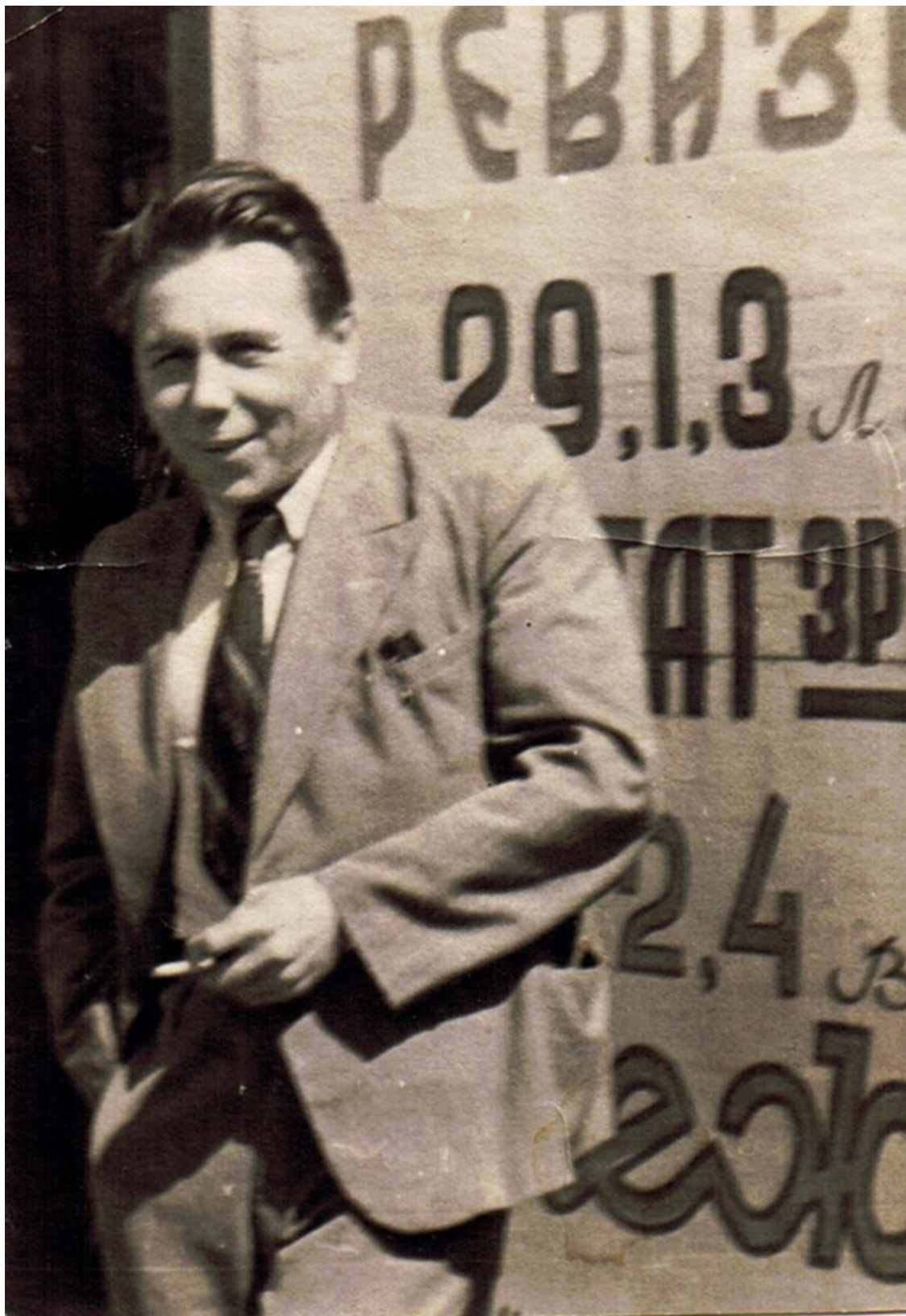
На второй фотографии – «он».

Тесто бабушка ставила сама, оно получалось нежным, способным вобрать в себя все рыбно-масляные соки. Осаживать опару бабушка вставала по два раза за ночь. Начинка готовилась так. Обычно малосольная (!) горбуша вымачивалась ночь в чайной заварке – так удалялась лишняя соль и оставалась нужная. Нижний слой пирога выкладывался луком, горбу-