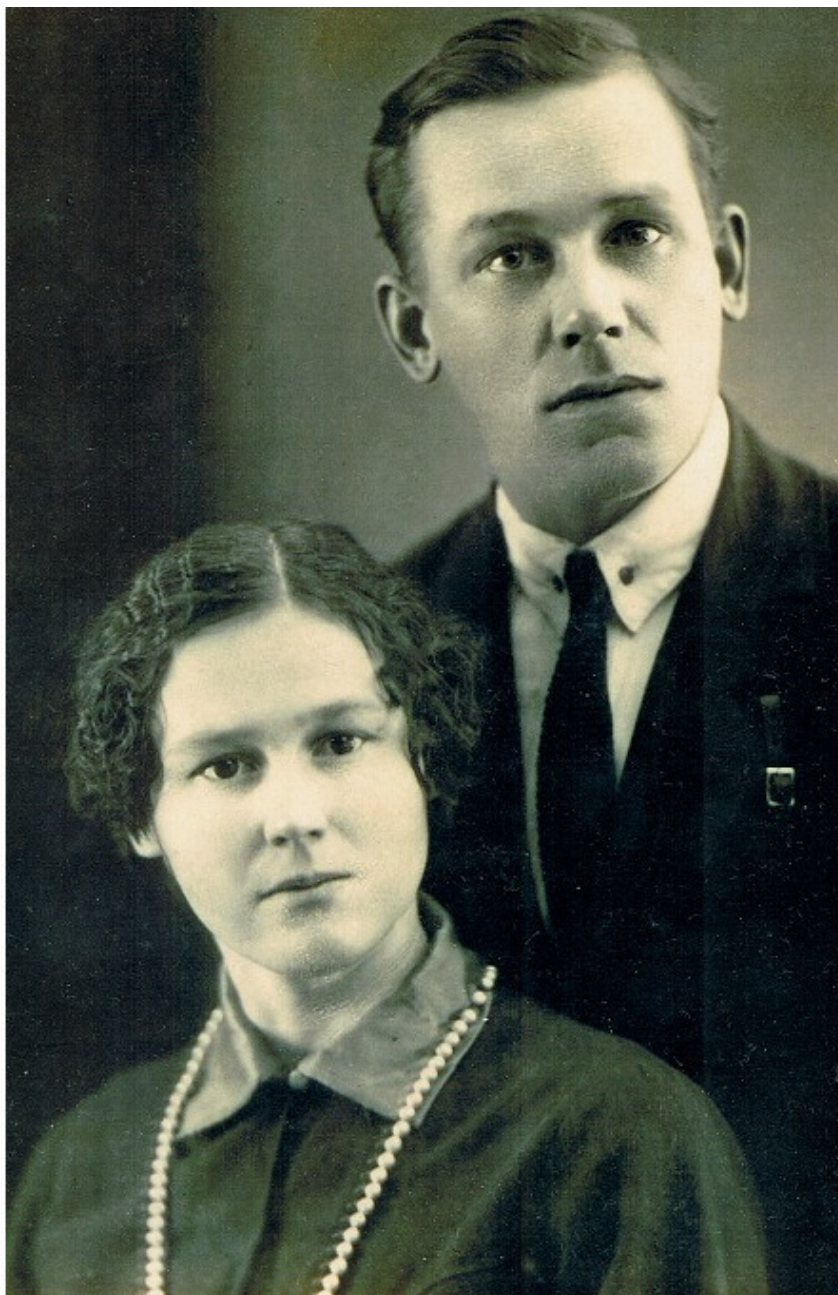
Бабушка и дедушка. Фото предвоенных лет.