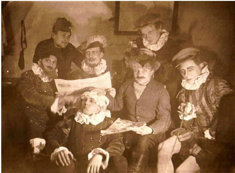
На фотографии папа – крайний справа.