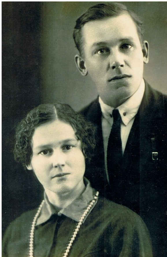
Бабушка и дедушка. Фото предвоенных лет.