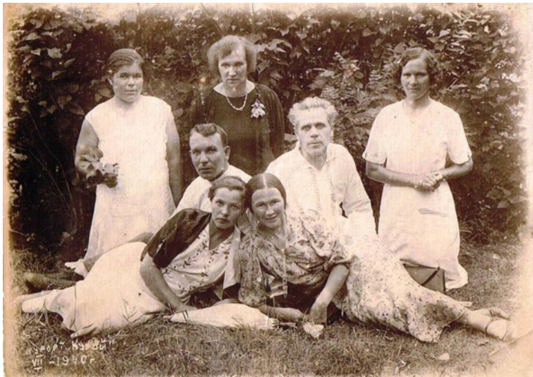
На фото – бабушка полулежит справа.