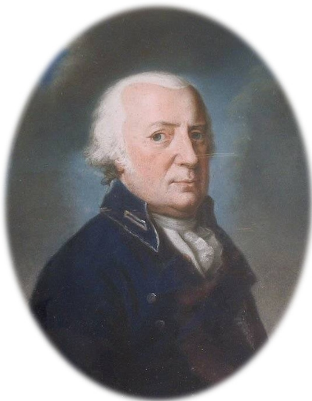
Карл Вильгельм Брауншвейгский

Но всё пошло не так, как рассчитывали «пламенные революционеры» Один из отрядов французской армии численностью 4000 человек наступал через границу из Лилля, когда неожиданно путь ему преградил гораздо менее многочисленный австрийский гарнизон города Турне. Не было сделано ни одного выстрела, не дошло дело и до штыкового боя. Мгновенно охваченные паникой, французы с криками бросились назад, пока не добежали обратно до Лилля. Там поход закончился мятежом, во время которого был убит командир корпуса и несколько старших офицеров. В тот же день французская дивизия под командованием Бирона числом 10 000 встретила с небольшим отрядом австрийских стрелков, который проводил рекогносцировку на местности. Противники едва успели обменяться выстрелами. Достаточно было нескольких точных выстрелов австрийцев по боевым порядкам французов, как два полка французских драгун бросились удирать с криками: «Нас предали!» Их примеру сразу же последовали и остальные французские солдаты. Подобные случаи панического бегства, почти