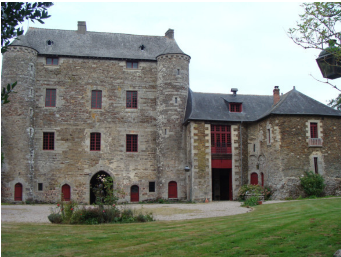
замок Монтбань-де-Бретань, в котором родился Анри

Сразу отмечу, что во французской википедии, как и в блоге «Наполеон и революция» (что, похоже, черпал сведения оттуда), указана дата рождения 4 октября 1776 года!