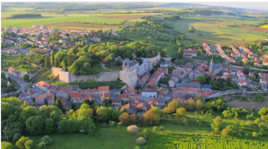
Тионвиль или Тьонвиль сегодня