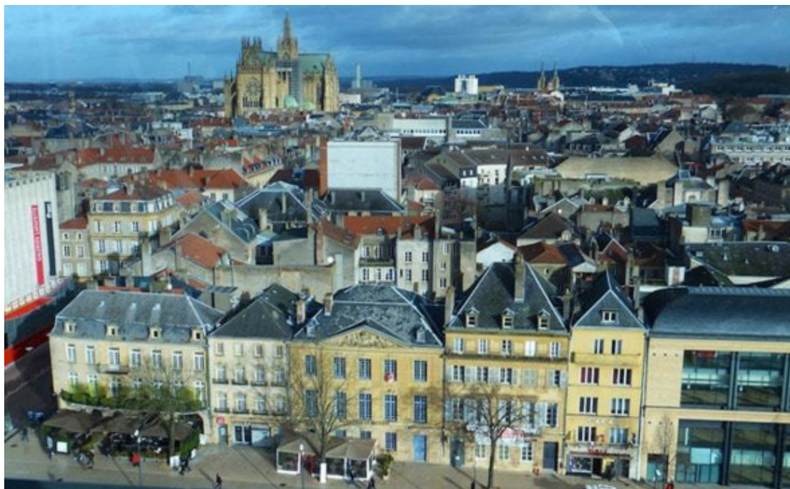
город Мец или в старом написании Метц Лотарингия