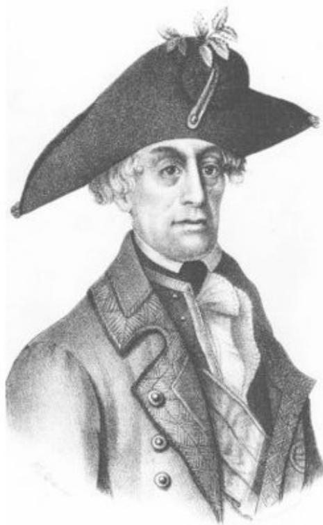
Иоганн Петер Больё