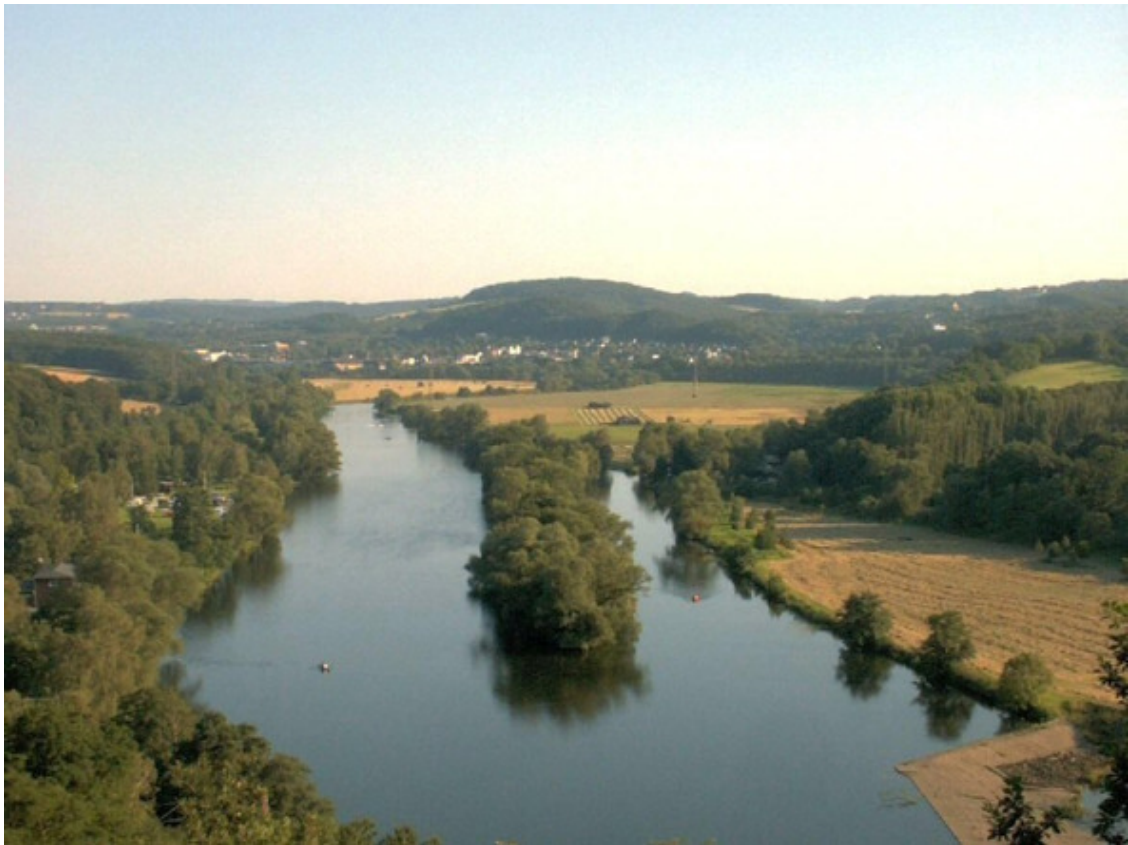
река Рур приток Рейна

Жан-Поль де Больё в 1793 году прикрывал левый фланг Нидерландской армии и разбил Дюмурье, следуя за отступающей французской революционной армией занял Намюр.