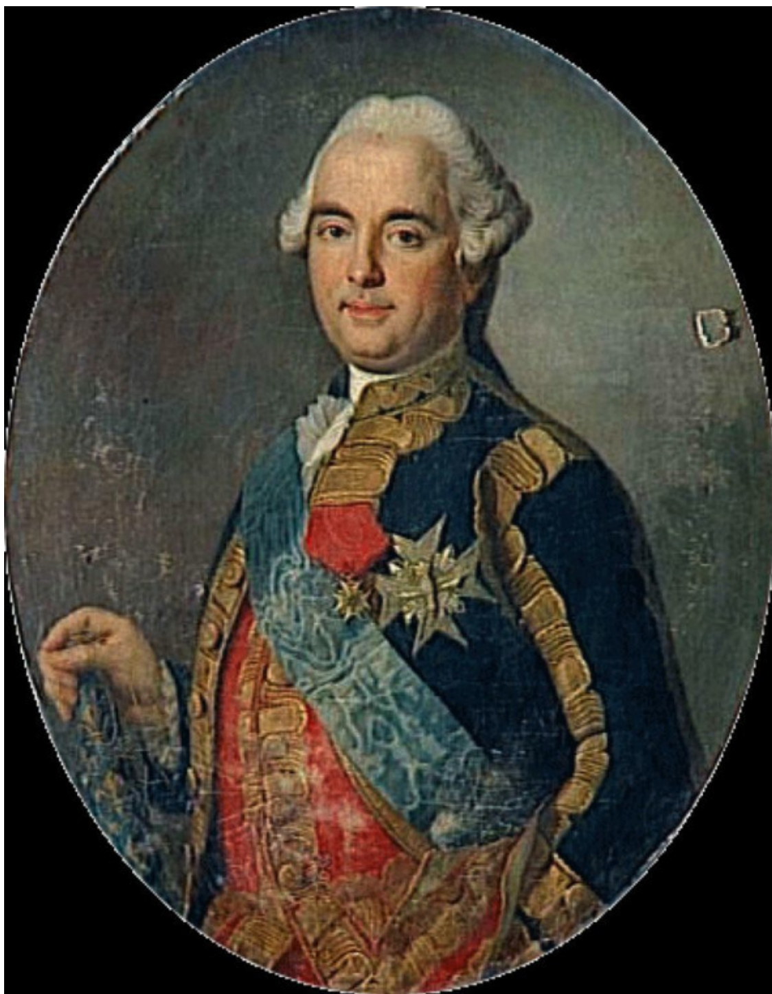
Виктор-Франсуа де Броли

1 сентября 1791 года, покидает Родину и наш герой, в кармане у него сто экю данные отцом, вместе с морским офицером, бретонцем шевалье де Ла Монре он поступает в пехотный корпус сформированный из жителей Бретани, расположенный в Виллихе (земля Северный Рейн-Вестфалия), что входил в «Армию братьев Короля», состоящую из 15 000 человек под командованием герцога Виктора-Франсуа де Броли, героя семилетней войны, бывшего маршала Франции. Герцогу идет семьдесят четвертый год, но он по-прежнему полон сил. Кстати, в 1796 году герцог поступит в русскую службу и получит от Павла I, 26 октября 1797 года, чин генерала-фельдмаршала Российской Армии, откуда, выйдет в отставку по состоянию здоровья в 1799 году (всё-таки 81 год, это 81 год).