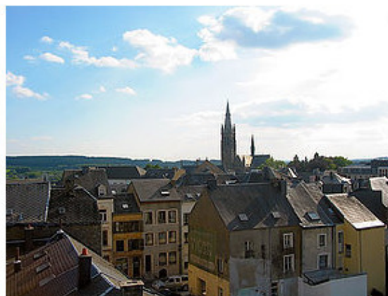
город Арлон Бельгия

18 апреля австрийцы были вынуждены отступить, но 29 апреля де Больё, вновь захватил Арлон, выбив оттуда французов и захватив 6 орудий. Было еще сражение 21 мая, когда Журдан с 45 000 естественно выбил австрийцев с Арлона.