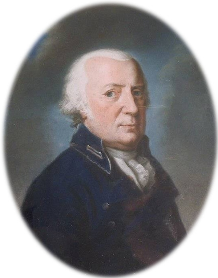
Карл Вильгельм Брауншвейгский

Но всё пошло не так, как рассчитывали «пламенные рево-