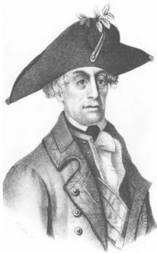
Иоганн Петер Больё