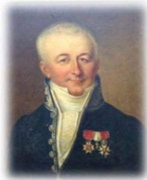
Анри дю Буашамон

1796 года, он продолжил службу в рядах республиканской армии, но в Италии, не Бретани, выйдя в отставку в 1802 году.