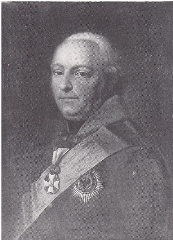
князь Фридрих Людвиг Гогенлоэ-Ингельфинген

Пуля сразила в голову начальника отряда, шевалье де Ла Баронне, что стоял рядом с Анри, когда они вместе шли