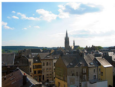
город Арлон Бельгия

18 апреля австрийцы были вынуждены отступить, но 29 апреля де Болье, вновь захватил Арлон, выбив оттуда французов и захватив 6 орудий. Было еще сражение 21 мая, когда Журдан с 45 000 естественно выбил австрийцев с Арлона.