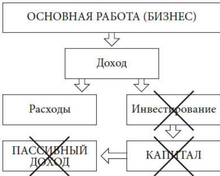
Схема 2. Денежные потоки финансово неграмотного человека

Но у некоторых из нас на расходы уходит весь полученный доход. И из схемы ниже вы можете увидеть, что произойдет далее, если вы по-прежнему будете тратить все, что зарабатываете. Нет инвестиций – нет капитала – нет пассивного дохода. Вас ждет непростая жизнь на государственную пенсию.