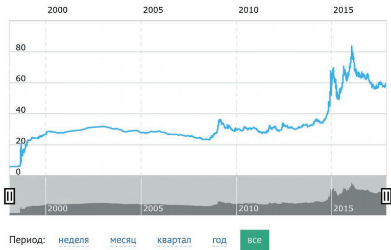
График 1.1. Курс доллара к рублю

А как он менялся раньше? По-разному. Вот график: