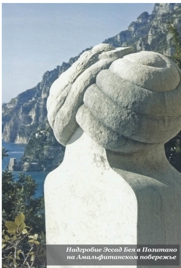
Надгробие Эссад Бей в Позитано на Амальфитанском побережье

Одно из экзотических достопримечательностей великолепного итальянского курорта Позитано – «арабское», как его упорно называли местные жители, надгробие жившего тут и скончавшегося в 1942 г. писателя Эссад Бей. Сам по себе исламский тюрбан над Тирренским морем вызывает любопытство. Еще больше вопросов возникают при знакомстве с судьбой Эссад Бей, одного из самых загадочных европейских литераторов прошлого века. Дискуссии вокруг его имени разгорелись недавно в связи с планетарным успехом книги «Али и Нино», переведенной на полсотни языков и вышедшей миллионными тиражами. Может, преувеличенно, но этот роман называли кавказским «Доктором Живаго».