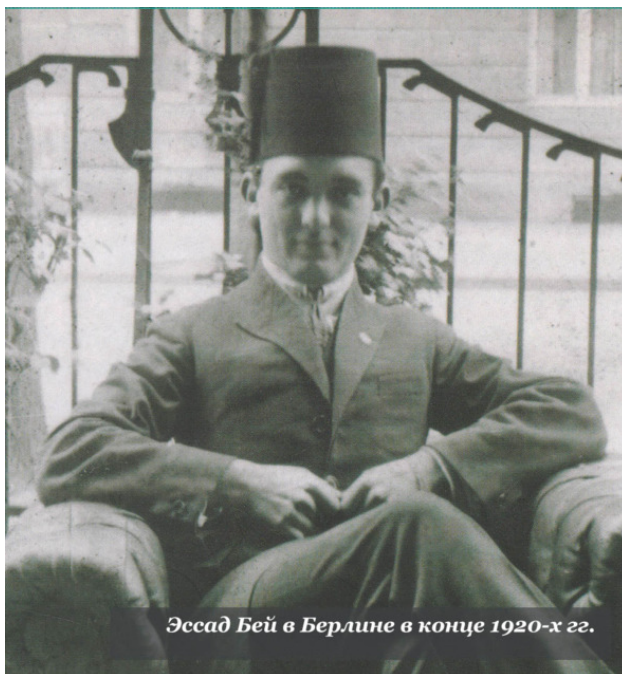
Эссад Бей в Берлине в конце 1920-х гг.

Свою короткую жизнь Эссад Бей провел преимущественно в Берлине, писал на немецком, поэтому именно в Германии в последние годы образовался целый круг исследователей, занимающихся его биографией и творчеством. Существует специальный интернет-сайт ( www.essadbey.de ), где выкладываются документы, сертификаты, письма, полицейские записки и прочее. В том же Берлине возникла музыкальная группа, трио, которая выпустила диск «Who was Essad Bey?». Для оформления диска музыканты использовали фотографию, которую поместил и Том Рейс на обложки своей книги – улыбающийся Эссад Бей, в феске, сидящий в огромном кресле-диване. Ироничное трио остроумно назвало себя «Дезориенталисты» (напомним, что роман Рейса называется «Ориенталист»).