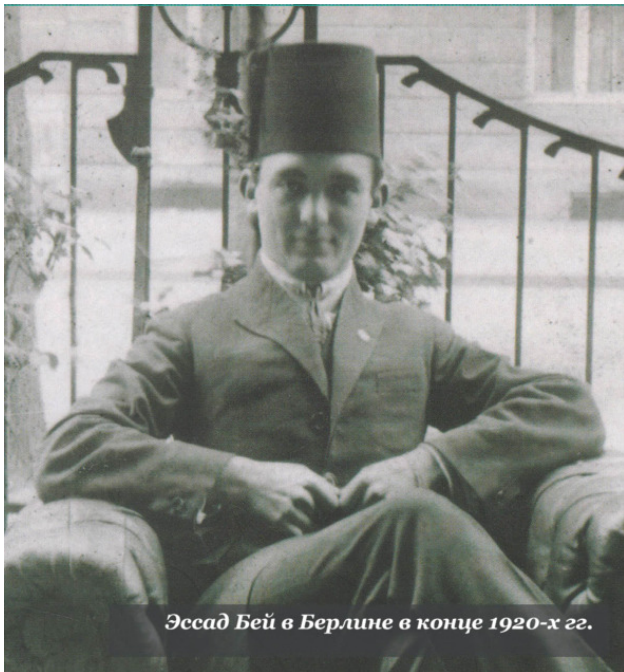
Эссад Бей в Берлине в конце 1920-х гг.

Литератор себя позиционировал в Германии как восточный, преимущественно арабский князь: его благородство шло якобы из Османской империи. Иногда турецкую родину литератор видоизменял на Иран или Грузию. Однако в 2000-е гг. обнаружилось точные данные о его рождении. Лев родился не на Кавказе, как утверждал, а в Киеве (в 1905 г.), и с ним совершили обряд обрезания в местной синагоге – что утверждали его враги еще при жизни писа-