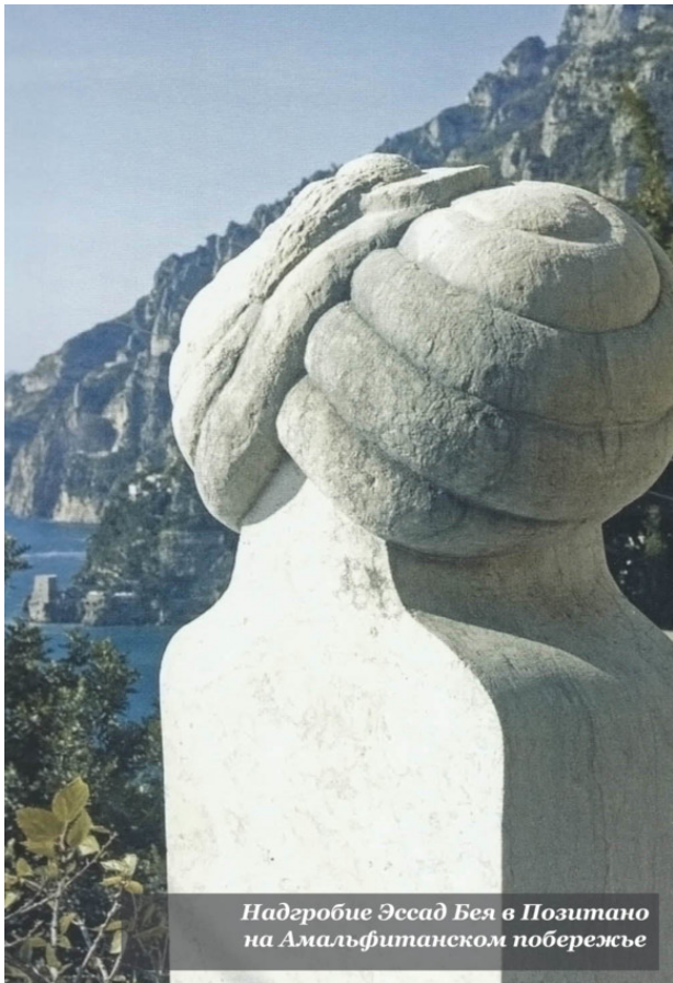
Надгробие Эссад Бей в Позитано на Амальфитанском побережье

Книга опубликована в 1937 г. в Вене на немецком под псевдонимом Курбан Саид, и Эссад Бей, вне сомнения, был к ней причастен. Идут нескончаемые жаркие споры – в какой