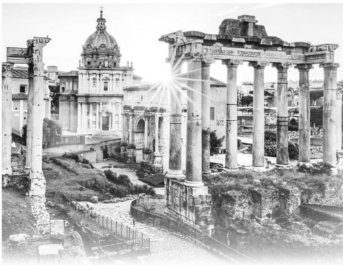
Сохранившаяся часть Древнего Рима

Особое внимание приходится уделять многочисленным кораблям, что приплывают к берегам благословенной Капреи и тем, кто ищет приёма у Цезаря: того и гляди, враги и предатели Рима подoshлют тайных убийц. Так что моя верная супруга Валерия и драгоценный сын Антоний видят меня столь редко, будто я снова в дальних походах.