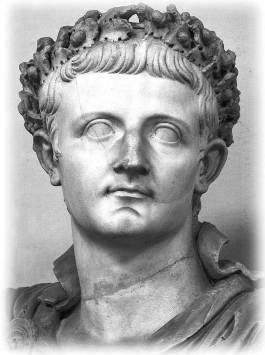
Тиберий Цезарь Август, император Рима

Но только шпионить я не собираюсь, о чём и заявил сходу. А он грустно взглянул и говорит: