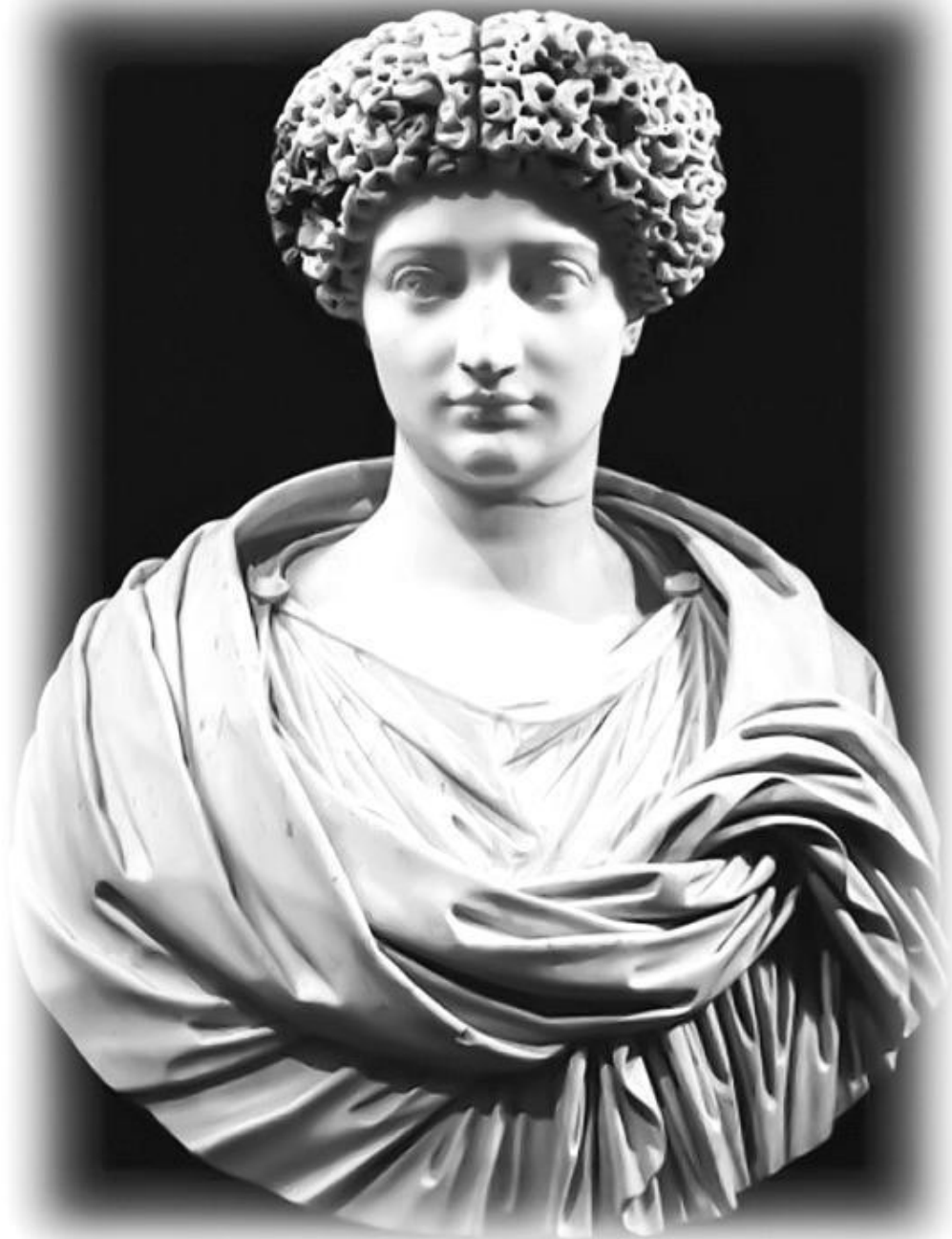
Юлия, дочь Октавиана Августа

Она издевалась над моим другом, унижала его своими ночными похождениями, писала на него доносы и кляузы отцу. Ко всему этому добавлялась скорбь от запрета видеть любимую женщину. В конце концов Тиберий не выдержал и решил уехать в добровольное изгнание на Родос. Он уже тогда руководил всей римской армией, был народным трибуном, но Октавиан не отпускал его, не понимая, как может пасынок и зять добровольно отказаться от огромной власти второго лица в империи и уехать на какой-то остров.