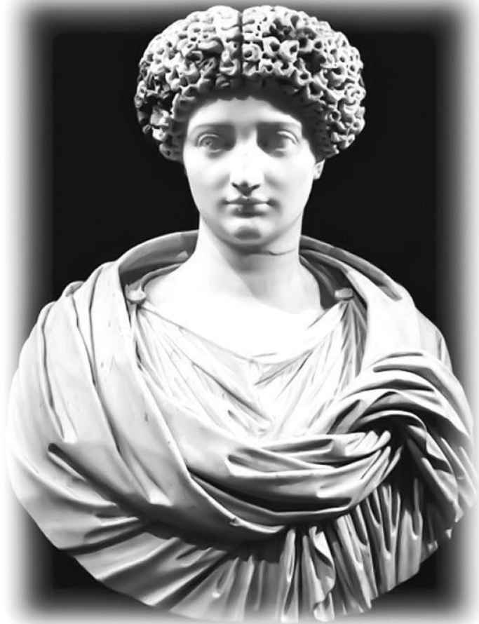
Юлия, дочь Октавиана Августа