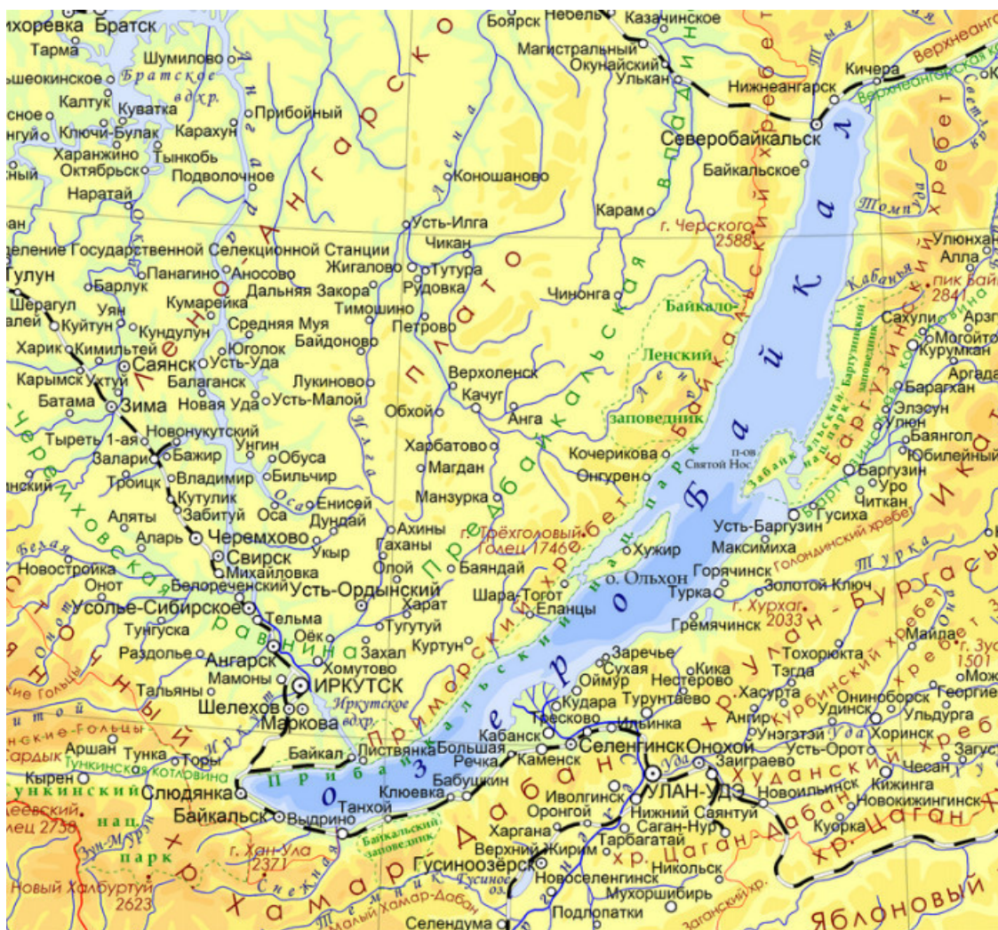
Фото 2. Общая карта Байкала

Во многих районах Байкала магма настолько близко подходит к поверхности земли, что из-под нее вытекают горячие источники. Самые известные – в Хакусах, в районе мыса Котельниковский. Есть и другие.