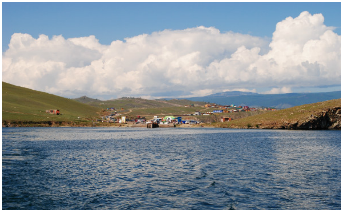
Фото 4. Так выглядит деревня Сахюрта (МРС) с парома

Второй поход начали из деревни Сахюрта – там мы оставили машину. На берегу пролива Ольхонские ворота собрали лодку, полностью загрузили ее и отправились в путь. Нам не нужен был паром – мы были сами себе хозяевами. Поэтому экскурсию начнем из деревни Сахюрта, так будет последовательно и логично.