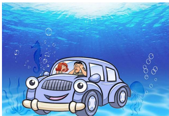
Mr. Hitch, a real estate agent, was drowned out.

Жители города N. стали жертвой цунами. Огромная волна смыла половину города. На место катастрофы тут же слетелись журналисты: застрекотали камеры, защелкали фотоаппараты. Одному фотографу даже удалось сделать подводный снимок, который он разместил в популярном иллюстрированном журнале «Перископ». Правда, некоторые завистники уверяли, что это был фотомонтаж. Может и так, но для нас это неважно. Для нас главное то, что в суматохе со снимками произошла какая-то путаница. Вот эти снимки. Вглядитесь в них и скажите, в чем проблема.