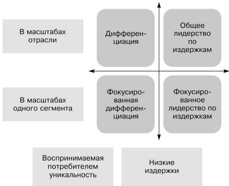
Рис 1. 1. Базовые стратегии на существующих рынках.

Самые низкие цены (лидерство по издержкам) – поддержание цен ниже, чем у конкурентов, за счет сокращения оперативных издержек (затраты на административный аппарат, торговый персонал, торговое оборудование, аренду; особые условия работы с поставщиками и пр). Этой стратегии придерживаются практически все супермаркеты низких цен, направленные на широкие слои населения Например, продуктовые сети «Магнит», «Ашан», «Пятерочка», «Дик-