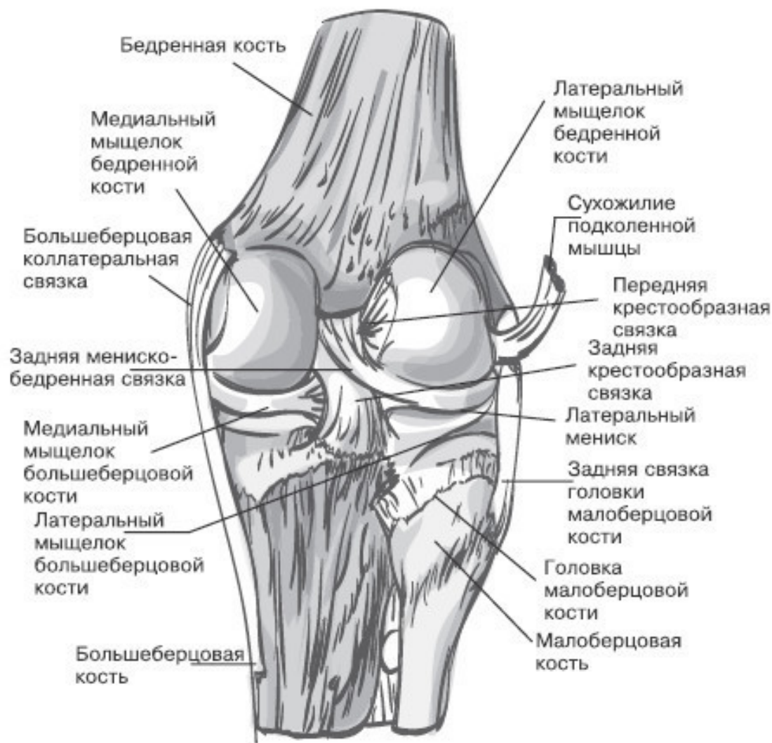
Правый коленный сустав, вид сзади (суставная капсула удалена)

Большеберцовая и бедренная кости имеют различные выступы и углубления. Углубления на большеберцовой кости немного не соответствуют выступам на суставном конце бедра. Это несоответствие в суставе сглаживается межсуставными хрящами и двумя менисками – медиальным и латеральным. Что они собой представляют? По сути, это пластинки из хрящевой ткани. Только вот форма у них весьма необычная – трехгранная. Снаружи мениск сильно уплощен и срастается с капсулой сустава. Внутренний же край, наоборот, заострен и обращен внутрь колена, где остается свободным. Сверху мениски имеют вогнутую форму, а снизу – плоскую.