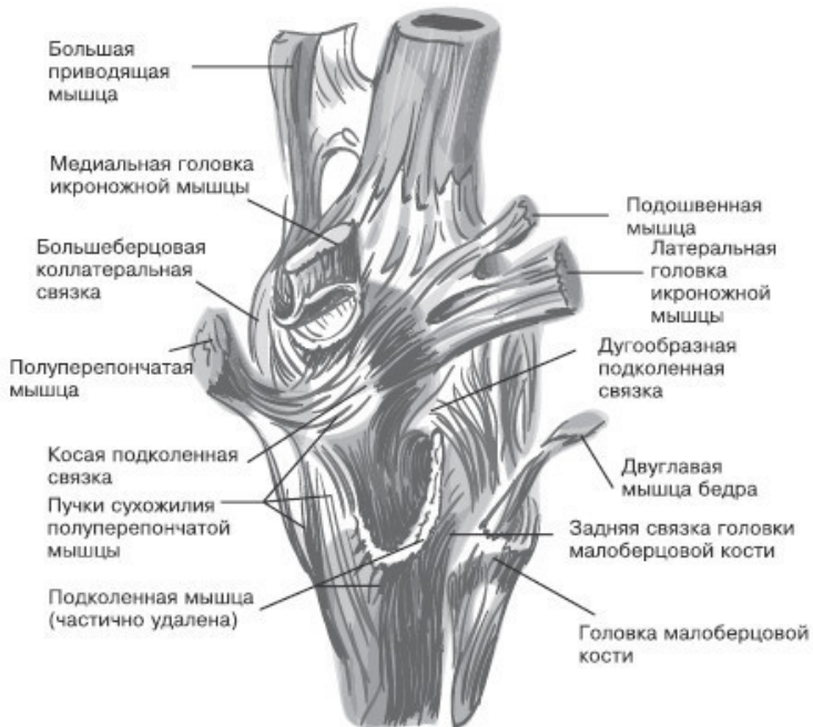
Правый коленный сустав, вид сзади