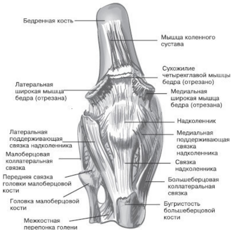
Правый коленный сустав, вид спереди