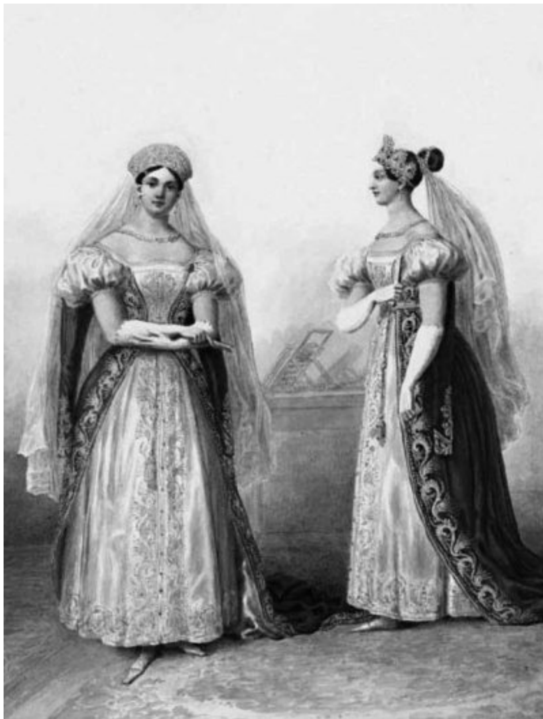
Парадный наряд фрейлин великих княжон. 1834 г.

В 1856 г., в связи с коронацией Александра II, был введен чин обер-форшнейдера (следовал за блюдами и разрезал кушанья для императорской четы), чин II и III классов. При коронации Николая I упоминается просто форшнейдер ( нем. Vorschneider – разрезатель). До середины XIX в. лиц, имевших придворные чины, было несколько десятков, в 1881 г. – 84, в 1898 г. – 163, в 1914 г. – 213 человек. В начале XX в. ко II классу по Табели о рангах относились обер-камергер, обер-гофмейстер, обер-гофмаршал, обер-шенк, обер-шталмейстер и обер-егермейстер; к III классу – гофмейстер, гофмаршал, шталмейстер, егермейстер, обер-церемониймейстер, IV – камергер, V – церемониймейстер и камер-юнкер, VI – камер-фурьер,