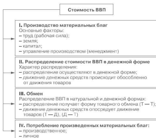
Рис. 1.1. Движение ВВП по стадиям (фазам) воспроизводственного процесса

Часть их передают государству в форме налогов и сборов и концентрируют в составе бюджетного и внебюджетных фондов. Поэтому финансовые ресурсы выступают материальным носителем финансовых отношений в национальном хозяйстве.