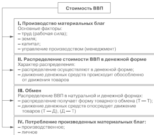
Рис. 1.1. Движение ВВП по стадиям (фазам) воспроизводственного процесса

2. Финансовые ресурсы используются через денежные фонды специального назначения, хотя возможна и нефондовая форма их расходования – например, сметная форма финансирования в бюджетных учреждениях. Фондовая форма функционирования финансовых ресурсов позволяет: