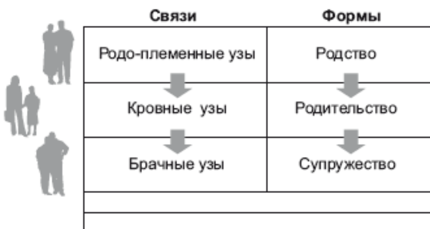
Рис. 1.1. Трансформация связующих и формообразующих основ брачно-семейных отношений

С психологической и этнографической точки зрения для семьи системообразующими являются брачно-семейные отношения.