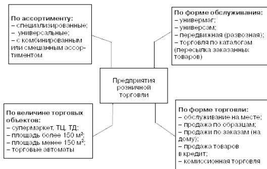
Рис. 1. Различные классификации предприятий розничной торговли

специализироваться на продаже того или иного вида товаров. Принято несколько классификаций торговых предприятий, которые сведены в общую схему (рис. 1).