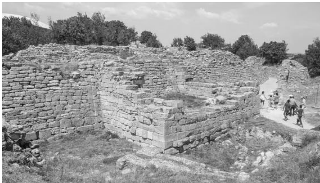
Рис. 16. Фортификационная стена и Восточные ворота Трои VI (XV–XIII вв. до н. э.)

Кем же были основатели Трои VI, столь заметно отличавшейся от городов предшествующих периодов? Блеген убежден, что они были греками, однако относительно места, откуда они отправились в новые края, судить с уверенностью он не мог: «То ли они кочевали с севера к берегам Эгейского моря, то ли приплыли на кораблях с юга России через Черное море и проливы Босфор и Дарданеллы, то ли они пришли в Грецию морским путем с запада или востока – это установить не удалось. Ни керамика, ни артефакты, ни даже кости лошадей не дают нам никаких подсказок» 38 .