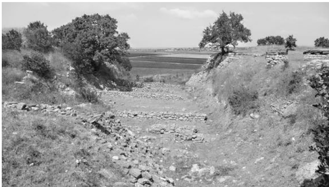
Рис. 11. Траншея Шлимана с остатками поселения раннего бронзового века

до тех пор, пока уровень пола не поднимался так высоко, что для нормального проживания в доме приходилось поднимать выше крышу и переделывать вход» 26 .