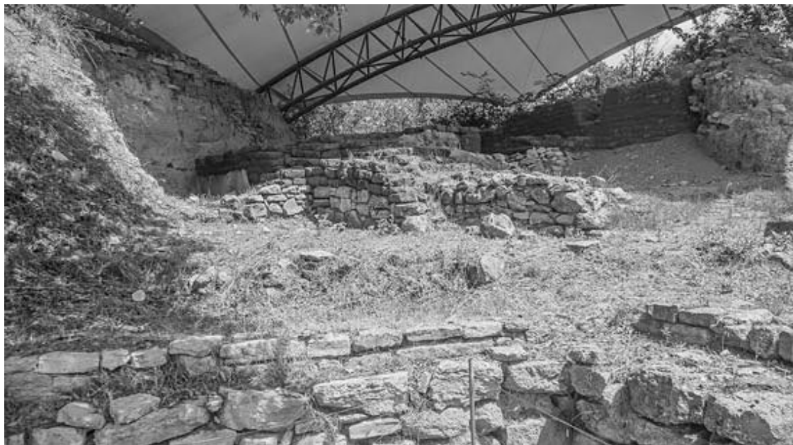
Рис. 20. Мегароны XXIII в. до н. э. защищены крышей-парусом от непогоды и ленточками – от любопытных туристов

Двести на двести – это четыре гектара, что примерно соответствует площади пяти футбольных полей или одного не самого крупного современного мегамолла. Как же могли разместиться здесь 50 тысяч защитников Трои, о которых пишет Гомер? Допустим, что большинство из них находилось за пределами бастиона. Сотрудники экспедиции Манфреда Корфмана Хельмут Беккер и Йорг Фасбиндер в начале 1990-х установили с помощью магнитной разведки, что троянский кремль в XIII–XII вв. до н. э. был окружен обширным нижним городом, который защищали два внешних кольца стен и вырубленный в скале ров, отстоящий от крепости на полкилометра. Таким образом, территория Трои расширялась примерно впятеро – теперь это уже примерно площадь московского Кремля. И все-таки – 50 тысяч человек, которым надо спать чуть более комфортно, чем стоя, да еще и держать скот, боевых лошадей, колесницы!.. На такой площади экономически обосновано, как выразилась бы Маргарет Тэтчер, проживание не более пяти тысяч человек. Корфман дает семь. Пусть так, но уж точно не больше!