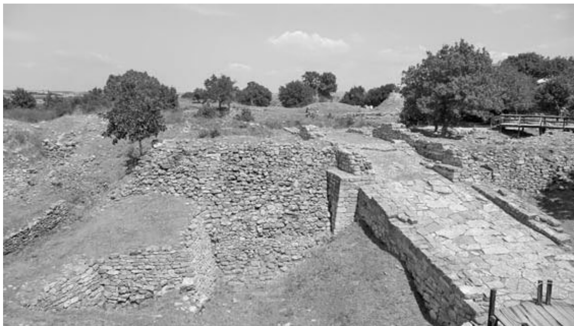
Рис. 14. Юго-западные (Скейские) ворота, близ которых Шлиман откопал «клад Приама», относятся к периоду Трои II (2500–2200 гг. до н. э.)

Город был уничтожен внезапным пожаром, его жители даже не успели собрать со столов драгоценную посуду. Однако катастрофа, по словам Блегена, «не привела к сколько-нибудь значительному нарушению процесса культурного развития поселения. При сохранении прежней цивилизации и отсутствии явных следов чужеродного влияния культура Трои II развивалась постепенно и неуклонно до тех пор, пока эстафету не приняла ее преемница – Троя III» 33 .