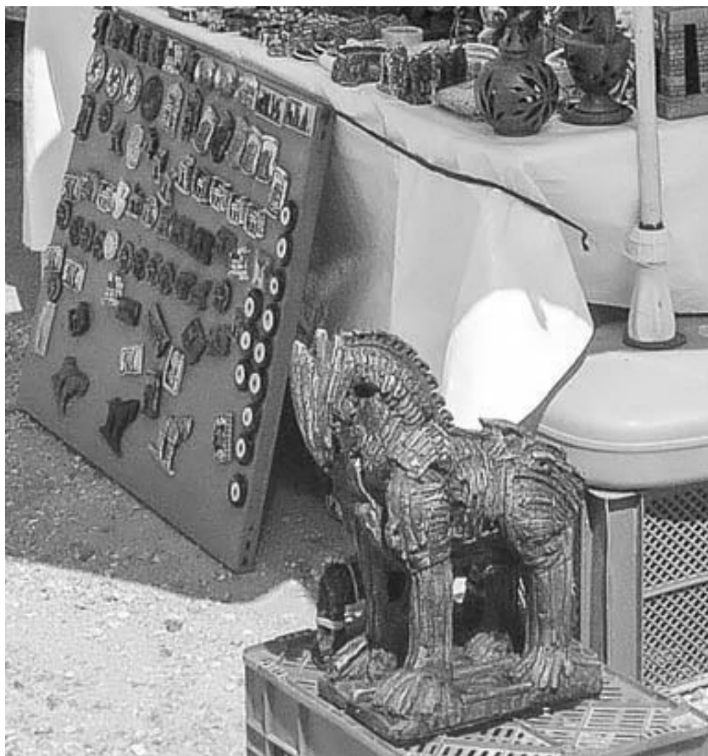
Рис. 6. Сувенирные лавки Тевфикие полны троянских коней

Все остальные события Троянской войны – начиная с похищения Елены и заканчивая исходом Энея – описаны в дошедших до нас во фрагментах и пересказах так называемых киклических поэмах, а также в произведениях более поздних авторов – Эсхила, Софокла, Геродота, Фукидида, Вергилия и др. Из этих дополнительных источников можно узнать о том, что судьба Ифигении была не столь трагичной: в момент заклания ее спасла богиня Артемида – завернув в облако, она унесла девчонку в Таврию и сделала ее там своей жрицей. Что деревянного коня создал не Одиссей, а Эпей, а сидело в нем ни много ни мало три тысячи человек. И даже, например, о том, что все то время, пока шла Троянская война, в Трое находился лишь голографический, что ли, образ Елены, сама же она все эти годы жила в Египте, оставаясь верной мужу 13 .