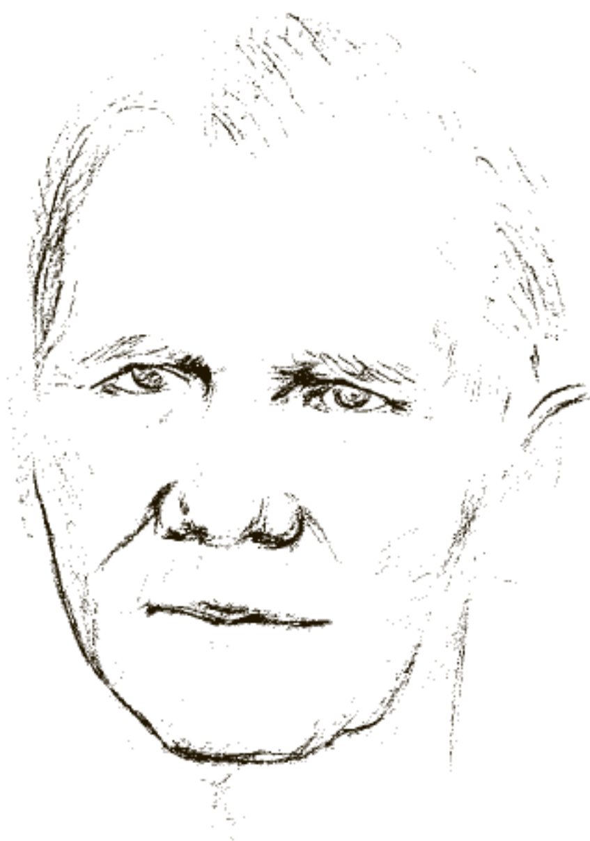
Рис. 17. Карл Блеген утверждал, что Троя VIIa была захвачена и сожжена в середине XIII в. до н. э., аргументируя это преобладанием в ее культурном слое микенской керамики типа III Б. Рисунок Ольги Арановой

пившего в поход против Трои, лежали в развалинах, а сумевшим спастись остаткам населения предстояла трудная борьба за выживание. Период, когда изготавливалась и находилась в обиходе керамика типа III В, характеризовался обнищанием народа и упадком культуры, а от прежней славы Микен к тому времени остались только воспоминания. Микенские цари и князья уже не могли объединиться и отправиться в иные земли в завоевательный поход. Такое было возможно значительно раньше, когда микенская цивилизация находилась на пике своей политической, экономической и военной мощи, когда во всем своем величии стояли прекрасные царские дворцы, радушно встречавшие дорогих гостей. Крепость была взята и сожжена до того, как закончилась первая половина XIII в., то есть тогда, когда микенская керамика типа III Б входила в Трое VIIa в пору расцвета, а керамика типа III А уступала ей дорогу.