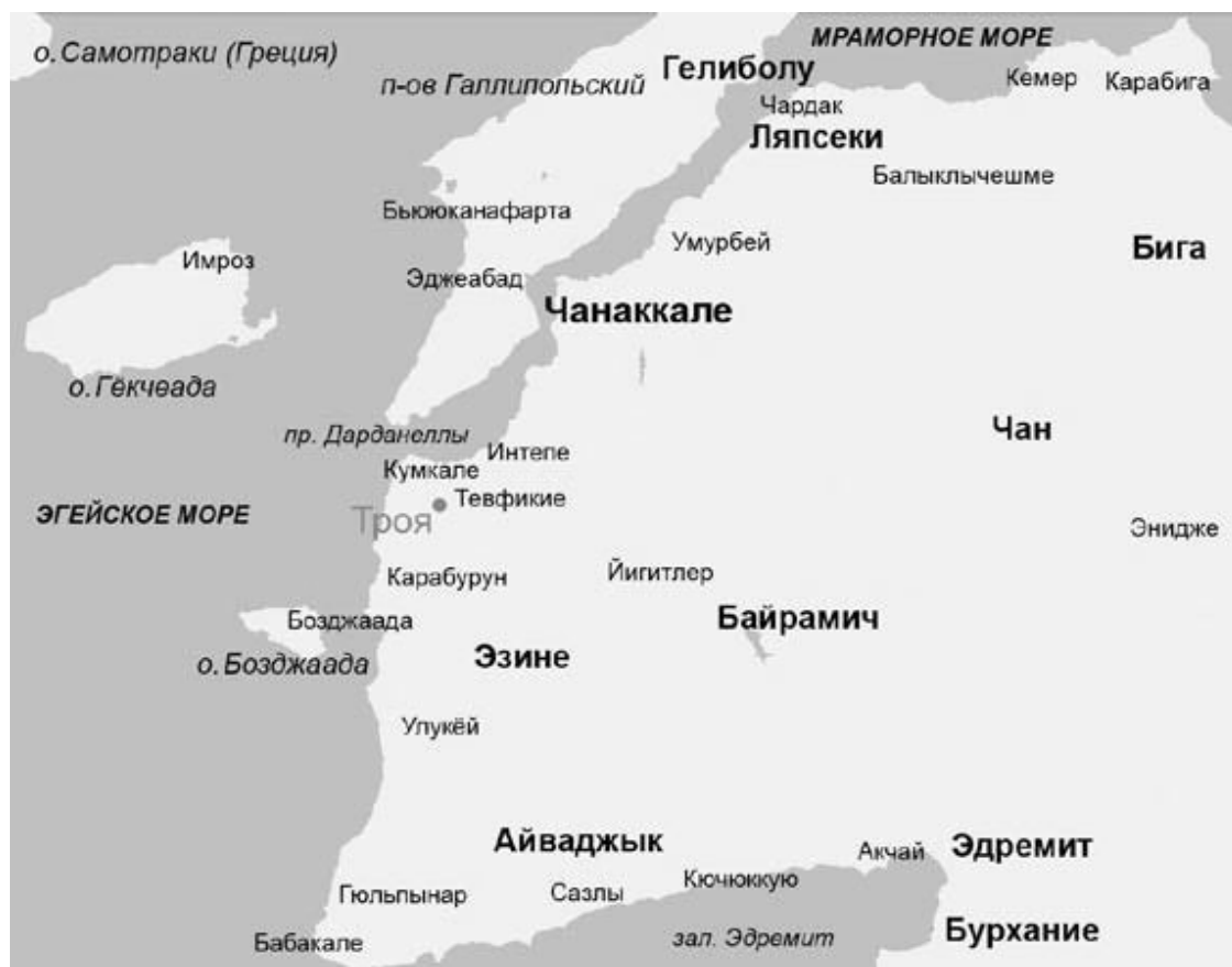
Рис. 1. Троада – древнее название полуострова Бига, на котором располагалась легендарная Троя

480 год до н. э. Идущий войной на греков персидский царь Ксеркс останавливает свои войска на берегу Геллеспонта. Через узкий пролив построены два понтонных моста. Внезапно налетевшая буря разметаёт постройки, скрепленные папирусными канатами, и царь приказывает наказывать мятежные воды ударами бича, а строителям – отрубить нерадивые головы. Прежде чем была наведена новая переправа, Ксеркс посещает легендарную крепость. Вот как описывает его визит Геродот: «Царь... желая осмотреть кремль Приама, поднялся на его вершину. Осмотрев кремль и выслушав все рассказы о том, что там произошло, царь принес в жертву Афине Илионской 1000 быков. Маги же совершили [местным] героям жертвенное возлияние» 6 . Щедрая гекатомба не помогла Ксерксу сломить эллинский дух и покорить Грецию. Потерпев ряд сокрушительных поражений от греков, уступив им часть своей территории и доведя страну до голода своими военными авантюрами, Ксеркс был убит в спальне собственного дворца.