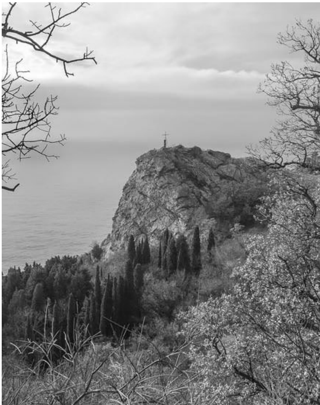
Рис. 7. Скала Ифигения в Крыму (пос. Кастрополь), где, по преданию, укрылась дочь Агамемнона

Таким образом, получается, что к концу войны Елена, «лицо, пустившее по водам тысячу судов», была по тем временам уже вполне престарелой мадам. И если в свете этого верность Париса достойна лишь восторга, то терпение его соотечественников, напротив, вводит в недоумение: выносить в течение стольких лет такие лишения из-за увядающей чужеземной матроны? Помилуйте!.. Святые они все-таки люди были – троянцы!..