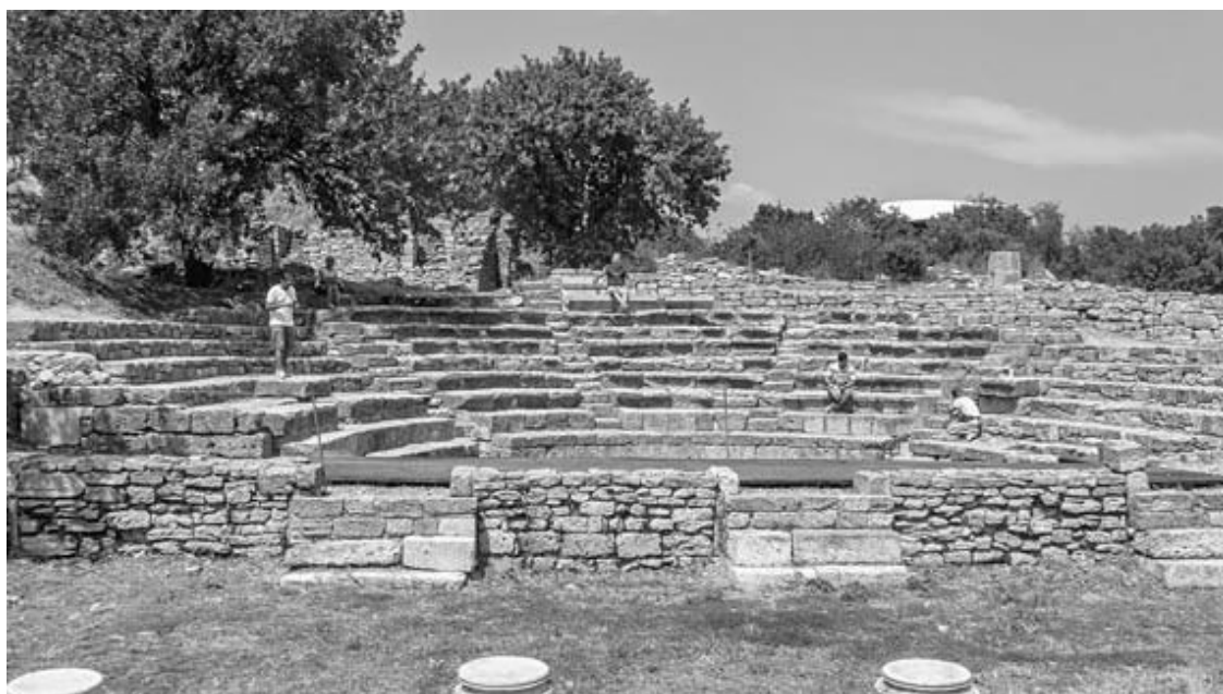
Рис. 19. Римский одеон времен Трои IX (85 г. до н. э. – 500 г. н. э.)

Когда Фимбрия стал хвалиться, что он на 11-й день захватил этот город, который Агамемнон взял лишь с трудом на десятый год, имея флот в тысячу кораблей, причем вся Греция помогала в походе, один из илионцев заметил: «Да, но у нас не было такого защитника, как Гектор» 46 .