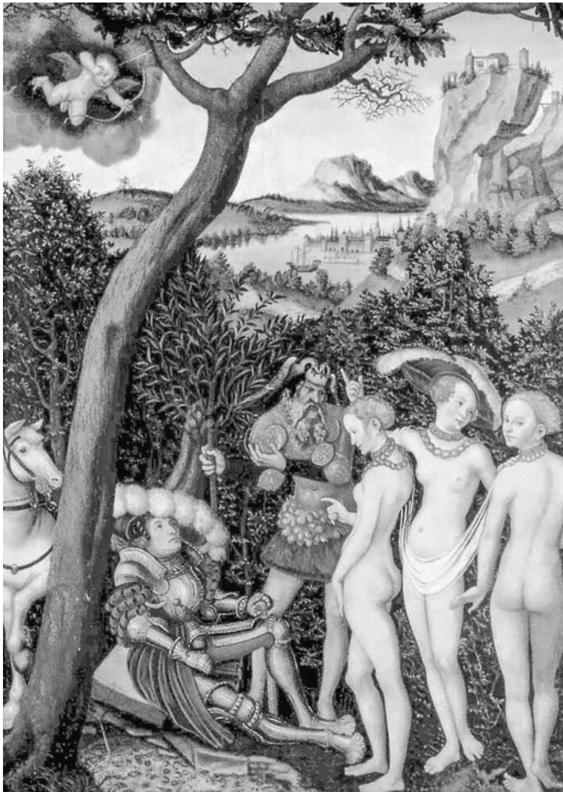
Рис. 4. Лукас Кранах Старший. Суд Париса. 1528

и они никак не могли договориться, кому из них оно предназначено.) Гера пообещала, что если Парис остановит свой выбор на ней, то она даст пареньку власть над народами, Афина – мудрость, недоступную прочим смертным, а Афродита – великую любовь. Подумал-подумал Парис и выбрал Афродиту, а та показала ему в воде образ прекраснейшей из женщин – его суженой.