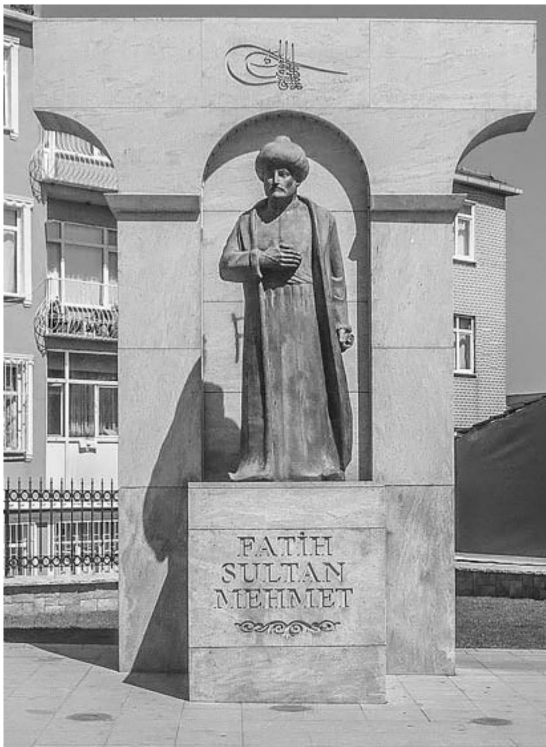
Рис. 2. Памятник Мехмеду II в Стамбуле

Полтысячи лет Трояда говорит по-турецки. Для новых обитателей этих земель Троя – прежде всего туристическая достопримечательность. Уже в XVI–XVII вв. посещавшим восточное побережье Дарданелл европейцам предприимчивые турки показывали различные руины в самых произвольных местах, выдавая их за фрагменты древнего Илиона. Их традицию продолжают сегодняшние гиды, транслирующие древние легенды вперемешку с позднейшими мифами об удачливом Генрихе Шлимане, кладе царя Приама и великой победе греков, якобы подтвержденной археологическими находками. Яркие символы новой, туристической Трои –