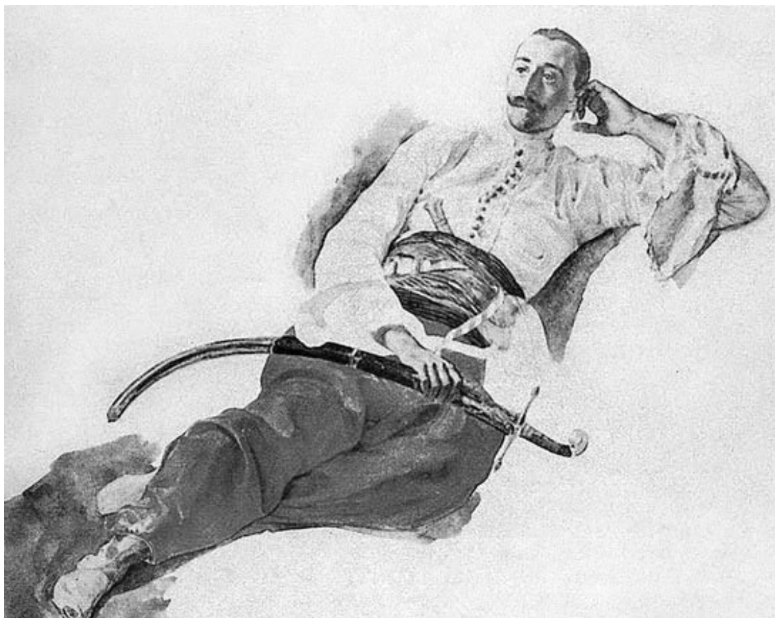
Рис. 10. Карл Брюллов. Портрет П. А. Чихачёва. 1835

Раскапывая Гиссарлык в 1865 г., Калверт наткнулся на остатки храма Афины и городской стены, возведенной Лисимахом. На этом финансовые возможности дипломата были исчерпаны. Надежду на продолжение поисков дала Калверту встреча с тщеславным толстосумом Шлиманом, в то время убежденным, что руины Трои покоятся там, где их локализовал Лешевалье, – в Бунарбаши. Позднее Калверт подтвердит это в письме в газету «Гардиан»: «Когда я впервые встретил доктора [Шлимана] в августе 1868 г., для него тема Гиссарлыка как местонахождения Трои была новой» 21 . Шлиман же будет все отрицать и даже развяжет против Калверта полномасштабную войну в прессе, обвиняя того во лжи. Ни один документ ранее 1868 г. не свидетельствует, что Шлимана хоть как-то занимал троянский вопрос. По выражению историка Андрея Стрелкова, Шлиман попросту «споткнулся о Трою» во время очередного путешествия 22 . Однако сам коммерсант представит события так, что к поискам Трои он шел всю свою жизнь, а Гиссарлык был избран им как место для раскопок древнего города лишь по гомеровским подсказкам. Чтобы исключить всякое упоминание о Калверте из легенды об открытии Трои, Шлиман сочинит историю о детской мечте и книжке с картинками 23 , а чтобы представить себя человеком, поистине одержимым гомеровским эпосом, назовет детей от новой греческой жены Софии Энгастроменос 24 Агамемноном и Андромахой.