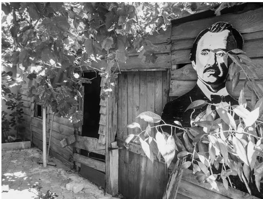
Рис. 9. Фальшивый дом Шлимана в деревне Тевфикие строили немцы

В создании культа Шлимана решающую роль сыграл сам Генрих Шлиман. Мастер самопиара, он сочинил о себе массу легенд, большинство из которых живы до сих пор.