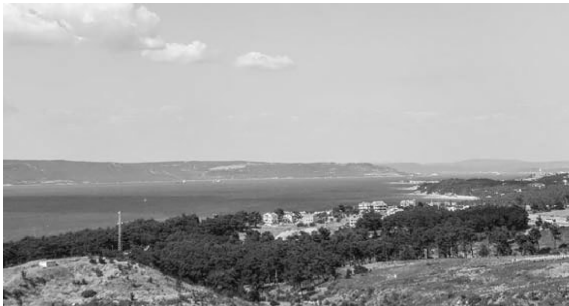
Рис. 21. Геллеспонт (Дарданеллы) в районе г. Чанакале

Несмотря на столь поэтичные доводы Байрона, убеждение в том, что Троянская война – всего только вымысел слепого аэда, было распространено среди ученых еще полвека, пока раскопки Шлимана не уверили научную общественность в исторической подлинности великих городов, описанных в «Илиаде», – Трои, Микен, Тиринф, Орхомена. Некоторые находки археолога-любителя на первый взгляд в точности соответствовали предметам, описанным Гомером, – на найденном в Микенах клинке бронзового кинжала был изображен знаменитый башенный щит, которым владел в «Илиаде» Аякс, там же обнаружены остатки шлема из клыков вепря, описанного в десятой рапсодии поэмы, и т. д. Все это выглядело неоспоримым доказательством реальности и самой Троянской войны. А сам Гомер уже представлялся если не непосредственным свидетелем описываемых им событий, то, по крайней мере, младшим современником своих героев. «Сведения Гомера постепенно приобрели характер своего рода “путеводителя” в изучении эгейской культуры микенской эпохи» 51 .