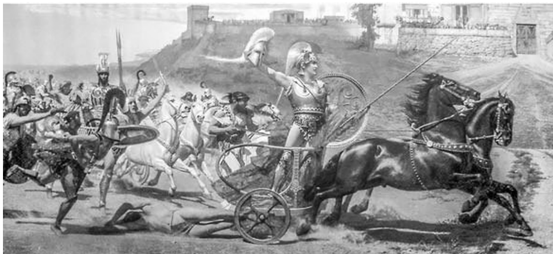
Рис. 5. Франц Мач. Триумф Ахилла. 1892

Ночью Приам пробирается в лагерь Ахилла и умоляет героя отдать ему тело сына. Потрясенный храбростью старца и обуреваемый чувством вины за гибель друга, Ахилл внимает его мольбам.