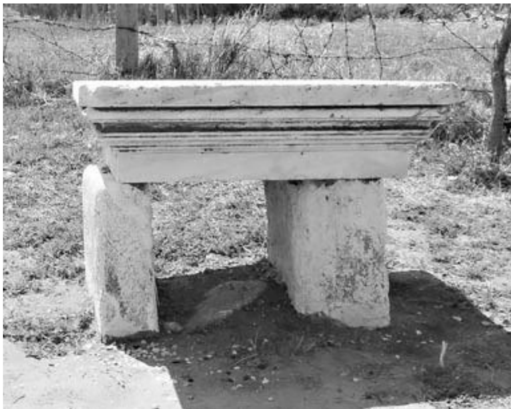
Рис. 3. Скамейка из троянских артефактов в деревне Тевфикие

фальшивый дом Шлимана в деревне Тевфикие, большой деревянный конь, построенный в 1975 г. специально для фотографирования экскурсантов. И еще – обломки античных зданий, растащенные местными жителями для различных хозяйственных нужд. Тут скамейку устроили из капители дорической колонны, там – подперли забор куском древнего монумента.