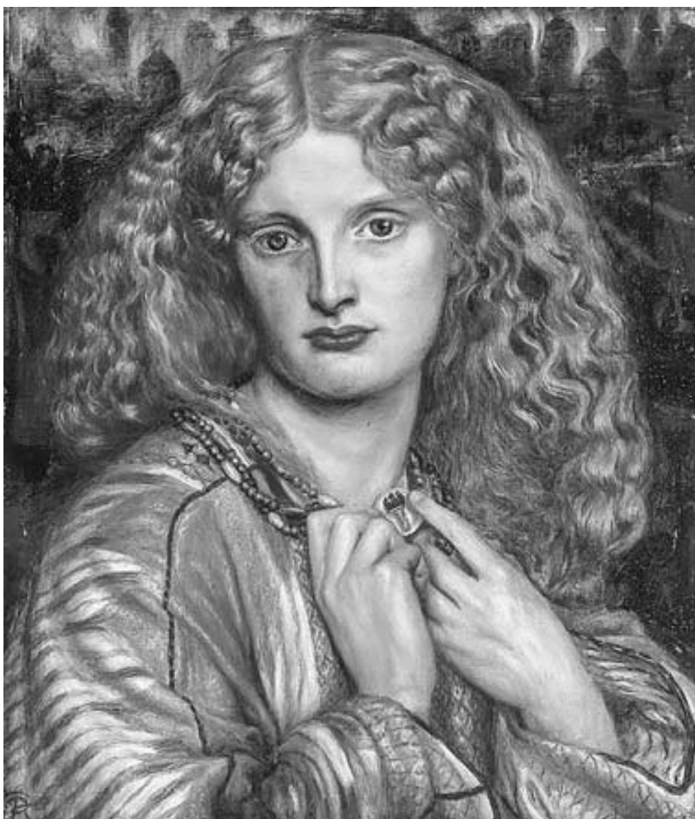
Рис. 8. Данте Габриэль Россетти. Елена Троянская. 1863

Так бытийствует легенда о Трое в сознании наиболее осведомленных представителей интеллигенции. Страшно узок их круг! Но еще уже круг тех из них, кто не поленился прочесть гомеровские поэмы не по диагонали, но целиком и внимательно. «Я список кораблей прочел до середины» 15 , – признавался Осип Мандельштам. Хотя, надо сказать, соответствующая песнь, «Беотия, или Перечень кораблей», и в самом деле чудесное средство от бессонницы. Из русских переводов «Илиады» Гомера наиболее известным является перевод современника Пушкина Николая Гнедича. Исключительно красивый, но тяжеловесный и архаичный, он ввергал в здоровый крепкий сон не одно поколение читателей. Не так известны переводы Викентия Вересаева и Павла Шуйского, более современные и более точно соответствующие букве оригинала, но, однако, не его духу. А потому, вероятно, и не столь популярные.