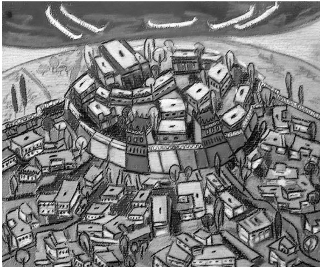
Рис. 15. Примерно такой представляется нашим современникам Троя VI. Рисунок Ники Тя-Сен

чески полная смена ассортимента керамических изделий. Этот город был уничтожен землетрясением, о чем свидетельствуют характерные трещины на стенах зданий.