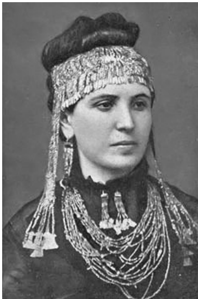
Рис. 12. София Энгастроменос в «Большой диадеме» из «клада Приама». Фото 1874 г.

Научная общественность, прежде не обращавшая никакого внимания на развлечения дилетанта, обрушила на него шквал критики. Профессиональных археологов привело в ужас то варварство, с которым Шлиман буквально разметал культурные слои древнего холма, уничтожив большую часть позднейших построек.