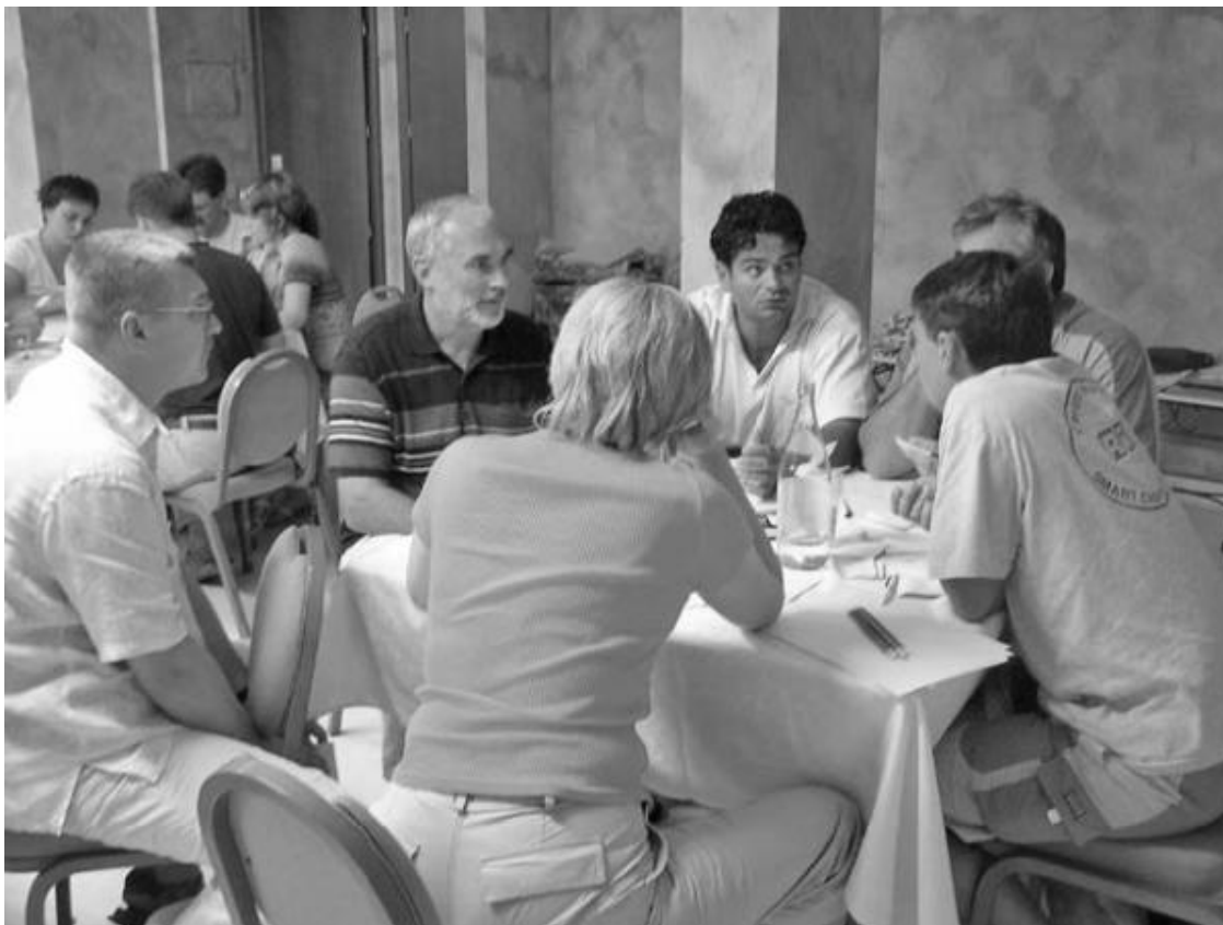
Мозговой штурм в компании RRC

После мозговых штурмов мы с директором по маркетингу обобщили наработки и сформулировали несколько вариантов видения, миссии и ценностей компании. Обсудили все варианты с топ-менеджерами, которые выбрали лучший вариант и внесли в него свои изменения. Президент его утвердил. Текст поместили в красивую папку, и на одном из собраний, которые у нас проходили раз в полгода, каждый руководитель поставил подпись.