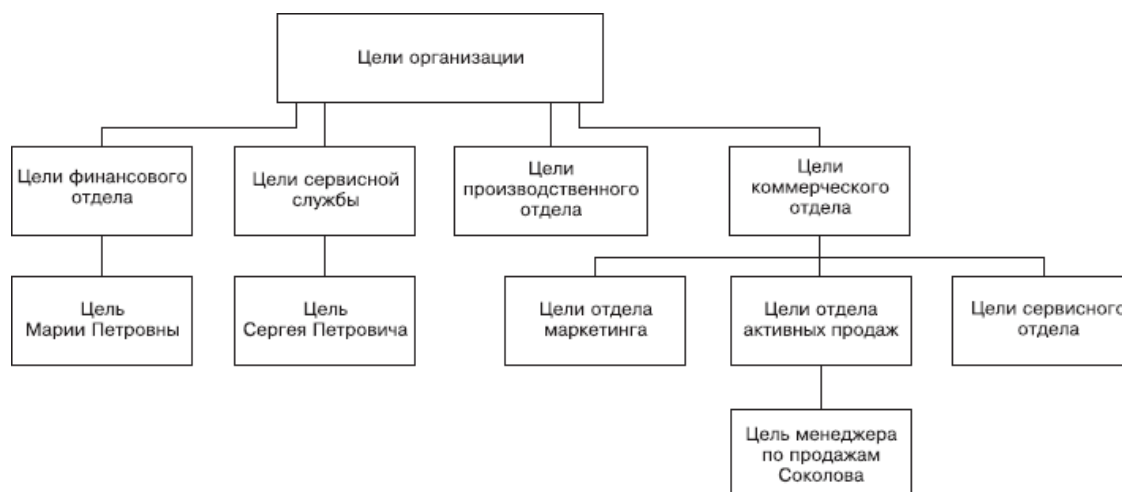
Рис. 2.2. Разработка мотивирующих целей методом каскадирования

• Цели разрабатываются сверху вниз , а никак не наоборот. Поэтому сразу вычеркиваем ситуацию, когда генеральный директор или HR-специалист ждет от руководителей своих подразделений или от простых специалистов инициативы снизу: «Они у меня такие пассивные – ничего не предлагают». Задача правильно поставить цели полностью лежит на плечах руководителя, и не надо спихивать эту ответственность на подчиненных: им и так есть чем заняться.