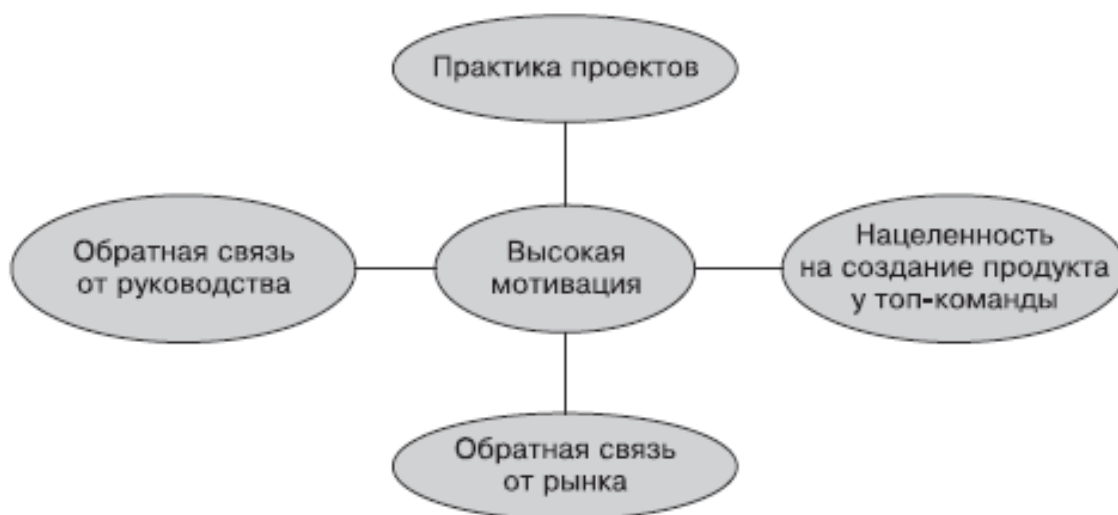
Рис. 1.2. Четыре компонента, создающие мотивационную силу качественного продукта