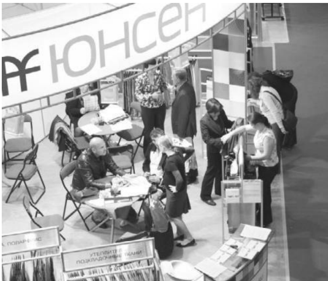
Стенд компании ЮНСЕН на выставке

За счет изменения позиции компании получить быструю отдачу невозможно. Мне на ум приходит одна аналогия. У школы рукопашного боя есть правило: всегда действуй первым. Если применить его к нашей ситуации, то окажется, что мы должны постоянно атаковать сами себя. Даже если мы кайфовые ребята и у нас все хорошо. Особенно это правило важно для нашего рынка.