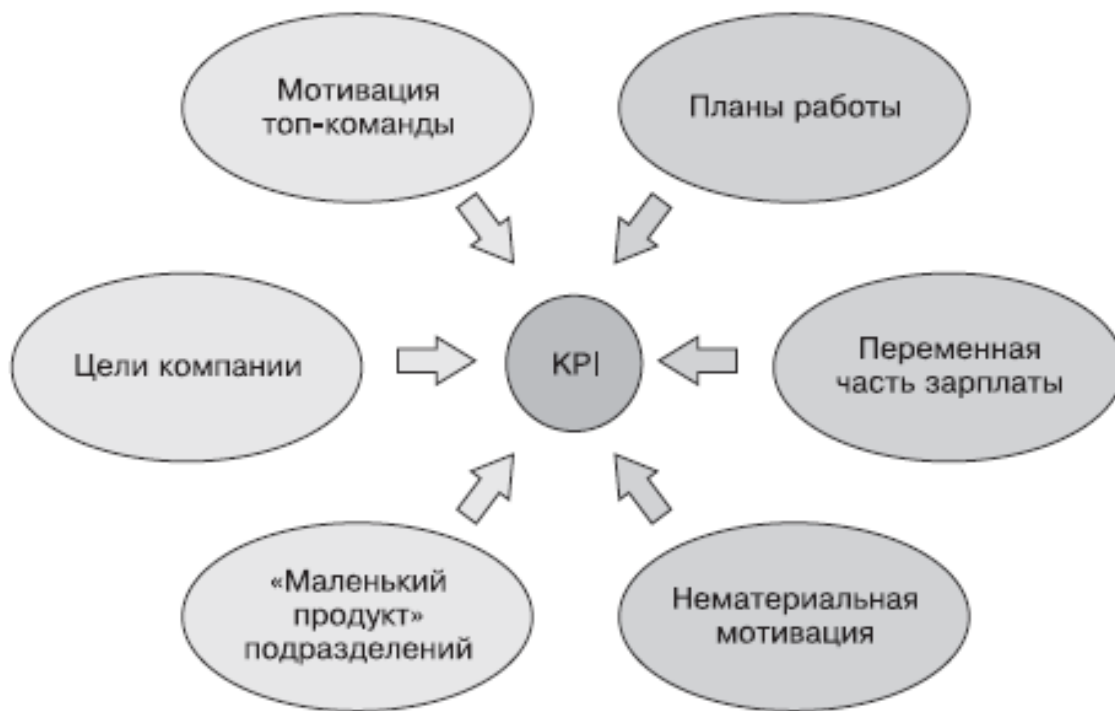
Рис. 2.1. Функционирование системы оценки

Рассмотрим причины необходимости четких критериев оценки (рис. 2.1).