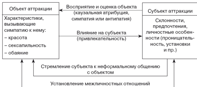
Рис. 2.1. Возникновение аттракции при восприятии одного человека другим

Все это можно представить в виде следующей схемы (рис. 2.1):