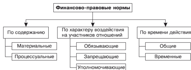
Рис. 1.1. Классификация финансово-правовых норм

В зависимости от характера воздействия на участников финансовых отношений нормы подразделяются на три вида: