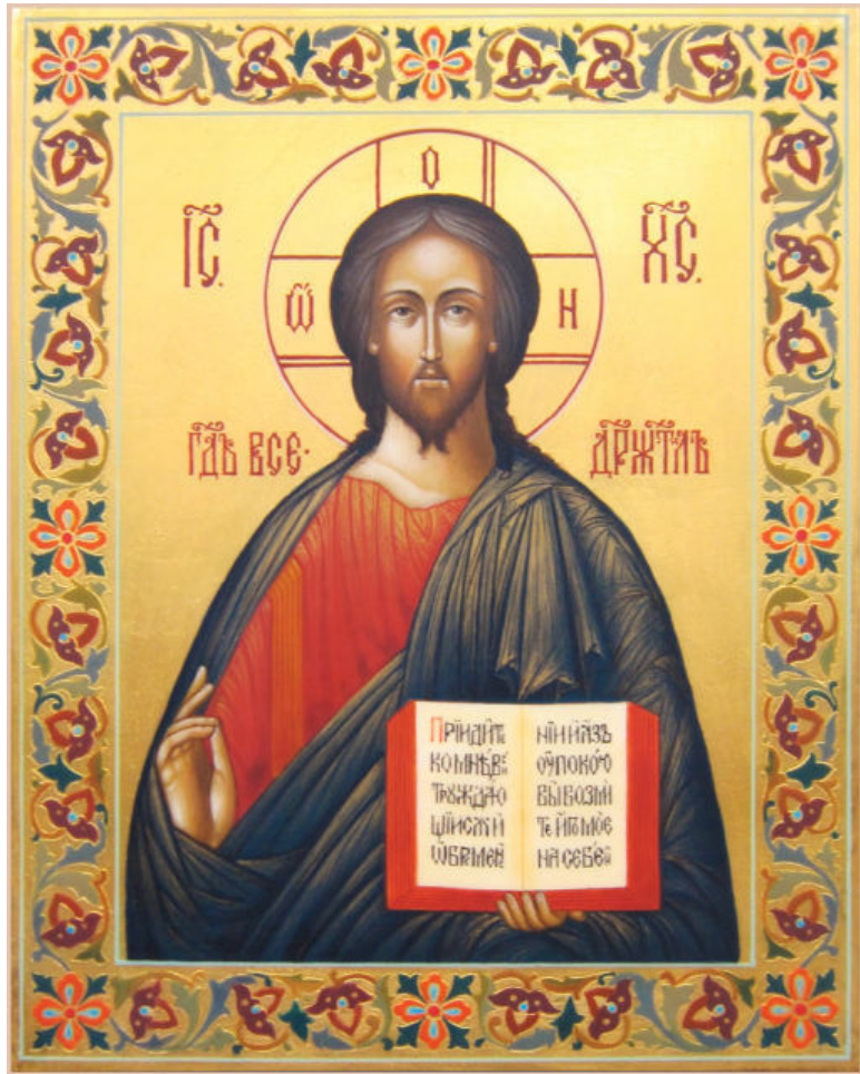
Роспись под эмаль. Икона Господь Вседержитель. Мастерская Виктора Юскова