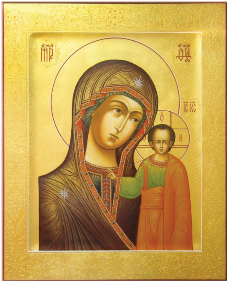
Чеканка по золоту. Икона Казанской Богоматери. Мастерская Виктора Юскова