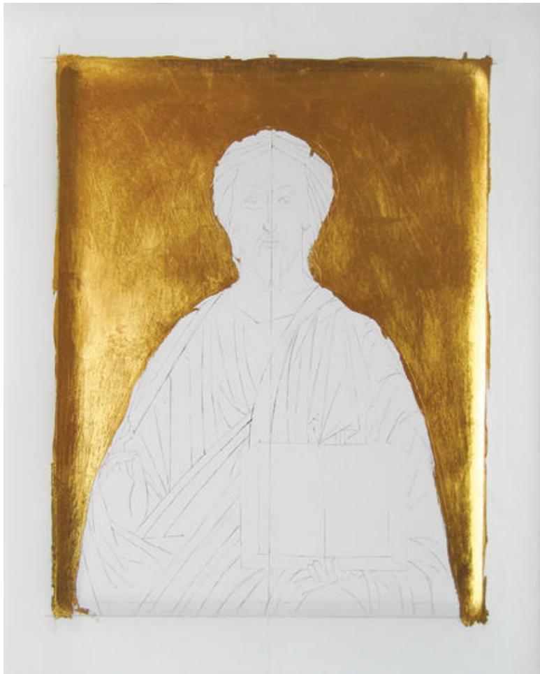
Золочение фона. Икона Господь Вседержитель. Мастерская Виктора Юскова