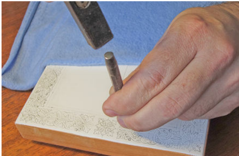
Чеканка по левкасу