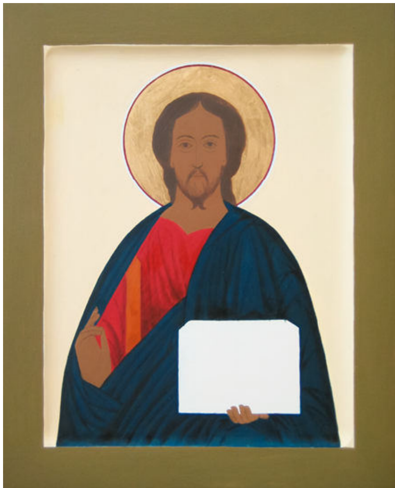
«Личное» письмо. Икона Господь Вседержитель.