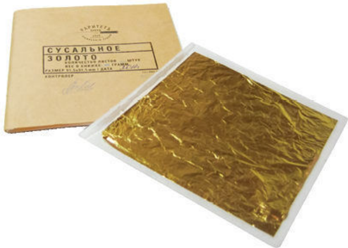
Сусальное листовое золото