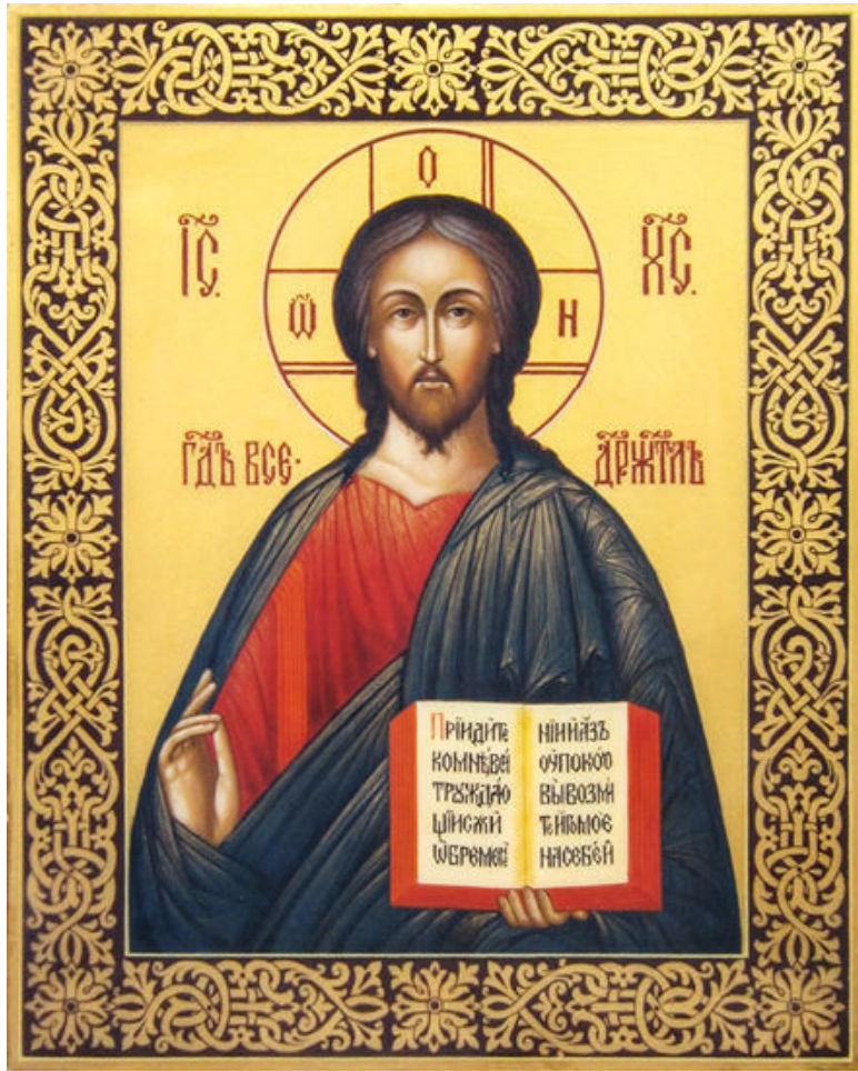
Образец орнамента на полях. Икона Господь Все- держитель. Мастерская Виктора Юскова