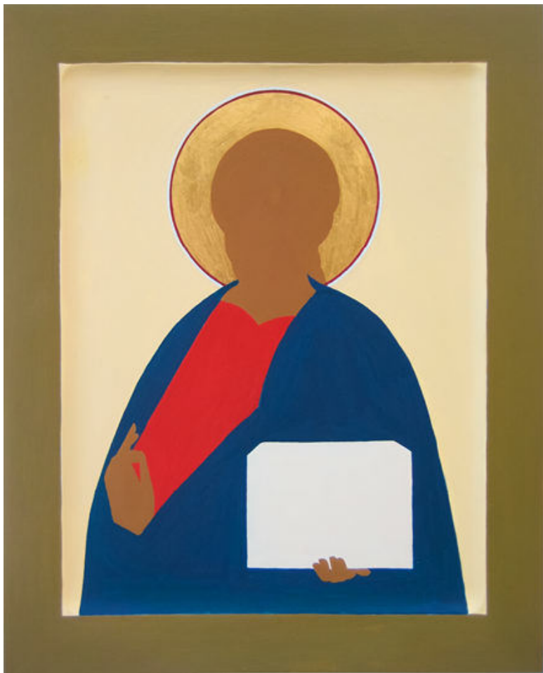
«Роскрышь». Икона Господь Вседержитель. Мастерская Виктора Юскова