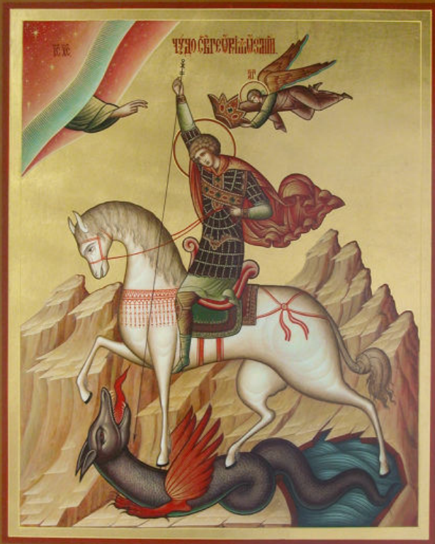
Чудо Георгия о змие. Елена Парамонова. Мастерская «Палехский иконостас»