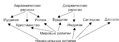
Рис. 1. Современные религии

По степени распространенности различают мировые и национальные религии. Мировые религии распространены на значительной территории и оказали (и оказывают до сих пор) огромное влияние на ход всемирной истории. К ним относят христианство , ислам и буддизм . Национальные религии, широко распространенные в прошлом, в настоящее время представлены лишь иудаизмом (религия евреев), индуизмом (религия индийцев), даосизмом (религия китайцев) и синтоизмом (религия японцев). Иногда иудаизм, христианство и ислам объединяют в группу авраамических религий (от имени Авраама, почитаемого во всех трех патриархом). Эти религии также называют монотеистическими (от греческих слов «моно» – «один» и «теос» – «бог»), так как они провозглашают единобожие – почитание Единственного Бога-Творца. В противоположность им, индуизм и основанный на нем буддизм объединяют под именем дхармических (от санскритского слова «дхарма» – «закон») религий. Их общей чертой является вера в перерождение всех живых существ после смерти в новом теле. Дхармические, как и многие другие религии, являются политеистическими (от греческих слов «поли» – «много» и «теос» – «бог»), то есть допускающими поклонение многим богам. Приверженцы монотеистических религий называют политеистов «язычниками».