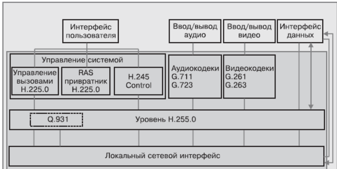
Рис. 1.4. Архитектура H.323 и основные стандарты, входящие в этот набор

Набор стандартов H.323 используется в некоторых программах для интернет-телефонии, таких как NetMeeting и Ekiga. Однако сегодня H.323 не является единственным общепризнанным стандартом, хотя и рекомендован к использованию ITU.