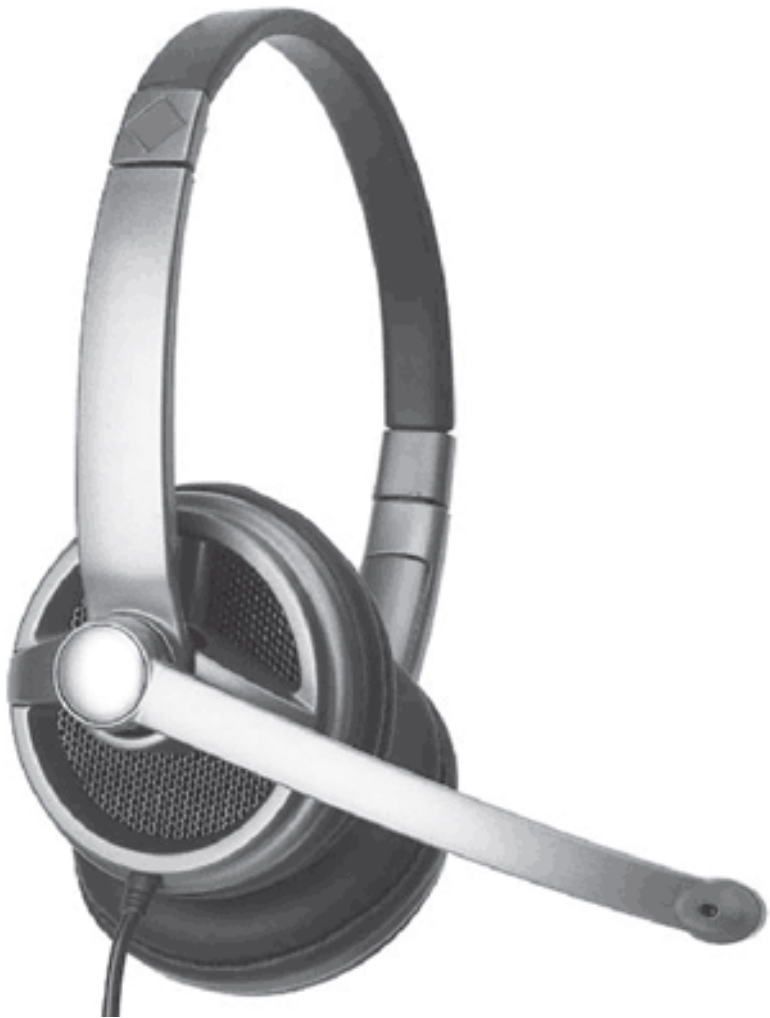
Рис. 1.1. Пример стереогарнитуры для телефонии