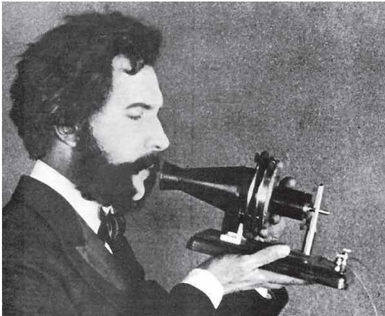
Рис. 1.2. 1876 год. Александр Белл говорит в трубку телефона

На пути дальнейшего развития телефона были изобретены электрический микрофон, пришедший на смену угольному, громкая связь, тоновый набор, цифровое сжатие звука. Затем появились цифровые технологии – ISDN, DSL, сотовая связь, DECT, VoIP-телефония.