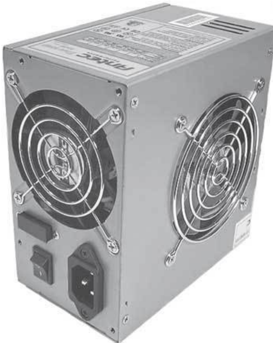
Рис. 1.1. Блок питания

Без сомнения, блок питания (рис. 1.1) – самый простой, но самый важный компонент компьютера. Он отвечает за снабжение стабильным напряжением всех устройств, установленных в компьютере (в том числе подключенных к USB-портам).