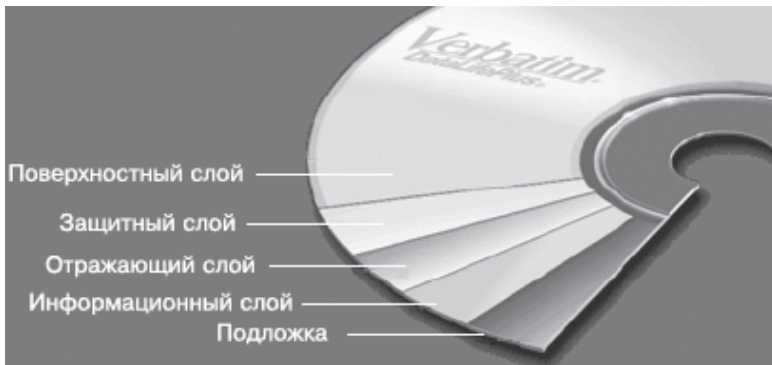
Рис. 1.1. Физическая структура диска CD-R

При записи диска CD-R его информационный слой обрабатывается фокусированным лазерным лучом высокой мощности. Под действием луча «прожженные» участки становятся непрозрачными и начинают рассеивать свет. Часто такие участки называют питами (от англ. pit – ямка, углубление).