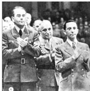
Альберт Шпеер (слева) и Йозеф Геббельс (справа) возмущались варварством гауляйтера Польши и Украины Эриха Коха