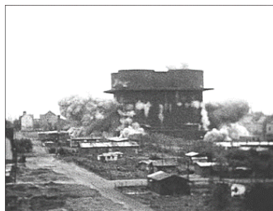
Берлин, 1945 год. Подрыв башни Фридрихсхалле, после которого исчезла ценнейшая коллекция из 400 картин