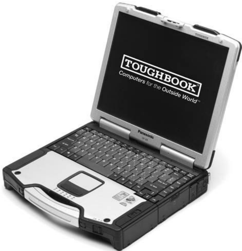
Рис. 2.9. Защищенный ноутбук

Их выпуском занимается ограниченный круг производителей, самый известный среди которых Panasonic.