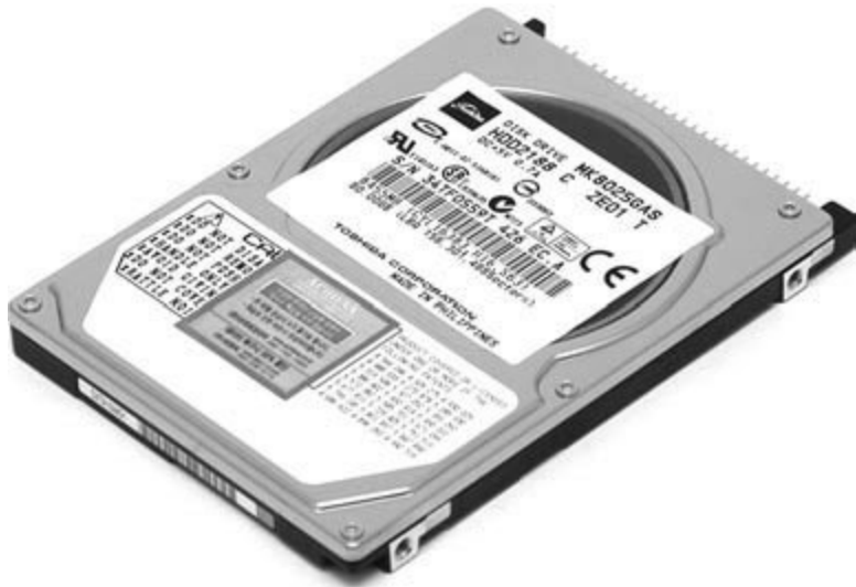
Рис. 3.4. Жесткий диск для ноутбука