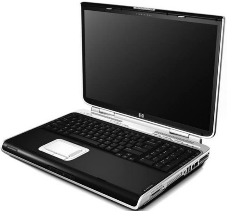
Рис. 2.3. Ноутбук – замена настольного компьютера

По замыслу производителей DTR-ноутбуки могут служить весьма неплохой альтернативой обычному настольному ПК (рис. 2.3).