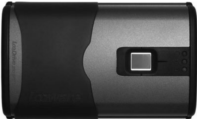
Рис. 4.11. Внешний жесткий диск формата 2,5"

Сегодня используется два способа подключения жесткого диска: через USB и FireWire. О первом типе говорилось уже не раз. Назначение разъема USB универсально, поэтому с ним совместимы не только мышь, клавиатура, принтер, сканер, но и некоторые внешние носители.