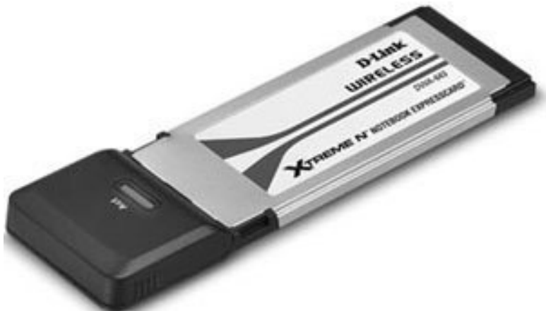
Рис. 4.7. Сетевая карта Wi-Fi, выполненная в формате ExpressCard

Отчасти решить проблему с установкой внешнего устройства призван специальный стандарт карт расширения. Есть две версии: PC Card (известный также как PCMCIA) и ExpressCard. Выглядят они как узкие и длинные (размеры примерно 50 x 600 мм) разъемы, в которые вставляются какие-либо карты (рис. 4.7).