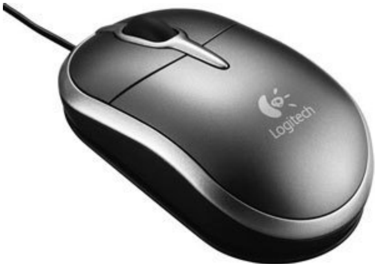
Рис. 4.1. Специальная мышь для ноутбука