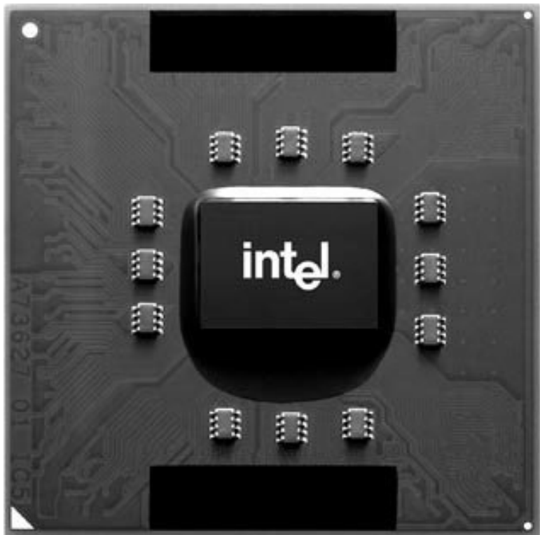
Рис. 3.1. Процессор

Скорость работы процессора определяется тактами и количеством операций, которые он может выполнить за один такт. Чем больше тех и других, тем более быстрым можно считать ЦП. Наверное, многие слышали про «таинственные»