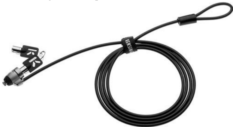
Рис. 4.5. Kensington Lock поможет уберечь ваш ноутбук от кражи

Специально для него можно приобрести крепкий тросик, позволяющий прикрепить ноутбук к чему-нибудь неподвижному. Это может быть все что угодно: от ножки стола до трубы батареи отопления.