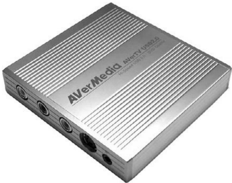
Рис. 4.14. Внешний ТВ-тюнер AverMedia

Ассортимент этого производителя представлен моделями ТВ-тюнеров, которые отличаются достаточно высокой функциональностью. Распространены также ТВ-тюнеры компаний Gotview и Beholder. Кстати, все три производителя ориентируются на русскоязычного пользователя, что является существенным плюсом.