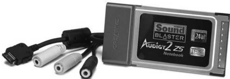
Рис. 4.8. Звуковая карта Creative Audigy ZS в формате PC Card

Если вы желаете смотреть DVD-фильмы, слушая качественный трехмерный звук на шестиканальных колонках, то лучше все же приобрести внешнюю звуковую карту. Выпуском таких устройств занимается, в частности, компания Creative. Она производит внешние звуковые карты в форматах PC Card (рис. 4.8) и USB (рис. 4.9).