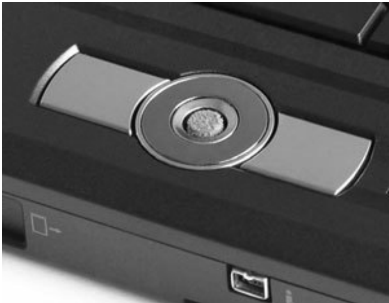
Рис. 3.7. Мини-джойстик (трекпоинт)

Несмотря на старания производителей сделать альтернативные устройства ввода более удобными, обычный трехдолларовый «грызун» будет гораздо функциональнее самого «навороченного» тачпада. Так что не ленитесь купить для своего мобильного друга обычную мышь. Тем самым вы значительно облегчите себе жизнь. О том, какую мышь лучше выбрать, рассказано в следующей главе.