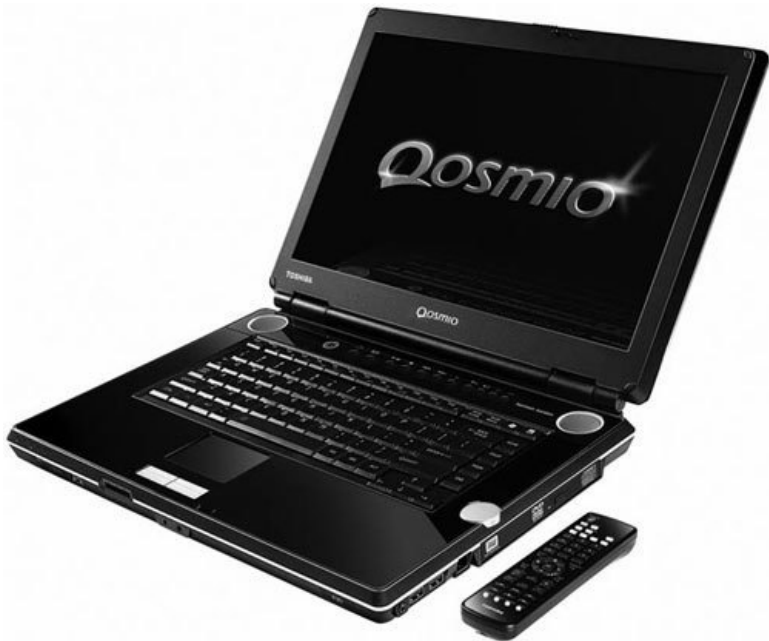
Рис. 2.4. Мультимедианоутбук

Мультимедийные ноутбуки неплохо подойдут для дома, так как чаще всего вышеперечисленные функции востребованы именно в домашней обстановке. Конечно, такие компьютеры стоят на несколько сотен долларов больше остальных. Однако, если попытаться реализовать аналогичную функциональность в обычном DTR-ноутбуке, может выйти дороже. Кроме того, в мультимедианоутбуки устанавливаются более качественные экраны и достаточно быстрые компо-