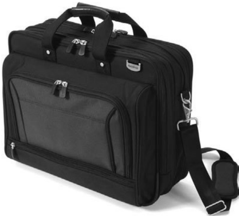
Рис. 4.3. Сумка для ноутбука

В первую очередь отмечу наличие специального отсека для ноутбука. Это отделение укрепляется мягкими амортизирующими стенками, которые служат защитой от ударов и низкой температуры.