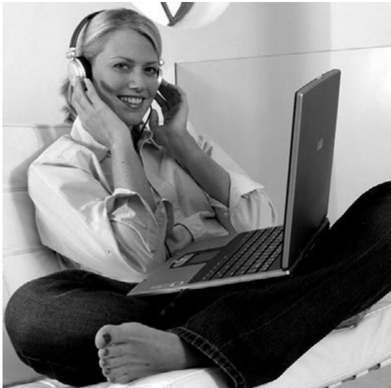
Рис. 1.1. Ноутбук можно использовать для работы практически везде

Другой момент касается проводов. Формально с ноутбуком можно работать без внешних устройств (то есть без использования проводов). Тем самым уменьшается риск сломать либо разбить компьютер. Конечно, при работе на од-