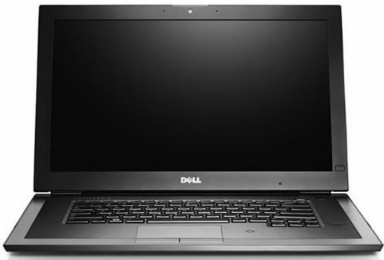
Рис. 2.2. Бизнес-ноутбук

К бизнес-классу современных высокотехнологичных устройств обычно относят наиболее функциональные модели, обладающие при этом стильным внешним видом, качественным исполнением и, конечно же, довольно высокой ценой (рис. 2.2).