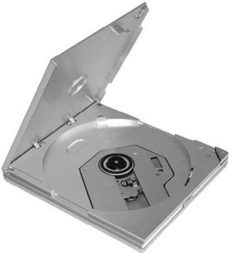
Рис. 4.12. Специальный привод, предназначенный для переноски с ноутбуком

Подобные оптические приводы значительно дороже своих внутренних аналогов, зато удобство транспортировки на