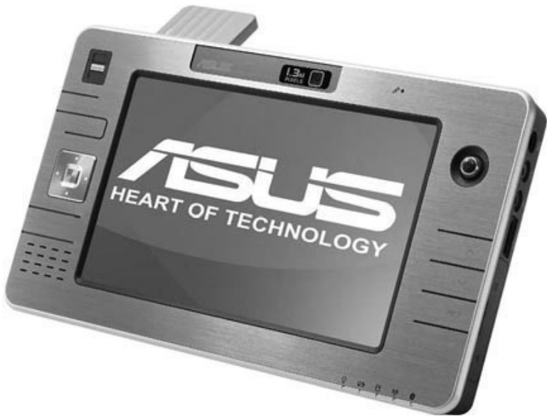
Рис. 2.8. Ультрамобильный ПК