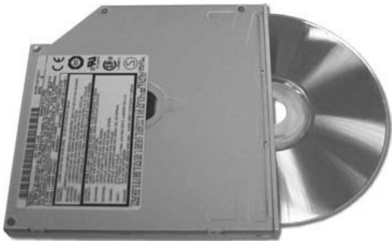
Рис. 3.5. Оптический привод

Оптические приводы бывают следующих типов.