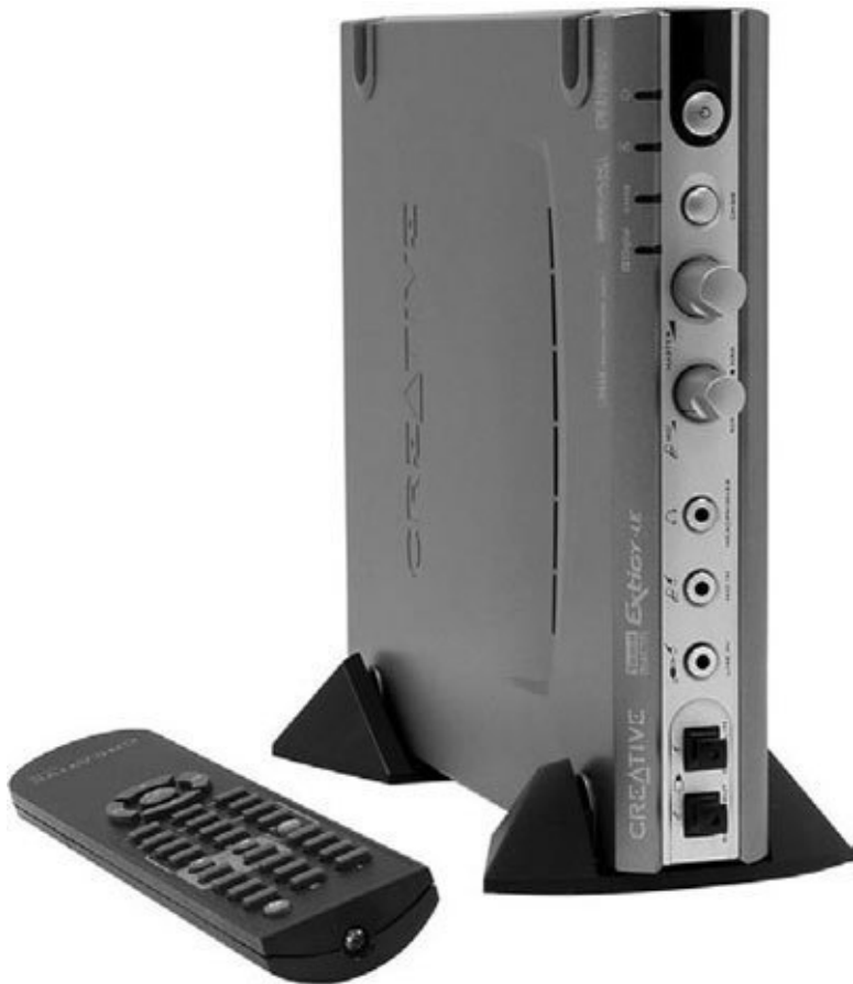
Рис. 4.9. Внешняя звуковая карта Creative Extigy, подключаемая по USB

В первом случае область применения ограничивается но-