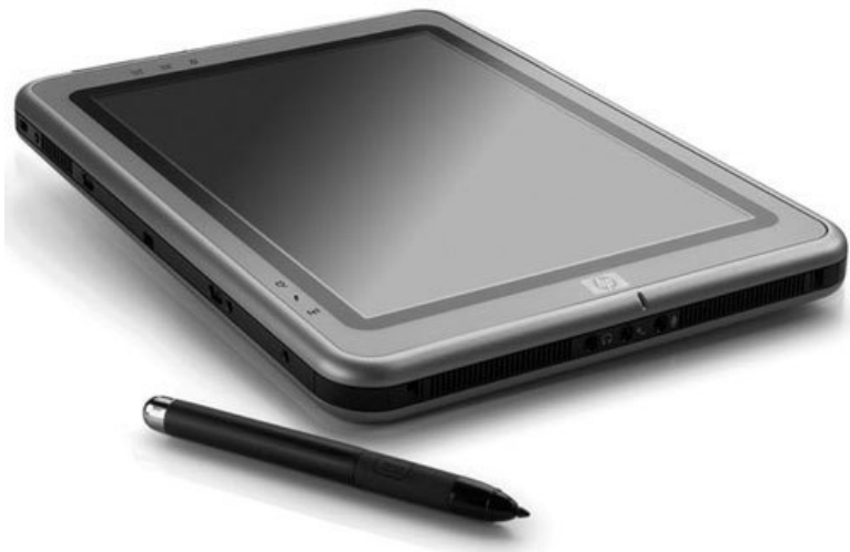
Рис. 2.6. Планшетный ноутбук

Планшетные ноутбуки (или Tablet PC, в народе – «таблетки») присутствуют на рынке довольно давно. Их можно разделить на два вида. Первый выглядит как ноутбук без клавиатуры (рис. 2.6). Вся его начинка встроена в экран, а управление производится с помощью стилуса 3 .