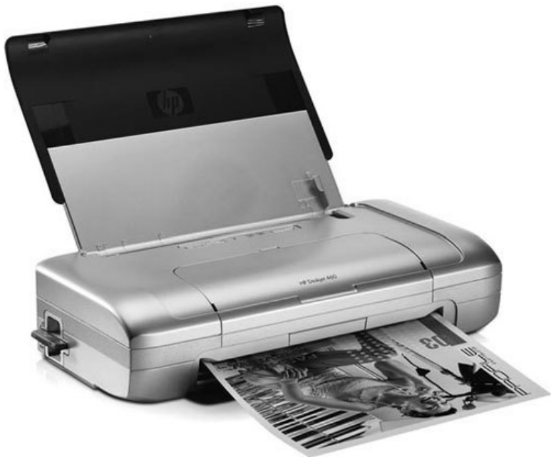
Рис. 4.6. Мобильный принтер

Главное отличие этого устройства от настольной версии заключается в значительно меньших размерах, а также в возможности автономной работы.