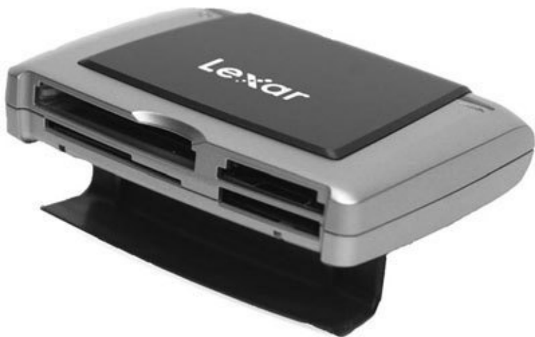
Рис. 4.10. Внешний Card-Reader с интерфейсом USB

Обычно такие устройства имеют миниатюрные размеры (которые зависят от количества поддерживаемых форматов), а также совместимы с интерфейсом USB, используемым для обмена информацией с компьютером.