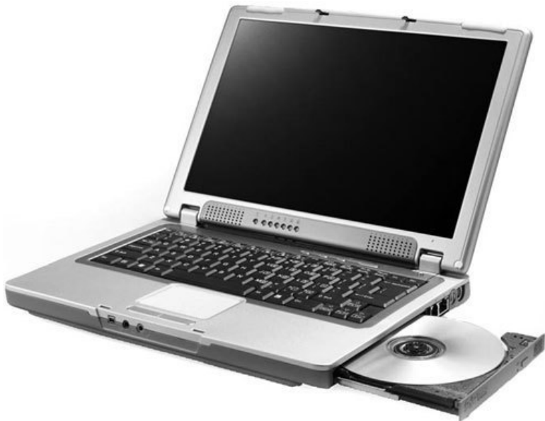
Рис. 2.5. Субноутбук

Компактность обусловила некоторые недостатки субноутбуков: