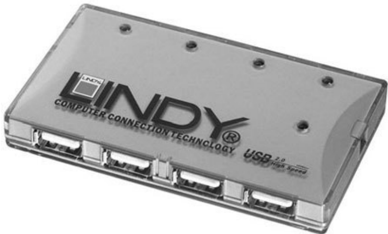
Рис. 4.15. USB-хаб на четыре порта

Обычно USB-хаб оснащен двумя или четырьмя дополнительными разъемами. Так что с его помощью вы сможете частично решить проблему нехватки USB-портов.