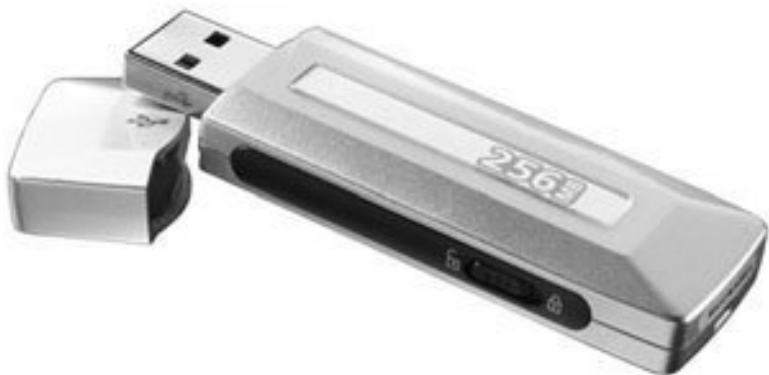
Рис. 4.13. USB-накопитель на основе flash-памяти

Есть еще один вид внешних носителей – flash-устройства USB (рис. 4.13), о которых мы уже не раз говорили. Он может оказаться для вас наиболее удобным.