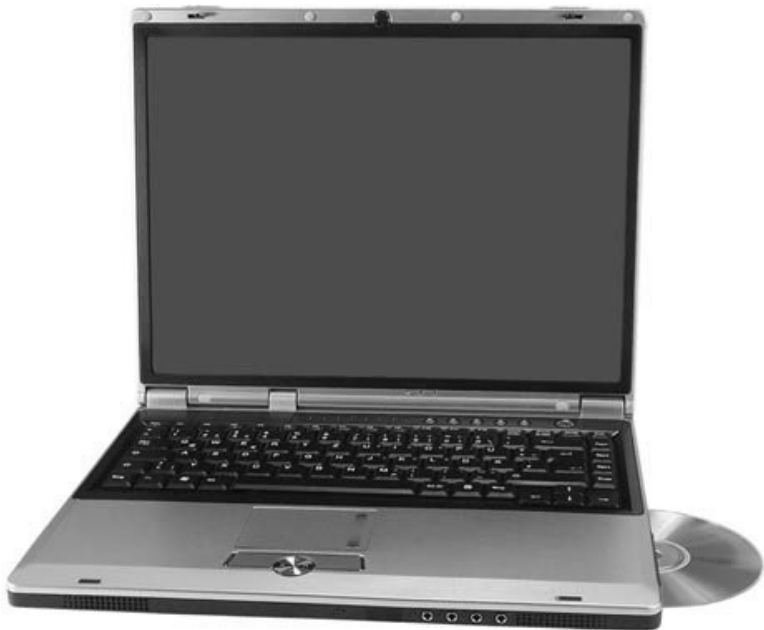
Рис. 2.1. Бюджетный ноутбук

Первая категория – бюджетные ноутбуки (рис. 2.1). При выборе компьютера этого класса главную роль играет цена, а не характеристики.