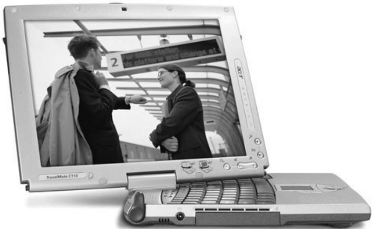
Рис. 2.7. Ноутбук-трансформер

По большому счету это обычный ноутбук, оснащенный сенсорным экраном и стилусом. Неудивительно, что устройства такого вида пользуются большей популярностью, чем планшетные компьютеры без клавиатуры.