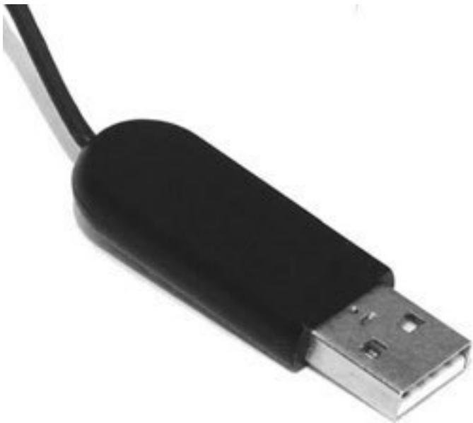
Рис. 4.2. Разъем USB

Если вы будете покупать клавиатуру для ноутбука, то она также должна иметь разъем USB. Пока в большинстве внешних клавиатур используется старый PS/2, так что будьте внимательны при выборе.