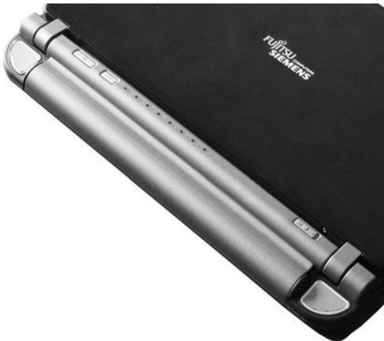
Рис. 4.4. Аккумулятор повышенной емкости

Его можно найти в той же фирме, где вы купили свой ноутбук, или обратиться в другое место. Главное, точно знать модель мобильного компьютера.