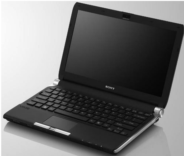
Рис. 1.1. Внешний вид нетбука

От экрана, или матрицы, больше всего зависит комфортность работы с нетбуком. Размер экрана принято измерять по диагонали в дюймах. В легких и маленьких нетбуках диагональ экрана составляет 9-12 дюймов. Собственно, размер экрана определяет габариты всего нетбука.