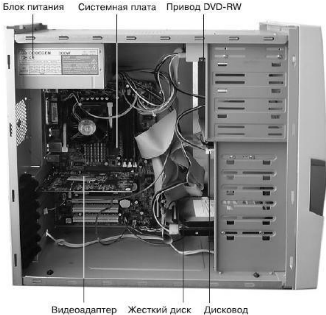
Рис. 1.1. Системный блок типичного персонального компьютера