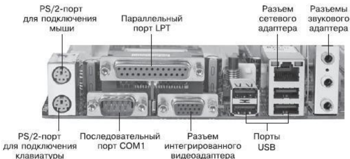
Рис. 1.4. Разъемы портов на задней панели системной платы

На рис. 1.4 показана задняя панель типичной системной платы с разъемами портов. Подробнее о настройке портов см. в гл. 9.