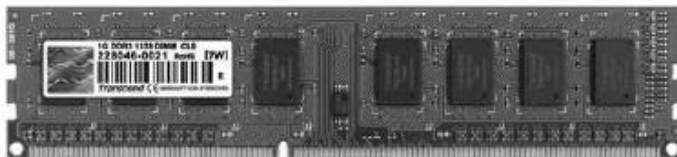
Рис. 1.3. Модули памяти DIMM