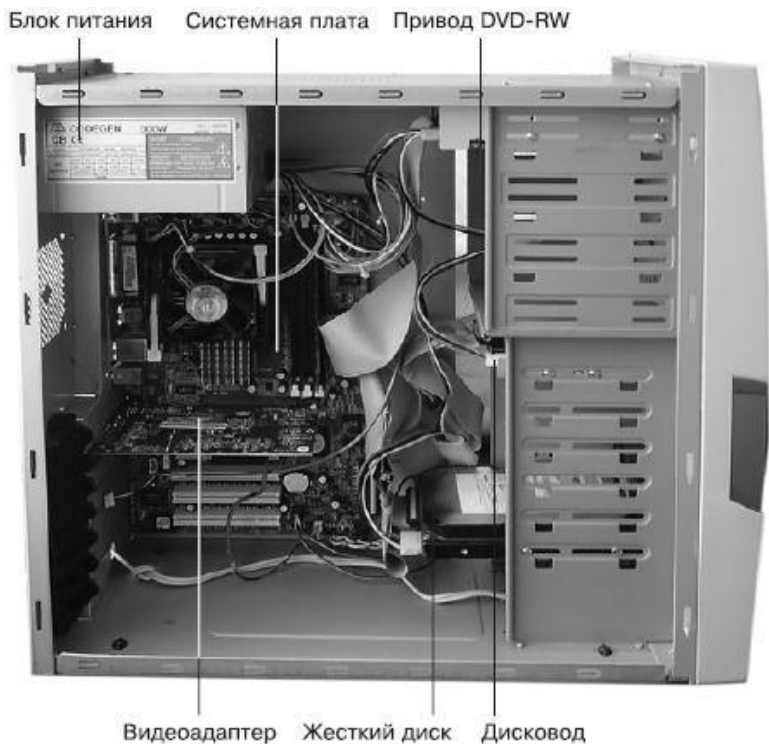
Рис. 1.1. Системный блок типичного персонального компьютера

□ Видеоадаптер. Служит для формирования изображения, которое потом выводится на монитор. Обычно выполняется в виде платы расширения, но может быть встроенным в системную плату.