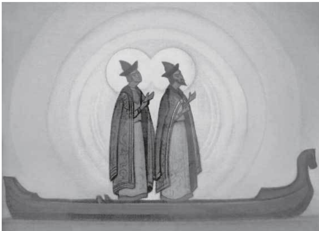
Святые Борис и Глеб. Картина Н. К. Рериха.

У двенадцати сыновей Владимира I судьба оказалась очень непростой. Всеволода сожгла вдова шведского короля Эрика. Святослава Древлянского убили. Мстислав в 1036 г. заболел на охоте и вскоре умер. Судислав Псковский 24 года сидел в земляном «порубе», был выпущен из него только после смерти Ярослава Мудрого и пострижен в монахи. Он прожил дольше всех из сыновей Владимира и умер в 1063 г.