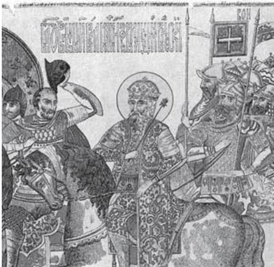
Изображение Владимира II на древнерусском знамени.

Ярослав был женат на дочери шведского короля Олафа Ингигерде (в крещении Ирине). Своих сыновей и дочерей он также женил и выдавал замуж за представителей европейских королевских домов. Сестра Ярослава Мудрого Доброгнева была замужем за Казимиром, польским королем. Дочь Ярослава Мудрого Елизавета стала женой Харальда Сурового, норвежского короля; вторая дочь Анастасия являлась женой Андрея Венгерского; его сын Всеволод был женат на дочери византийского императора Константина Мономаха; сын Святослав женат на Оде, дочери маркграфа Штадтского; сын Изяслав женат на Гертруде, дочери маркграфа Саксонского. Анна Ярославна после смерти супруга, французского короля Генриха I, некоторое время управляла страной.