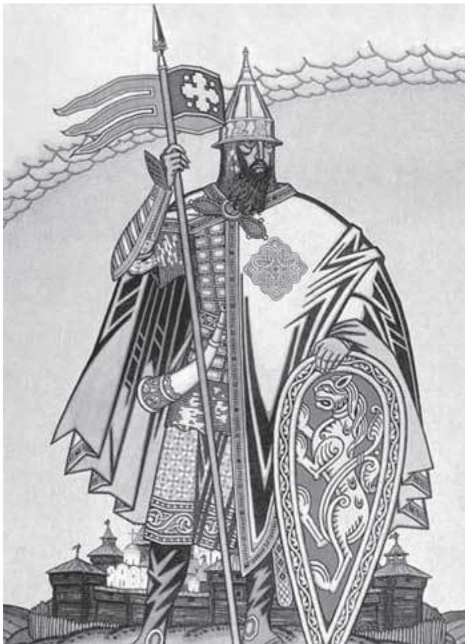
Князь Игорь. Художник И. Я. Билибин.

Игорь – первый русский князь, о котором сообщают иноземные писатели (Симеон Логофет, Лев Грамматик, Георгий Мних, Кедрин, Зонара, продолжатели Феофана и Амартола, Лев Диакон, кремонский епископ Лиутпранд). В 941 и 944 г. состоялись не очень удачные походы на Византию. В 941 г. Игорь предпринял поход на Грецию. С флотом в несколько сотен ладей Игорь пристал к берегам Вифинии, опустошил по тогдашнему обыкновению значительные территории и подступил к Константинополю. Большая часть греческого флота была в то время в походе против сарацин (арабов). Но оставшиеся суда использовали против флотилии Игоря «греческий огонь» (специальный воспламеняющийся состав) и подожгли множество русских ладей. Игорь смог уйти только с 10 судами.