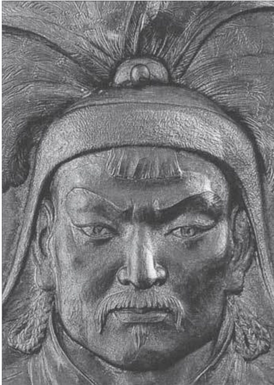
Чингисхан. Бронзовый барельеф.

Батый никогда не был самым главным в Монгольской империи, великим каганом. Этот титул формально принадлежал его двоюродному брату Мункэ. Но авторитет у Батые был огромный. Свою жизнь он проводил в походах и сражениях, в одном из которых погиб.