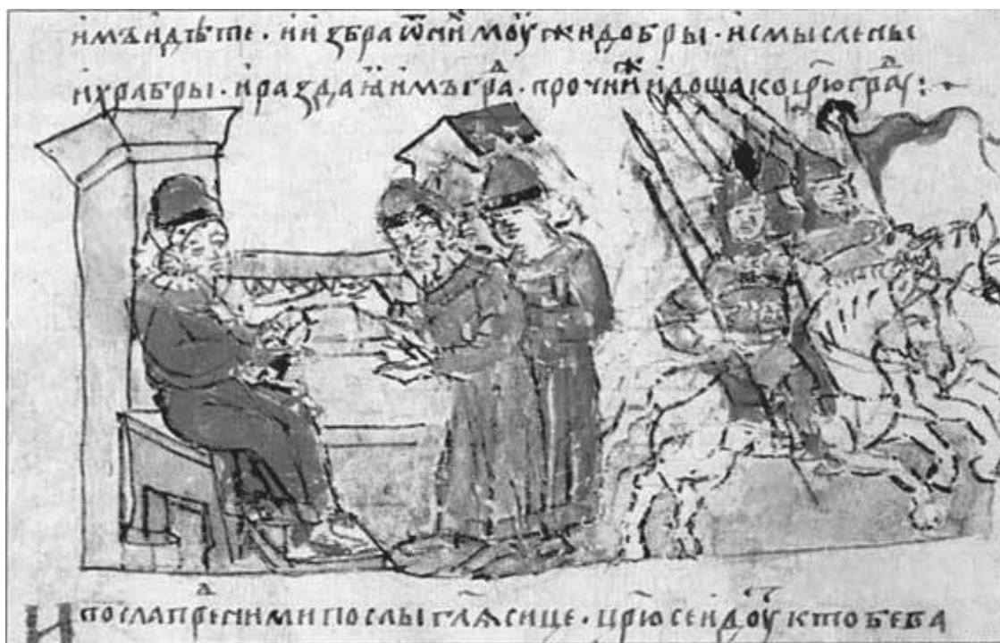
Призвание варягов. Миниатюра из Радзивилловской летописи.

Во всяком случае Рюрик занял свое место в памятнике «Тысячелетие России», что был открыт в Новгороде в 1862 г. Александром II. В состав русского военно-морского флота с 1895 г. входил крейсер «Рюрик», погибший в неравном бою с четырьмя японскими крейсерами в августе 1904 г. Изображения «Рюрика» приводятся во многих биографических и иллюстрированных изданиях. Независимо от того, будет ли найдена могила Рюрика в окрестностях Приозерска, и что скажут археологам и антропологам найденные предметы, история государства Российского будет начинаться с этого короткого и звучного имени – Рюрик.