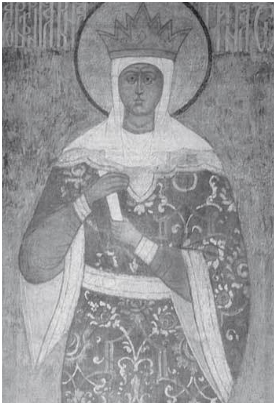
Святая равноапостольная княгиня Ольга.

Территориально-административное обустройство подвластных земель Ольга обеспечила созданием становищ и погостов, своеобразных «крепостиц», защита которых возлагалась на «воев» – воинов. Погосты и становища превращались впоследствии в административные центры государства. Погосты стали местами взимания дани, фиксированный размер которой не вызывал уже протестов населения. Историки налоговой системы считают, что дань была не только посильной, но и едва ли не самой легкой за всю историю России. Для того чтобы ни от кого не зависеть и как можно меньше раздражать население, Ольга основала первые княжеские села – Ольжичи. Доходов с этих сел вполне хватало на нужды собственно великокняжеской семьи. В русском государстве у правителей на протяжении тысячи с лишним лет было два «кармана». Один – это общегосударственные доходы, из которых финансировалось осуществ-