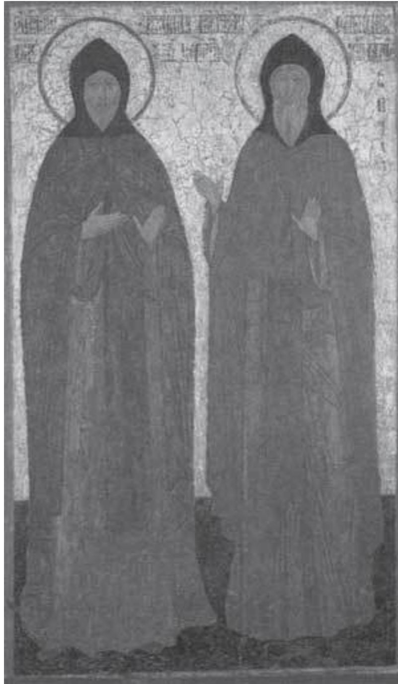
Антоний и Феодосии, основатели Киево-Печерского монастыря.

В первые годы XI в. любечанин Антоний отыскал на лесистом днепровском холме близ Киева пещеру и стал в ней жить. Подвижник принял постриг в монашество в одном из греческих монастырей на Афоне и по благословию игумена Феоктиста вернулся на родину.