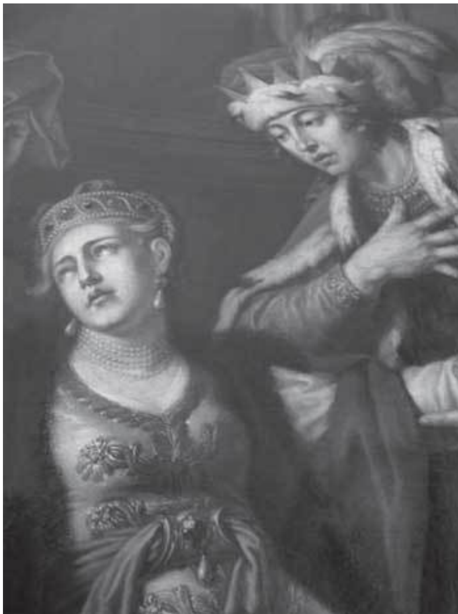
Владимир I и Рогнеда. Фрагмент картины А. Власенко