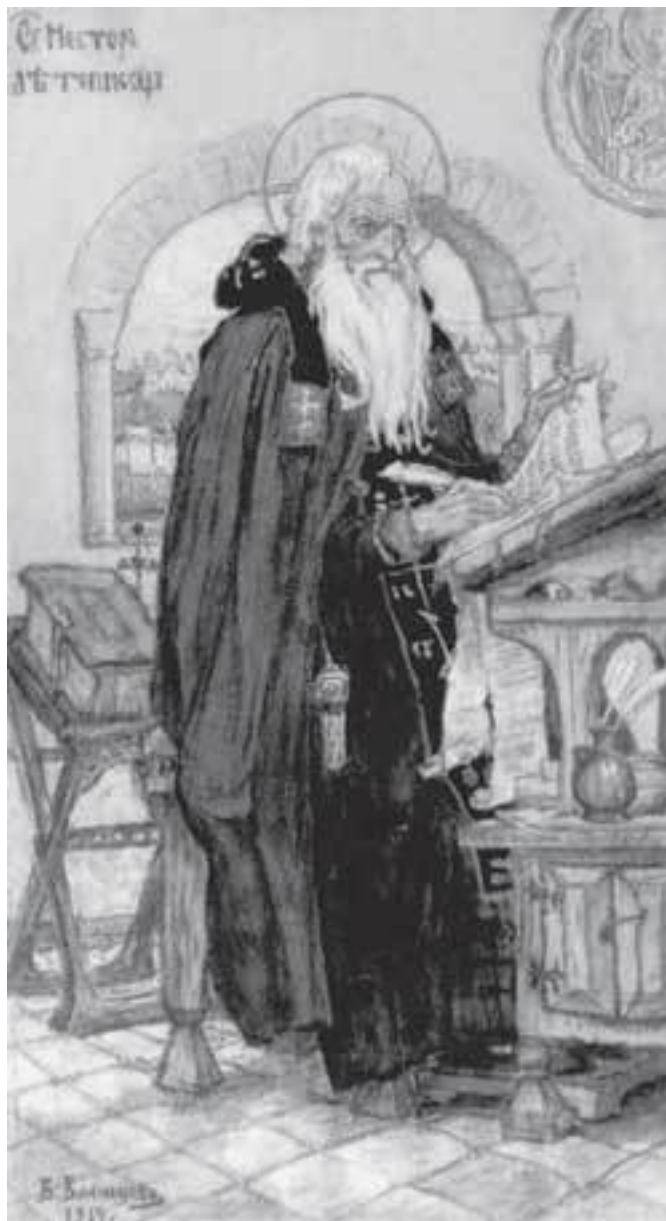
Нестор-летописец. Худ. В. М. Васнецов. 1919 г.

Нестора обычно называют первым русским летописцем. Он участвовал в составлении, был одним из авторов первой редакции (первого, исходного варианта) «Повести временных лет». Этот общерусский летописный свод лег в основу большинства дошедших до нас летописных сводов, например Лаврентьевского и Ипатьевского. Нестор использовал родовые предания, повести, сказания, жития первых русских святых, произведения древнерусской литературы. «Повесть временных лет» является одним из самых насыщенных и наиболее достоверных текстов по древней истории Руси.