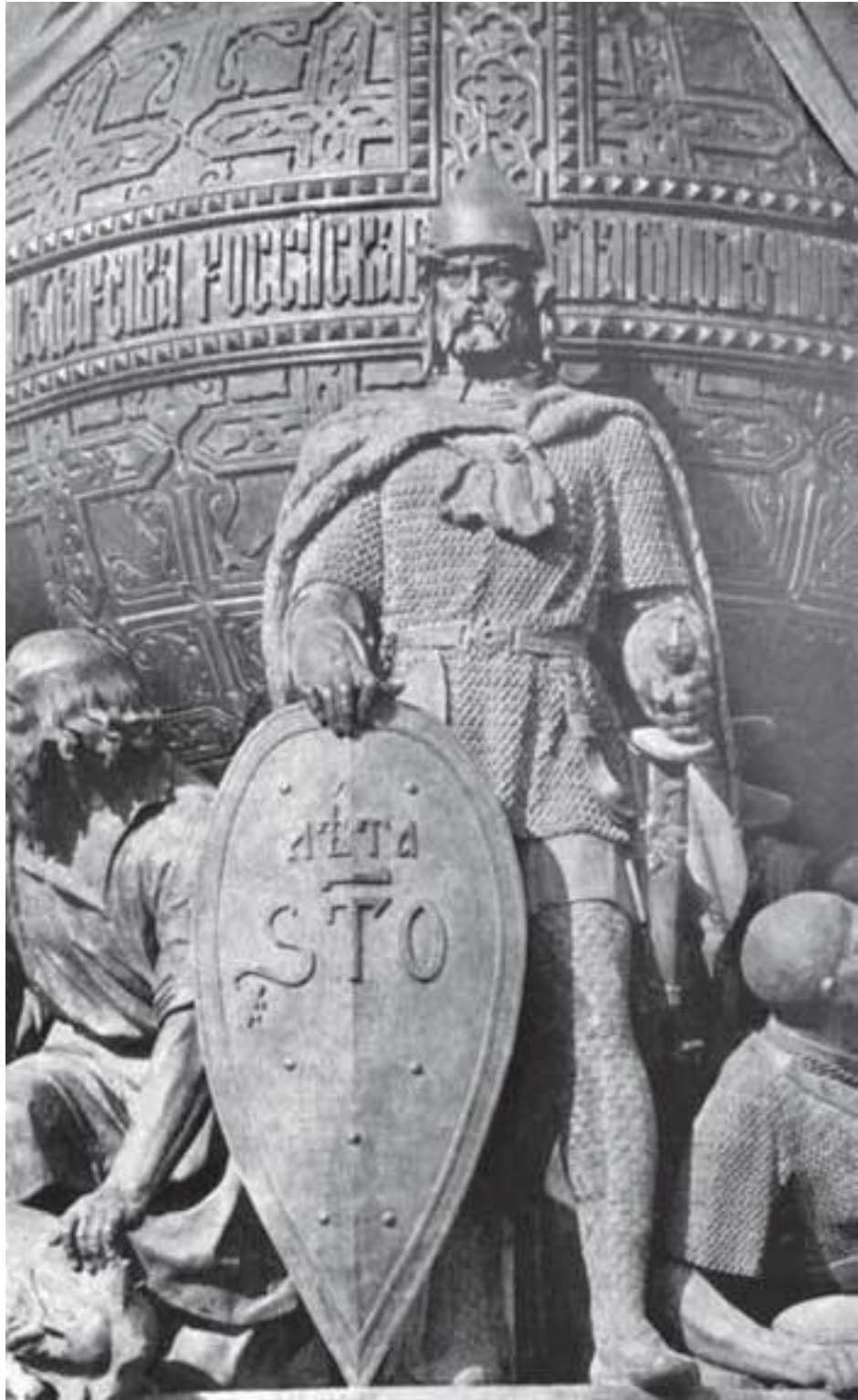
Рюрик. Памятник «Тысячелетие России». 1861—1862 гг. Новгород.

Споры вокруг «призвания варягов» во главе с Рюриком, Синеусом и Трувором продолжаются не менее двух столетий.