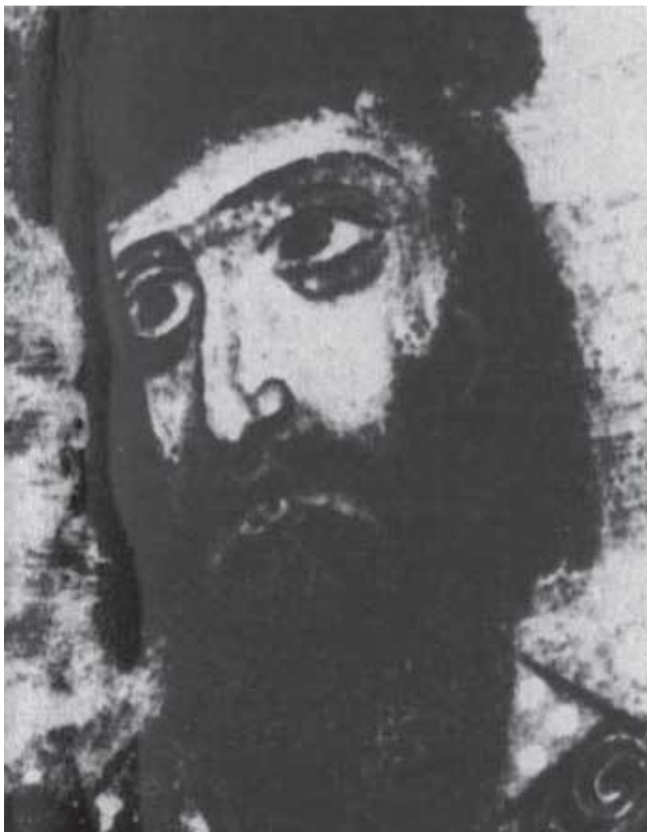
Ярослав Всеволодович, отец Александра Невского. Фреска.

мощи по повелению Петра I были перенесены в Петербург в Александро-Невскую церковь, а затем в Свято-Троицкий собор Александро-Невской лавры. Александр Невский с 1704 г. почитался покровителем нового города на Неве вслед за апостолами Петром и Павлом. После 1922 г. мощи князя оказались в Казанском соборе, а серебряный саркофаг – в Государственном Эрмитаже. В 1989 г. мощи выдающегося государственного деятеля и полководца возвращены в Свято-Троицкий собор Александро-Невской лавры.