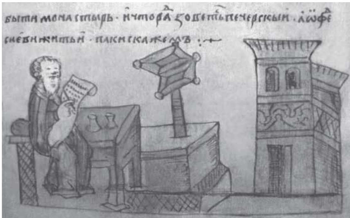
Феодосии Печерский пишет свои поучения в Печерском монастыре

Киево-Печерский монастырь стал старейшей православной обителью, оказавшей огромное влияние на духовную и культурную жизнь страны. В этом монастыре работали иконописцы, составлялись «Повесть временных лет» и Киево-Печерский патерик – сборник сказаний о жизни монахов. Здесь была открыта монастырская школа, а позже – Киево-могилянская духовная академия. Словом «лавра» стали обозначать наиболее уважаемые и чтимые среди верующих обители (Троице-Сергиева лавра, Александро-Невская лавра и др.). Киево-Печерская лавра, ныне находящаяся на территории суверенного государства Украина, почитается всеми образованными русскими людьми как святыня русской духовности и культуры.