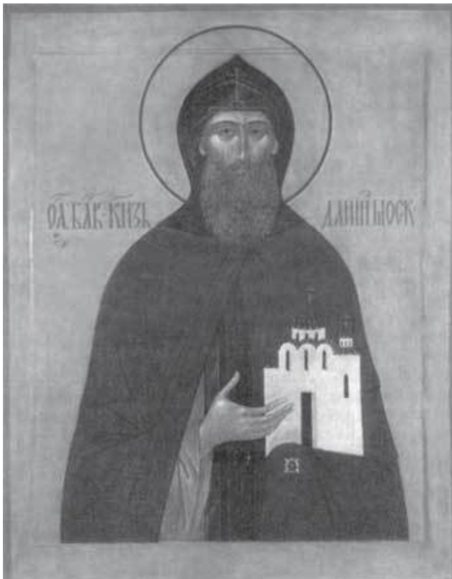
Св. Даниил Московский. Икона.

В генеалогическом отношении (по степени знатности) московские князья занимали скромное место. Даниил был младшим, четвертым сыном Александра Невского. Он участвовал в разного рода политических альянсах, княжеских коалициях в качестве младшего партнера. Например, вместе с третьим сыном Александра Невского, своим старшим братом князем Андреем Александровичем он выступает против второго сына Александра Невского, который был старше обоих и к тому же великим князем Владимирским. Для потомков Даниила, которые, являясь ветвью рода Рюриковичей, стали называться Даниловичами, низкий «рейтинг» стал своеобразным вызовом, стимулом в политической борьбе. На это обстоятельство обратил внимание еще В. О. Ключевский.