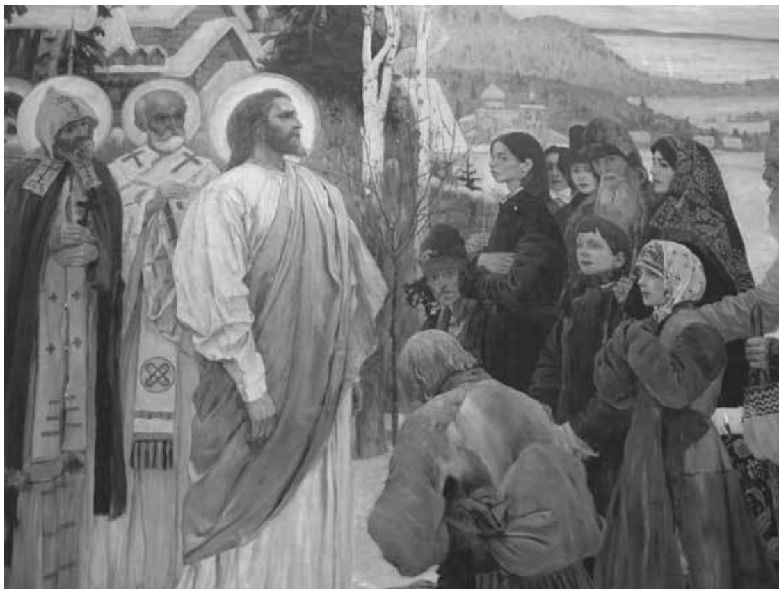
Андрей Первозванный. Картина Н. В. Нестерова.

Путешествие Андрея Первозванного впечатляет. Если русские люди использовали путь «из варяг в греки», то сподвижник Иисуса Христа двигался в обратном направлении и может считаться не только Первозванным, но и первопроходцем, возможно, впервые проложившим путь для будущей торговли будущих православных христиан. Для Русской православной церкви предание об апостоле Андрее имеет большую ценность также и потому, что подтверждает религиозную независимость Руси от греков и Византии. Получается, что русские приняли веру от того же апостола, что и Рим. «Мы получили веру при начале христианской церкви, когда Андрей, брат апостола Петра, приходил в эти страны, чтобы пройти в Рим. Таким образом, мы в Москве приняли христианскую веру в то самое время, как вы в Италии, и содержим ее ненарушимо», – объяснял Иван Грозный католику-иезуиту еще в XVI в.