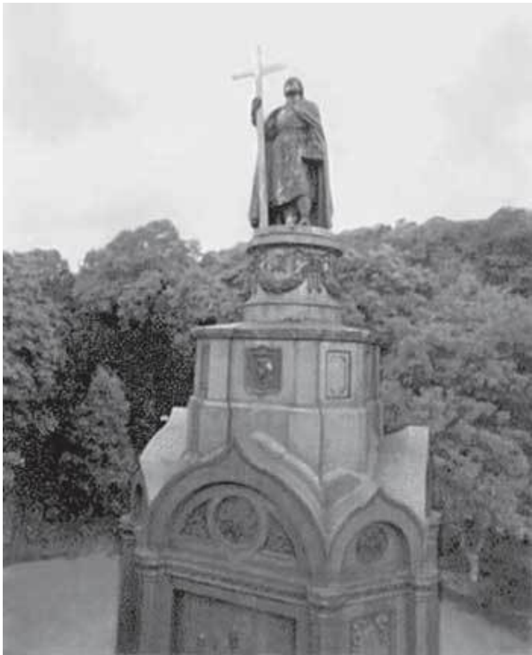
Памятник Владимиру Святому в Киеве.