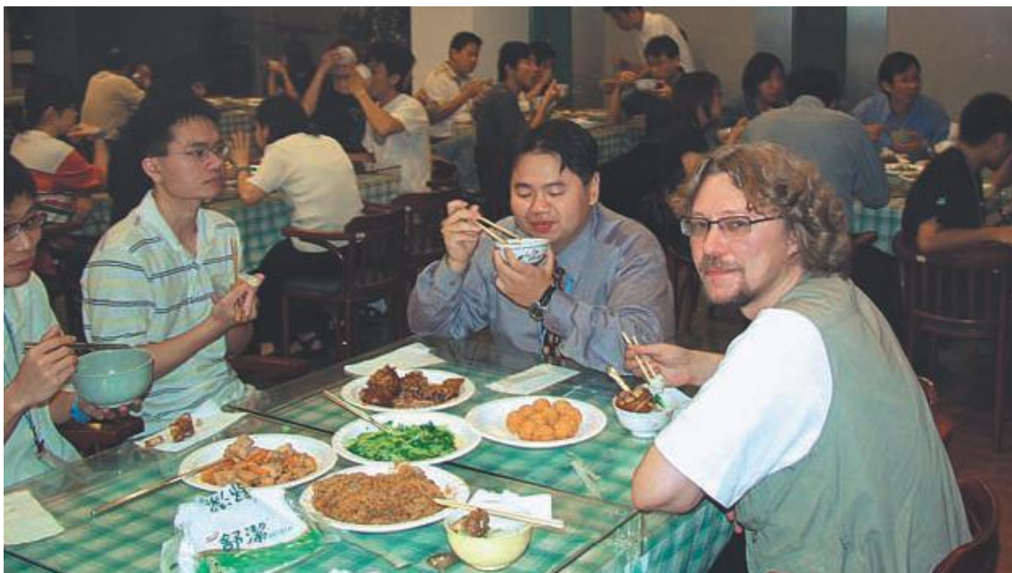
В столовой Iwill

На огромном прожекторном экране столовой Iwill идет местная программа новостей. Сюжет фантастичен! Тайбэйские таксисты просят правительство сократить их численность.