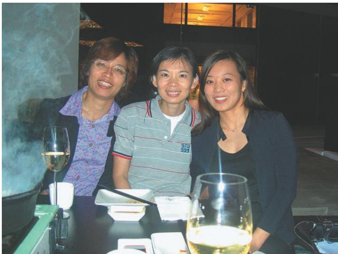
Патрисия с подругами

Столики расположены в углублениях пола, и, лавируя между стойкой бара и местом сидения, все время норовишь рухнуть на чей-нибудь стол, сломав очередной тайваньской знаменитости шею и сметя с чужого стола все их японское пиршество.