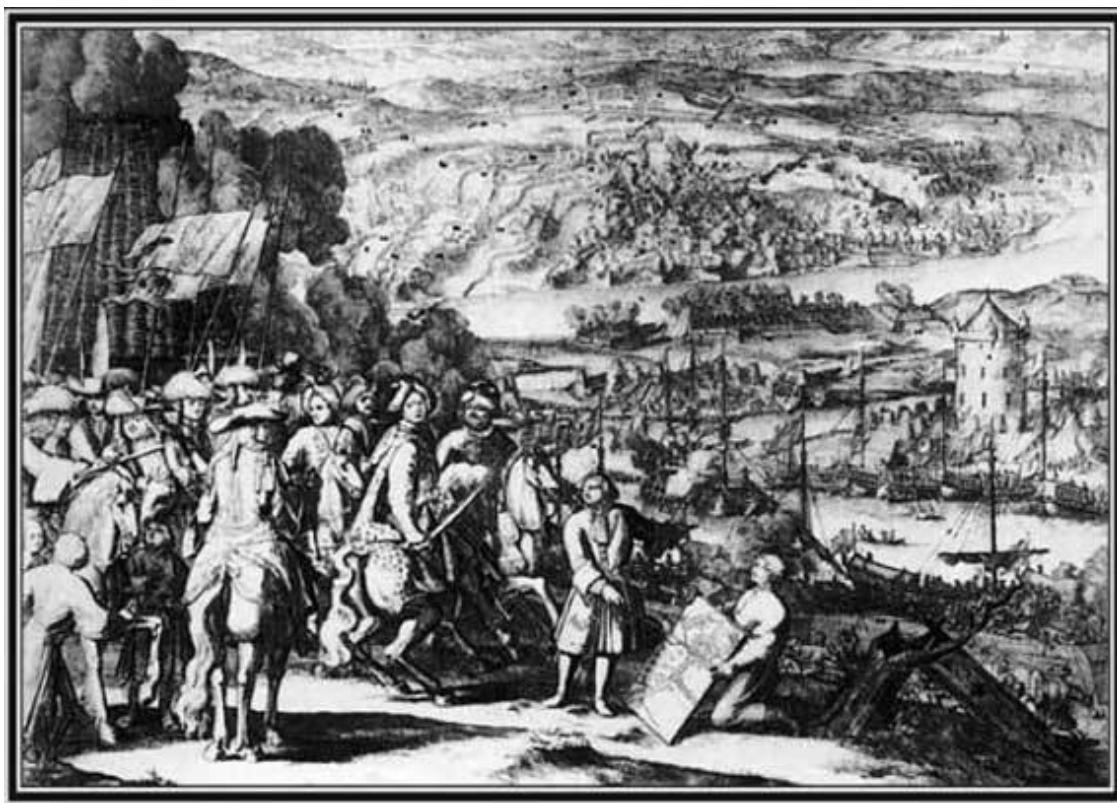
Осада Азова в 1696 г. А. Шхонебек. 1699—1700 гг.

впервые увидел западноевропейскую цивилизацию во всем ее военном и культурном могуществе, почувствовал ее дух, смысл и силу. Он вывез из Европы не только знания, впечатления, трудовые мозоли, но и идею, которую для себя формулировал предельно просто: чтобы сделать Россию столь же сильной, как и великие державы Европы, необходимо как можно быстрее перенять у Запада все необходимое. Именно тогда окончательно оформилась ориентация Петра на западноевропейскую модель жизни, и это означало автоматически отрицание жизни старой России, последовательное и порой ожесточенное неприятие, разрушение старого, ненавистного, того, что ассоциировалось с врагами: Софьей, стрельцами, боярством.