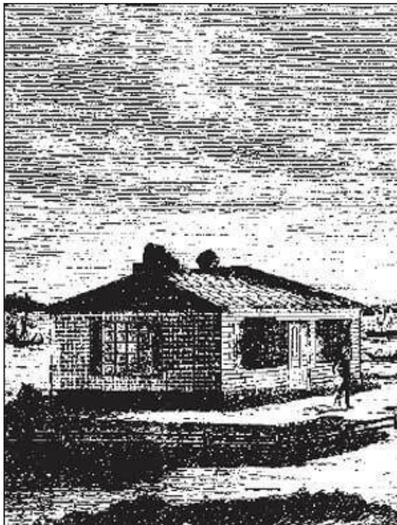
Домик Петра Великого в Петербурге.

Но это лишь одна сторона петровского демократизма. Гораздо важнее другая, имевшая далеко идущие последствия. Тот же Юль записал 10 декабря 1709 года: «После полудня я отправился на Адмиралтейскую верфь, чтобы присутствовать при поднятии штевней на 50-пушечном корабле, но в тот день был поднят один форштевень, так как стрелы оказались слишком слабы для подъема форштевня. Царь, как главный корабельный мастер (должность, за которую он получает жалованье), распорядился всем, участвовал вместе с другими в работах и, где нужно было, рубил топором, коим владеет искуснее, нежели все прочие присутствовавшие там плотники. Бывшие на верфи офицеры и другие лица ежеминутно пили и кричали.