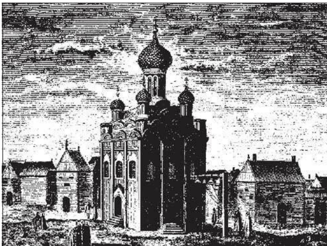
Московская площадь в конце XVII столетия.

Силою политических обстоятельств Петр был как бы выброшен из этой системы. Разумеется, он появлялся в Кремле в дни официальных праздников и аудиенций, но все это было чуждо ему и даже, учитывая отношение к нему родственников по отцу, враждебно. Преображенское с бытом летней царской дачи – резиденции, окруженной полями, лесами, – дало ему то, что резко способствовало развитию его способностей: свободу времяпрепровождения с минимумом обязательных занятий и максимумом игр, которые, как и всегда бывает у мальчишек, носили военный характер. С годами они усложнялись, а так как участниками этих игр были не куклы, а живые люди, мальчишки, ровесники Петра, то обучающее и развивающее значение этих игр было огромно. Уже здесь проявились присущие Петру природные данные: живость восприятия, неутомимость и неиссякаемая энергия, страстность и самозабвенная увлеченность игрой, незаметно переходящей в дело. Благодаря этому «потешные» солдаты и старый английский бот, найденный в сарае, не остались только игрушками, а стали началом будущего грандиозного дела, преобразовавшего Россию.