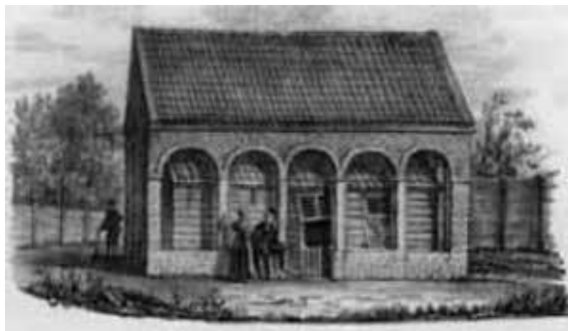
Домик Петра I в Саардаме в 1697 г. Неизвестный гравер.

Первое, на что обращали внимание наблюдатели и что их более всего поражало в Петре, – это его необычайная внешность, простота образа жизни и демократизм в общении с людьми разных слоев общества. Его современник, автор вышедшей в 1713 году в Лейпциге книги, вспоминая поразившие его в царе привычки и черты, писал: «Его царское величество высокого роста, стройного сложения, лицом несколько смугл, но имеет правильные и резкие черты, которые дают ему величественный и бодрый вид и показывают в нем бесстрашный дух. Он любит ходить в курчавых от природы волосах и носит небольшие усы, что к нему очень пристало. Его величество бывает обыкновенно в таком простом платье, что если кто его не знает, то никак не примет за столь великого государя... Он не терпит при себе большой свиты, и мне часто случалось видеть его в сопровождении только одного или двух денщиков, а иногда и без всякой прислуги». Совершенно одинаково он вел себя и за границей, и дома. Шведский дипломат Прейс, встречавшийся с Петром в 1716—1717 годах в Амстердаме, среди особых черт царя отмечал: «Он окружен совершенно простым народом, в числе его перекрещенец-еврей и корабельный мастер, которые с ним кушают за одним столом. Он сам часто и много ест. Жены и вдовы матросов, которые состояли у него на службе и не получали следующих им денег, постоянно преследуют его своими просьбами об уплате...»