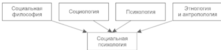
Рис. 1.1. Науки, лежащие в основе социальной психологии

В этом общем русле развития гуманитарных наук естественно сформировалась социальная психология, питательной средой для которой послужили социальная философия, социология, психология, этнология и антропология.