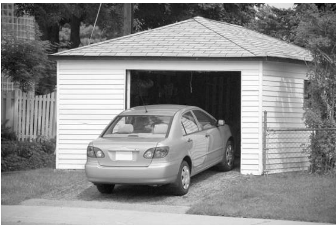
Рис. 2.4. Гараж, стоящий отдельно от дома

Сторонники компактного строительства обычно заявляют, что главный плюс «совмещенного» дома – снижение затрат на отопление: мол, гораздо дешевле отапливать всего один дом вместо нескольких построек. Но практика показывает, что затраты на отопление в обоих случаях различаются незначительно.