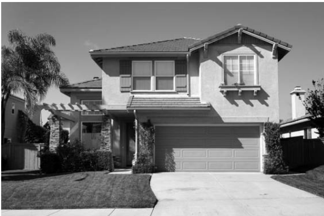
Рис. 2.3. Гараж, расположенный непосредственно под жилыми помещениями