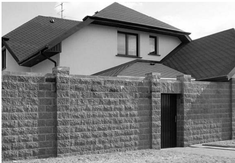
Рис. 2.5. Вход в дом непосредственно с улицы через тамбур

На третьей стадии планируется размещение на участке других построек: гаража, бани, хозяйственных сооружений и т. д. , а также сада и огорода. Если вы любите цветы, стоит заранее продумать, где лучше всего разбить клумбы того или иного типа. В противном случае вы можете обнаружить, что на идеально подходящем для альпийской горки месте уже начали обустраивать площадку для пикников или декоративный пруд.