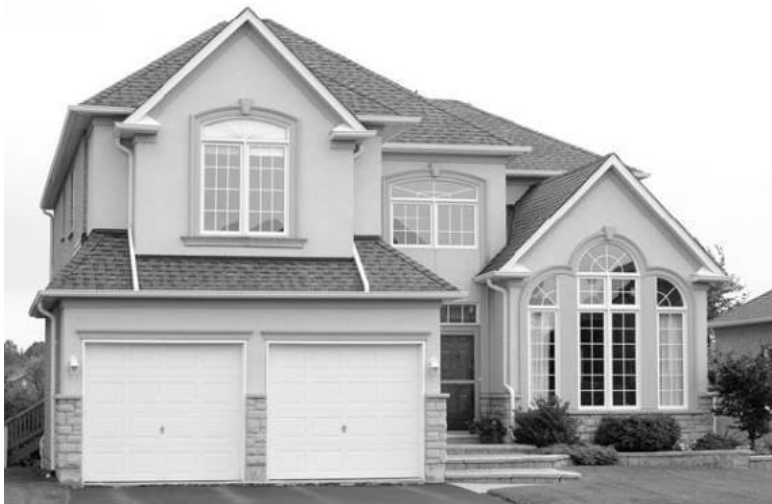
Рис. 2.2. Гараж, примыкающий к дому