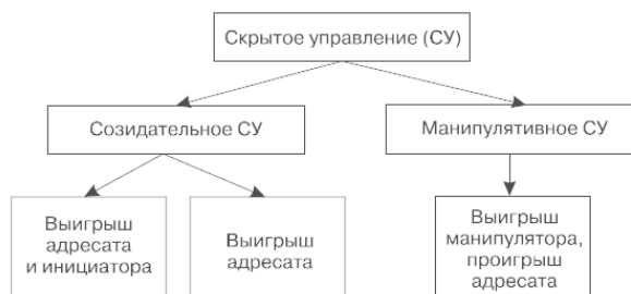
Рис. 1.1. Виды и результаты скрытого управления

Приемы скрытого управления развились в процессе разрешения практических ситуаций, когда в сознании убеждаемого присутствовал «очаг сопротивления» и он не был склонен прислушаться к доводам убеждающего его человека.