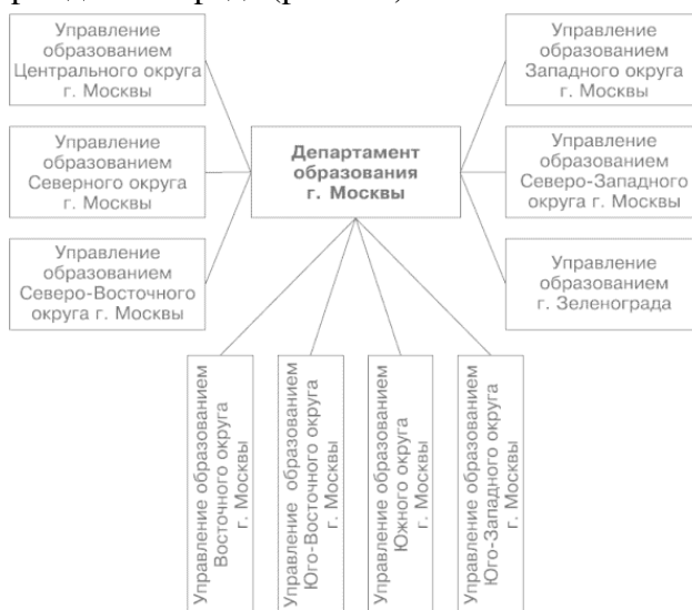
Рис. 1.1. Общая схема управления образованием г. Москвы

Городской департамент образования формирует целостное образовательное пространство, определенным образом структурирует его, определяет современное содержание, формы и методы образования, возглавляет и организует сам процесс образования в городе. Департаменту подчинены окружные управления образованием, которым, в свою очередь, подчиняются все образовательные учреждения города (рис. 1.1).