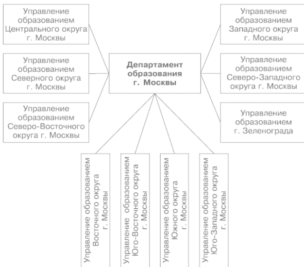
Рис. 1.1. Общая схема управления образованием г. Москвы

Психологическая служба, ориентированная на психологическое обеспечение образовательного процесса, представлена во всех структурных подразделениях образования. Департамент образования взаимодействует по вопросам психологической службы со всеми окружными управлениями образования, а через них – со всеми образовательными учреждениями города. Управление психологической службой в городской системе образования можно представить в ви-